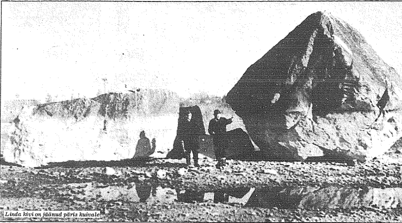
Linda kivimäe jämsud püris kuivale

KOLMAPÄEVAL, 17. novembril 1976 Nr. 86 (4176)