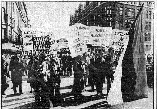
Eesti sotsiaaldemokraatide grupp mars!s rahvus!puga tiirklaste taga, j!rgnesid l!tased (Foto Andres Loo!).

Stockholmi sotsiaaldemokraatide rongk!igus o!id esindatud ka sekord mitmesugused v!hemusgrupid, nende hulgas eesti ja l!ti sotsiaaldemokraadid.