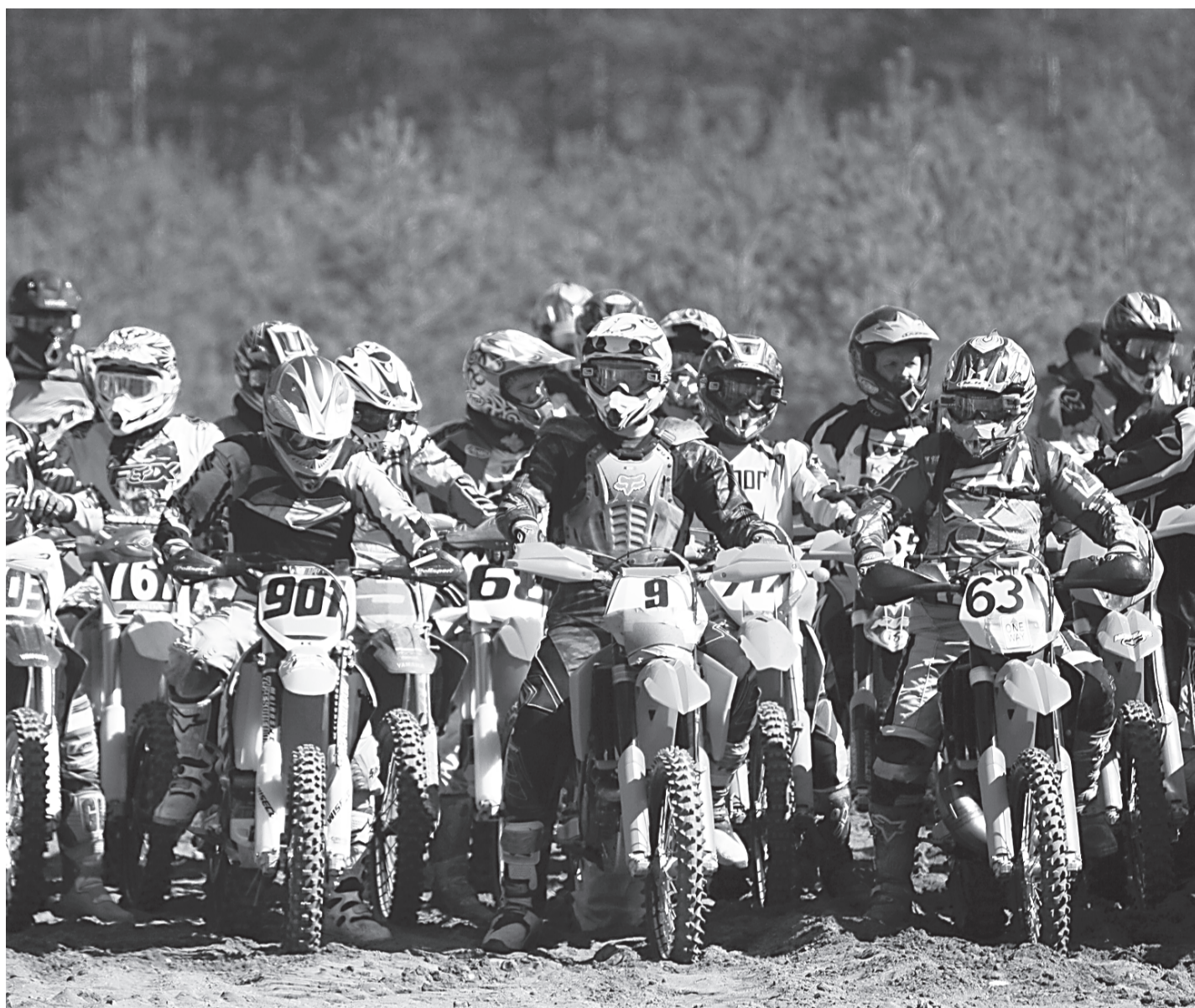
Soolomootorratturid ootavad starti, et pääseda kuivale ja tolmale rajale.