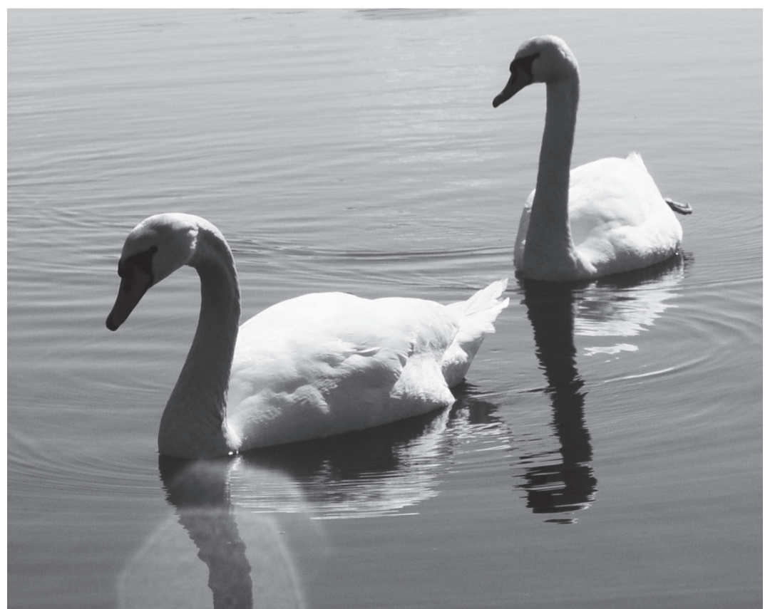
Viis maa-alust jõge avanevad maalilisse Paekna järve. Järvest saab alguse Väana jõgi.