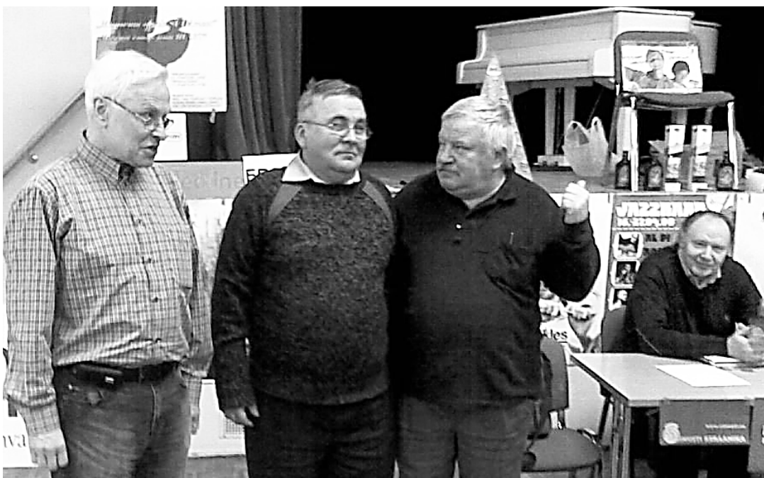
Võistkond Susu Scrofa. Teatriteemalises mängus korjasid nad 60 punkti ja võitsid muudele võitjatele lisaks Gravex Balti "kuldmedali".