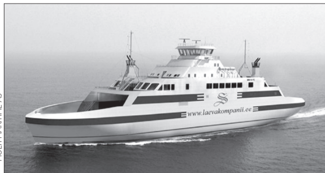
PLUUT MARITIME AS