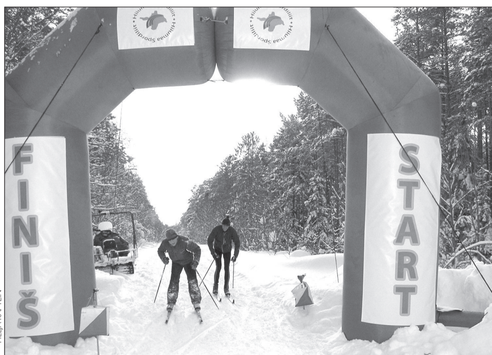
Uhket sinist stardi- ja finišiväravat kasutas Hiiu maakonna spordiliit kolmapäeval alles teist korda.