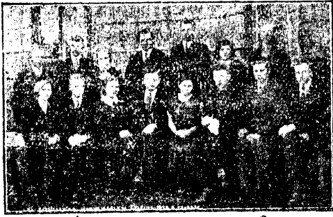
1. auhinna omandanud Lääne-Mõisa- külla hariduseltsi õping