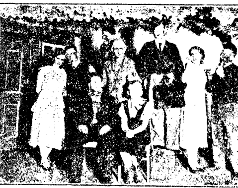
Kullamaa lawatunsti õpingi liikmed „Santipref-steri“ lawatunsti puhul