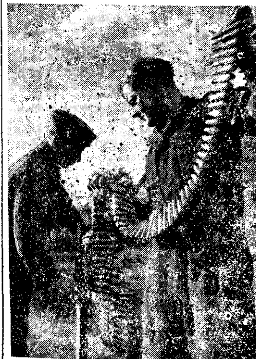
Nagu ahelas on kuulipilduja linds padrun padrunil kõrval. Reluur kontrollib tähepanelikul padrunite seisukorda.