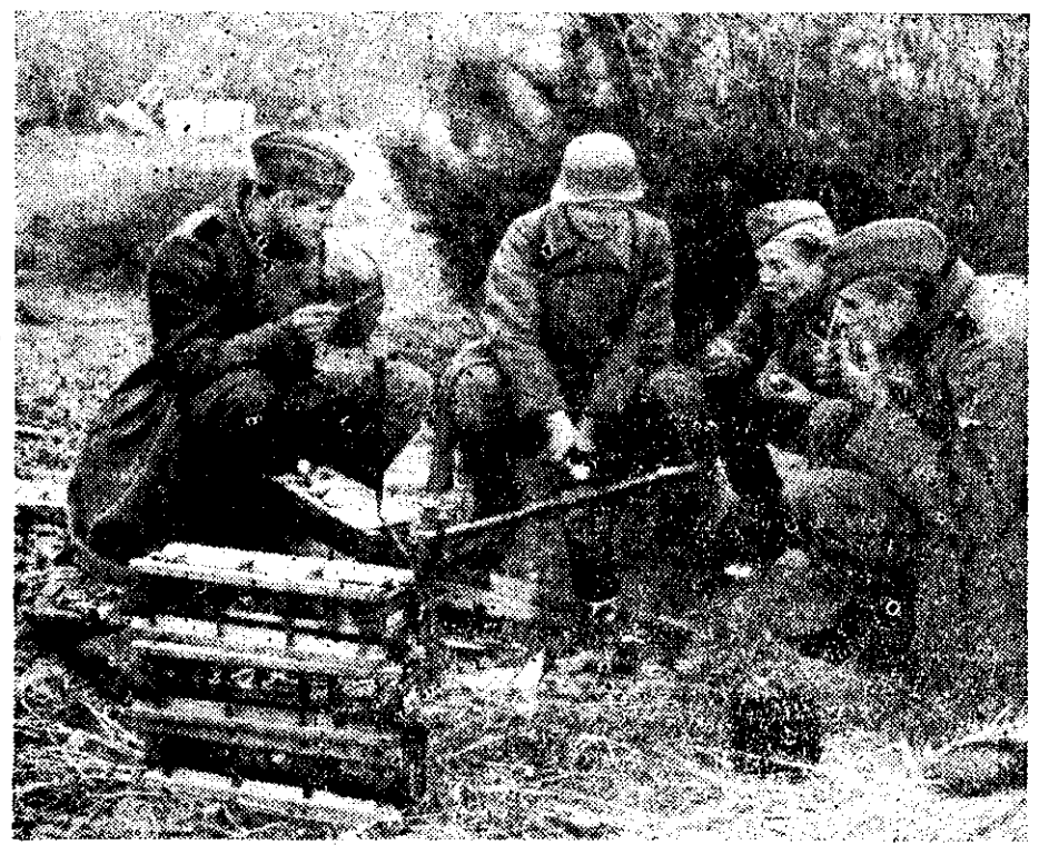
EESTI SS-VABATAHTLIKUD BOLSHEVISMIVASTASES VÕITLUSES Lahingute vaheajal. Väikese tule kohal valmistavad Eesti SS-vabatahtlikud endale suupärast glühveini.