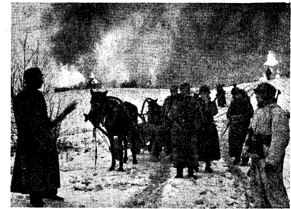
EESTI SS-VABATAHTLIKE BRIGAAD BOLSHEVISMIVASTASES VÕITLUSES Võitlusringis: Sin on bolshevikud end ennist endale vastupanupärad. Eesti SS-vabatahtlikud, oma künepäevases visas võitluses võiskasid bolshevikud oma positsioonidest ja pandid need pead põlema. SS-sõjakirjasaatja Hoffstätter

Sõjalukorras ei teki raskusi ainult rahvatööstustel, vaid ka koduloomade söödakaarti tuleb härapida ja saavutada rahuldavalt tulemasi majapidamises olevate väheväärtuslike söödodega. Karjapidajail on teada, et vähene korjesööda varu tingib veistele kui ka hobustele õigete söötmise. Toitainete poolest kehvemad ja raskelt seeditavad mad on talvilja õled ja suvinisu pöök, kuna odra ja kaerapöök on keskmise toiduväärtusega. Meile juba tuntud võte — õlgede aurutamine ja silerimine — ei tõsta selle sööda toiteväärtust, küll aga muudab sööda loomadele suupärasemaks ja vähendab närimiseks kuluvat energia hulka, sest õled hakseldatakse enne kui need sileritakse, või aurutatakse. Alates eelmisest maailmasõjast katsetas Saksa tuntud eriteadlane Lehmann õlgedega, keetes neid surveallihelise liandamisega. Selle tulemusena omasid niivisi läbitõotatud õled pea võrdse toiteväärtuse heintega. Samal viisil on katsetanud prof. O. Kellner, kellel liks korraldada eeltoodud menetlusel osa inkrusteer-