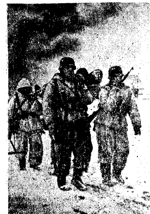
Veel võitluse kestel kannavad kamraadid haavatut lahingumõistet. (Pr-s. Götze Wb)

Maaväring on purustanud veel kaks linnas Buenos Aires, 18. 1. (DNB). Maaväring Kordiljeerides on suurimaks loodusõnnetuseks, mis Argentiinat on tabanud käesoleval sajandil. Mitte üksnes San Juan,