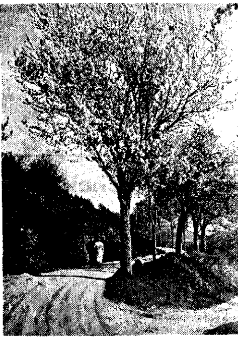
Mai on tulnud

Järele läbivaatus Tallinnas on 15. juunil.