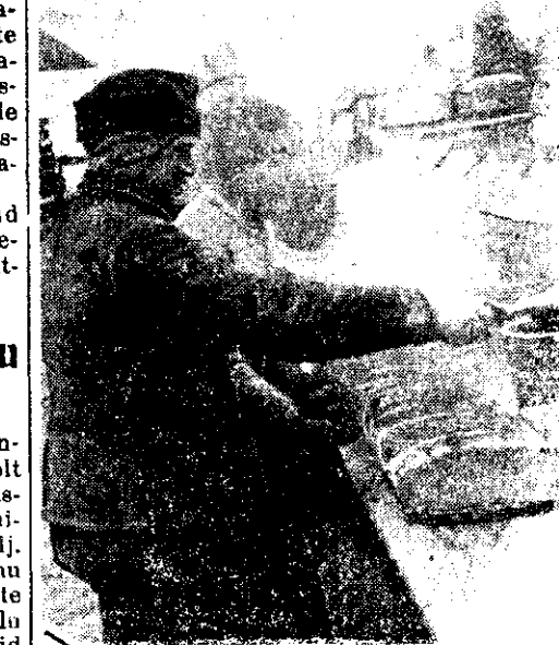
Jahust on saanud leivapütsid

Põllumajanduse Keskvallituse kalandus- osakonna poolt tuleb tänavu ehitamisega mitmele poole kalahaude maju. Lähemal päevil alustatakse kalahaudemaja ehitustöö- dega Hiiumaal Emmastes.