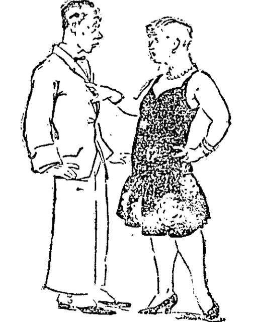
„Anne Peeter, ära püüa mulle walekanda, ja oled jälle kuigil naiste hulgas olud, sul on nii lange suitse lõhn juures.”