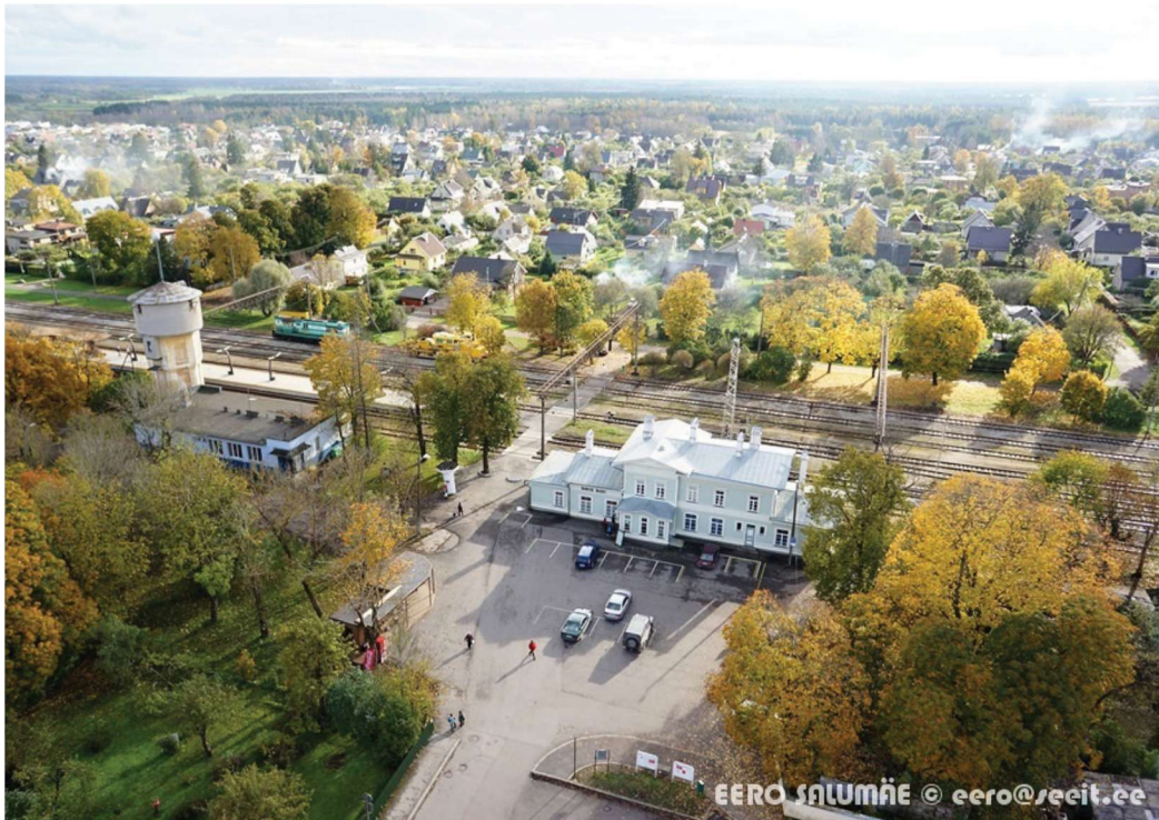
► Sügisene vaade raudteejaamale ja aedlinnale.