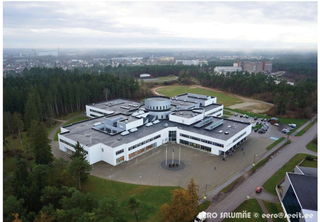
► Keila Kool on ilus ka õhust vaadates.