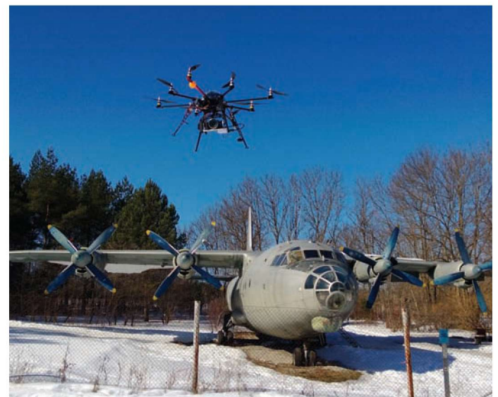
► Selline näeb välja lendav multikopter.