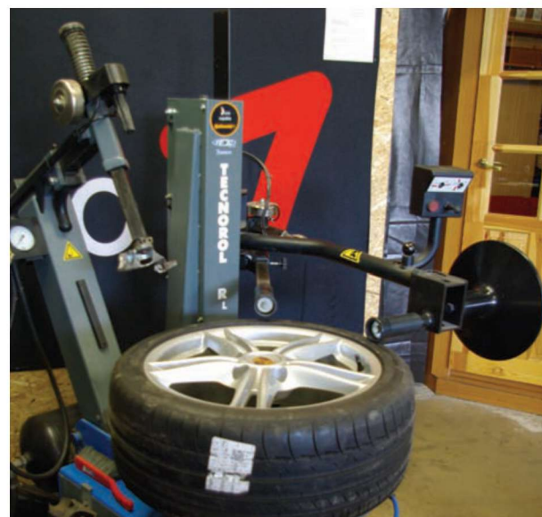
▶ Heades tingimustes on lust tööd teha.