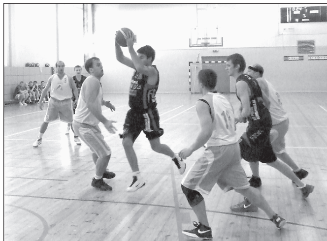
BC Kala ja KK Rápina Kotkad mõõtu võtmas.

8. detsembril mängivad SK Känguru - Vastse- Kuuste ja Kanepi/Kõlleste - Värska Vesi. 9. detsembril kohtuvad SK Mooste Mõis