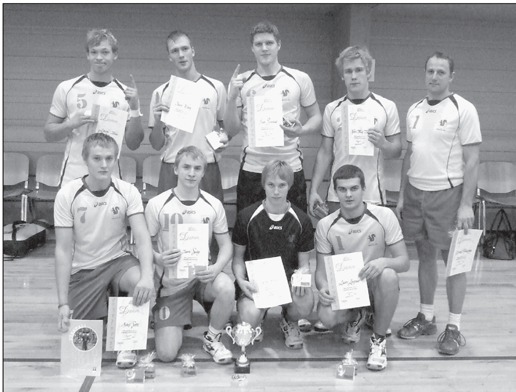
Orava meeskond võitis karika, alistades kõik vastased 2:0.