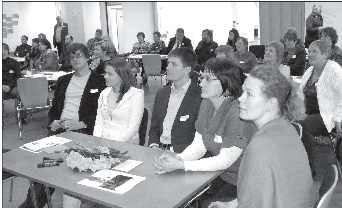
Aare Plaki fotod

Pärnu Postimehe lugeja saatis veebitoimetusele foto Pärnus aias marjad otsa kasvatanud maasikapõõsast. «Istutasime rippmaasika augusti lõpus mulla sisse talvituma ja lõikasime tookord kõik lehed maha. Täna, päev enne teist adventi, on tal suured valged maasikad otsas.»