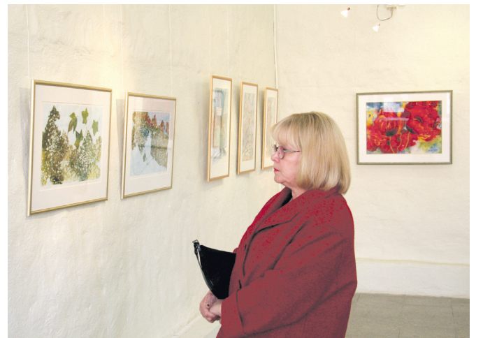
Kuke galerii näitus on avatud 21. maini, kunstikooli galerii oma (fotol) 25. maini. Mõlemad ekspositsioonid on ühtlasi müüginäitused.

Vuontela esineb näitusel akvarellidega, kus näeb Soomepäraseid maastikke, mere- ja linnavaateid. Teiste hulgast torkavad enim silma verevad moonid, mis mõjuvad erkse värvilaiguna muidu üsna tagasihoidlikus koloriidis.