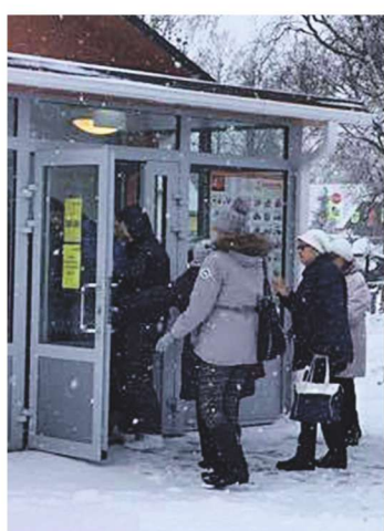
Järjekord ukse taga.

Esimesed ostjad aga käisid poes juba teisipäeva õhtul, kui pood oli veel kinni. „Panime kau-