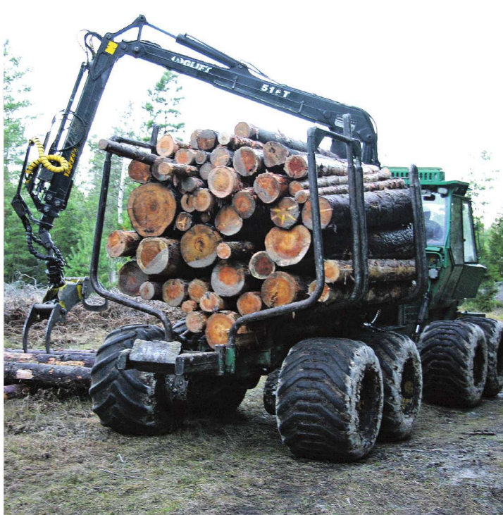
Rasked metsaveomasinad võivad kergesti tee lõhkuda.

Oma murele lahenduse saamiseks pöördus Prees vallavalitsuse poole.