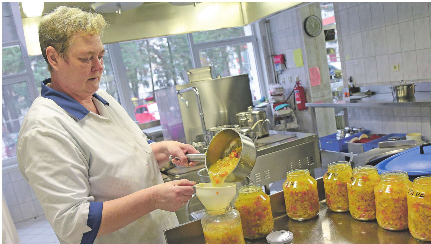
Kolm korda nädalas viiakse sotsiaalmajast abivajajatele koju suppi.