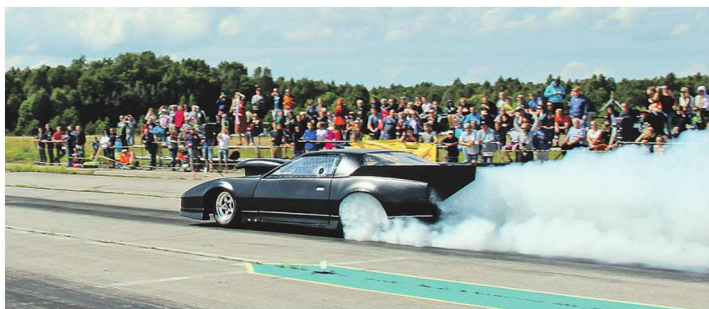
Kiltsi lennuväli on kiirete autode lemmikpaik.