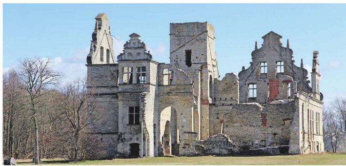
Ungru loss on Eesti üks mõjuvamaid neobarokseid hooneid.

gi tulevase Ridala valla tuumik, millele liideti juurde külasid nii Võnnu kui ka Asuküla ja Martna vallast.