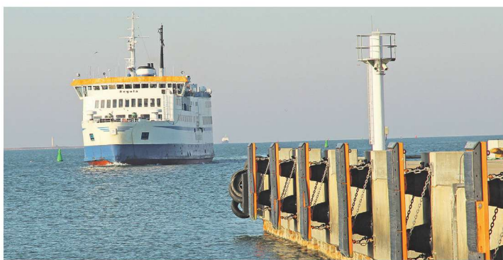
Ridala valla merevärv on Rohuküla sadam.