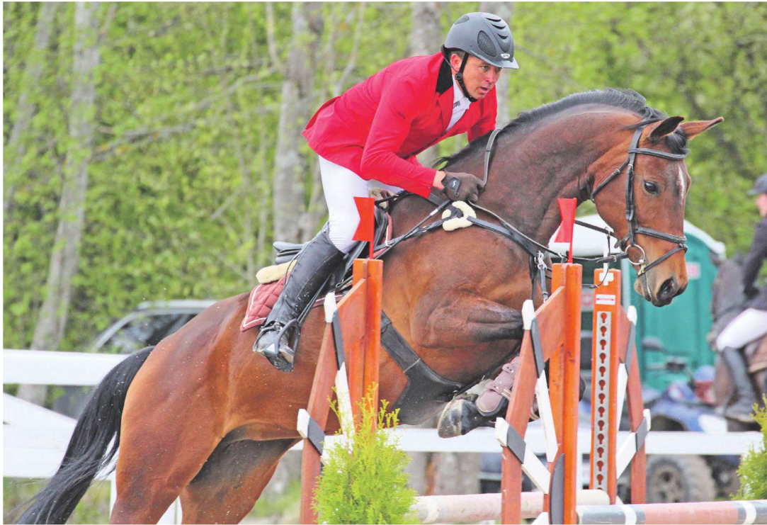
Ratsutada saab Ridala vallas mitmel pool.