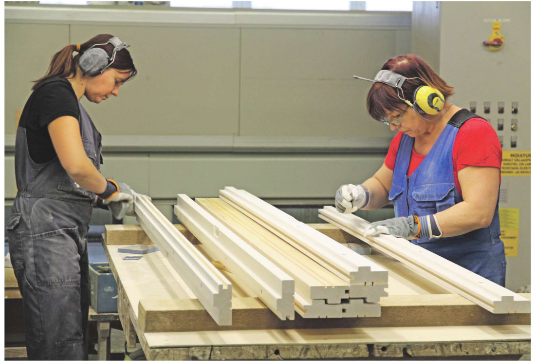
Kuigi uksetehas kasutab Haapsalu nime, paiknevad tööstushooned Uuemõisas.