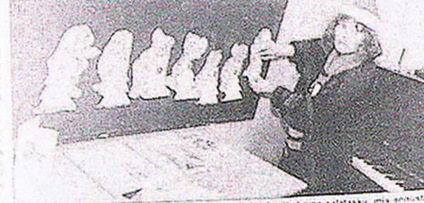
Sõbra Rahumägi lastekoolis tähtselt on seisa päkapikute, igapäev oma saatust, mis annabki, mis tunneb teha.