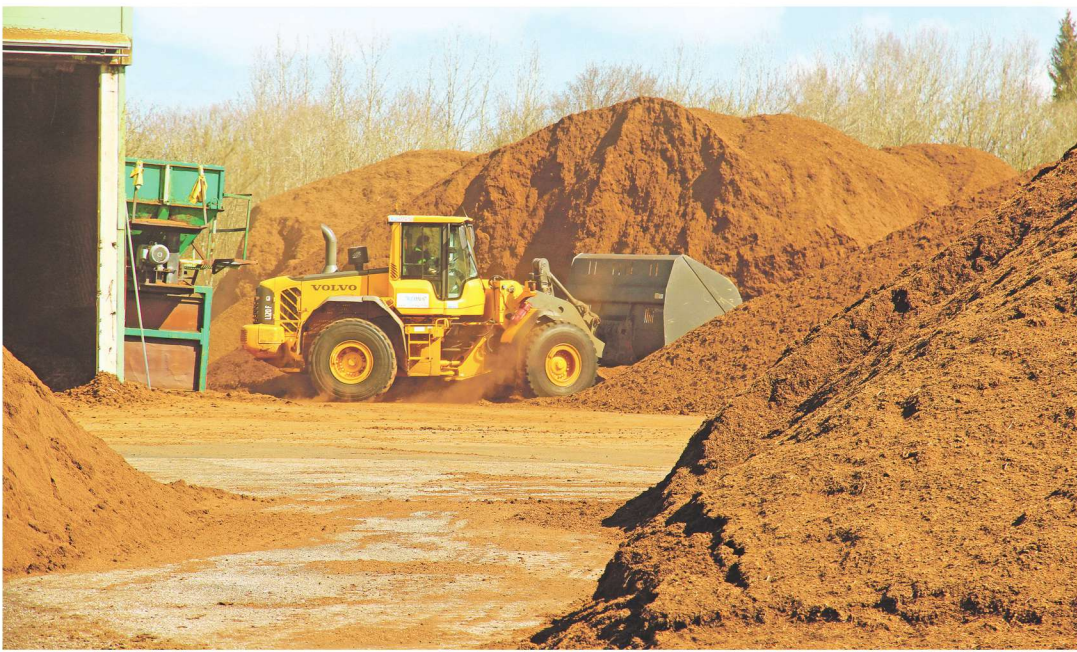
Kekkilä turbatehase eesmärk on suurendada kasvuturba tootmist 200 000 tonni jagu aastas.