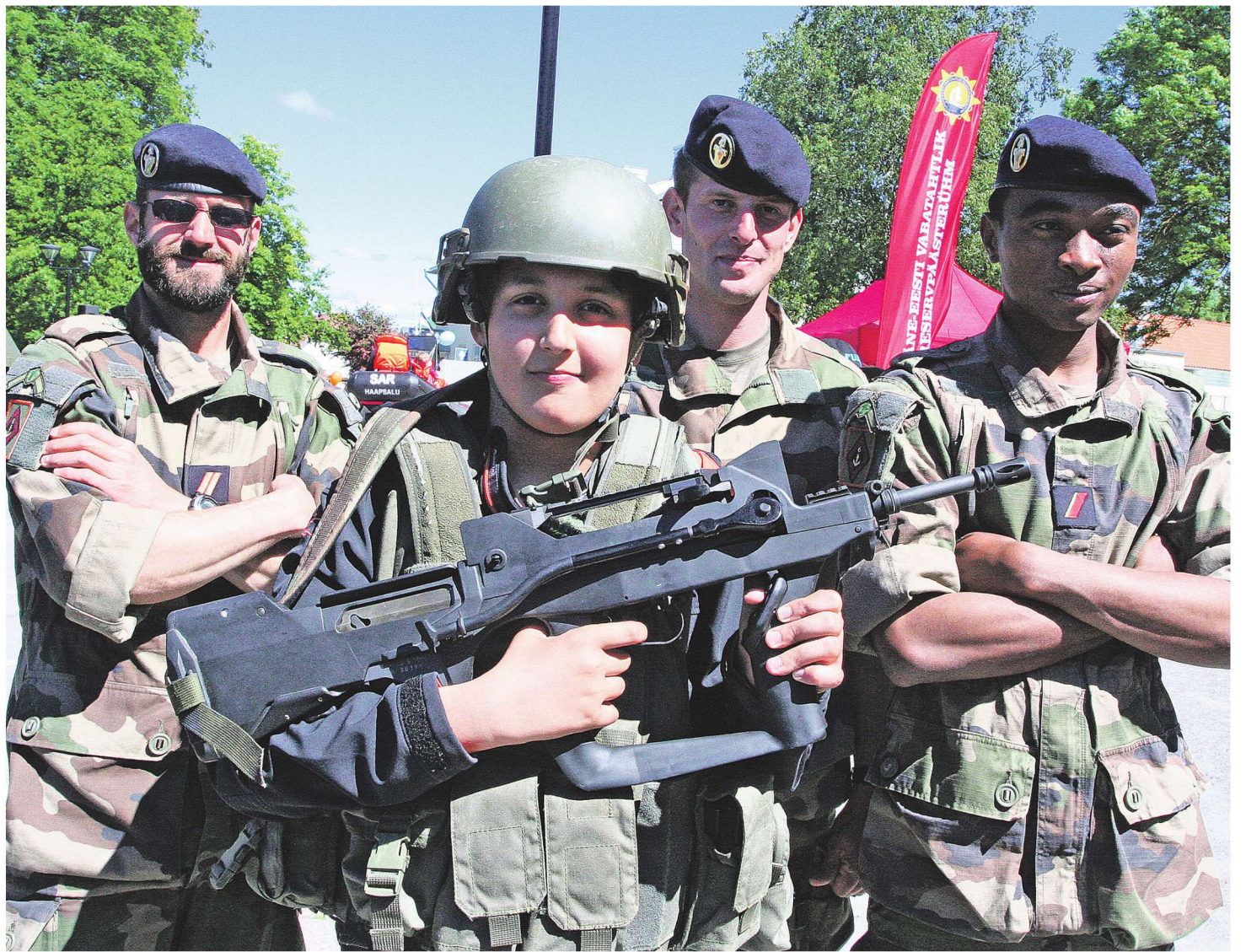
NATO liitlaste soomustatud sõidukid ja sõjavarustus pakkus rahvale suurt huvi.

Päeva kulminatsioon saabus kl 16, mil rivistusid vabadussõjas