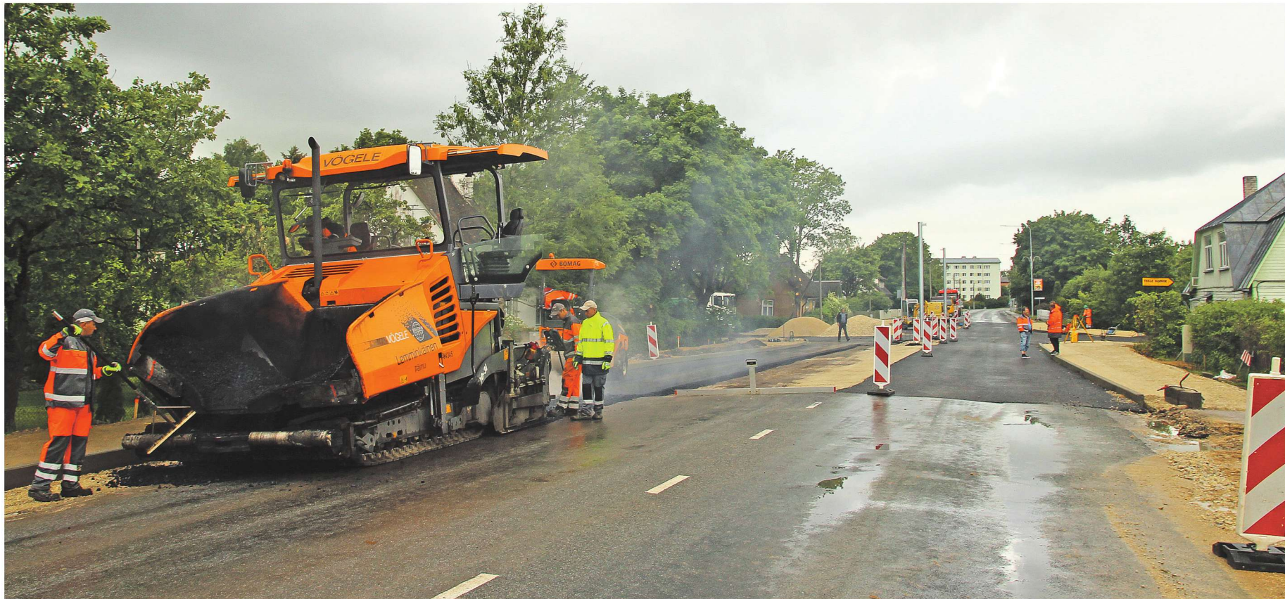
Eile paigaldati Tamme ristmikul alumist asfaldikihti, pealmise kihi peaks ristmik saama lähapäevil.