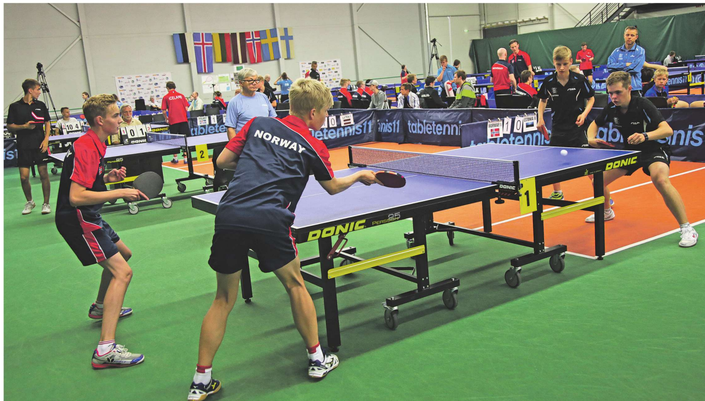
Juunioride ja kadettide vanuseklassis pole Läänemaad seekordsetel võistlustel esindamas mitte kedagi, meie noored saavad seekord vaid teistele kaasa elada ja mängu jälgida.