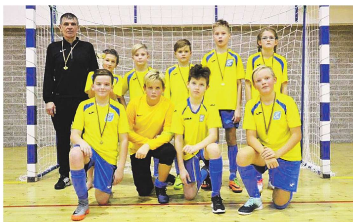
Läänemaa JK U12 võistkond sai Pärnu-Jaagupi Cupil teise koha.

Tänavu võistles U12 vanuseklassis kümme võistkonda, kes selgitasid turniirisüsteemis mängides omavahelise paremusjärjestuse. A-alagrupi esimene mäng viis Läänemaa kokku tugeva Pärnu JK I võistkonnaga. Pärnu jalgpalliklubi on kaalukas vastane mis tahes suurklubile. U12 vanuseklassis tulid nad eelmisel hooajal Eesti noorte meistrivõistlustel Lääne regioonis esimeseks. Selgi korral õnnestus neil oma