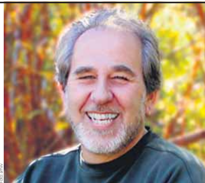
Dr Liptonit peetakse uue bioloogia üheks juhtisikuks. Oma tööd on ta kogunud teosesse "The Biology of Belief" ("Usu bioloogia").

Seminar on eestikeelsete subtiitritega. Osavõtuks saab registreeruda kodulehel www.lectoorium.ee . LL