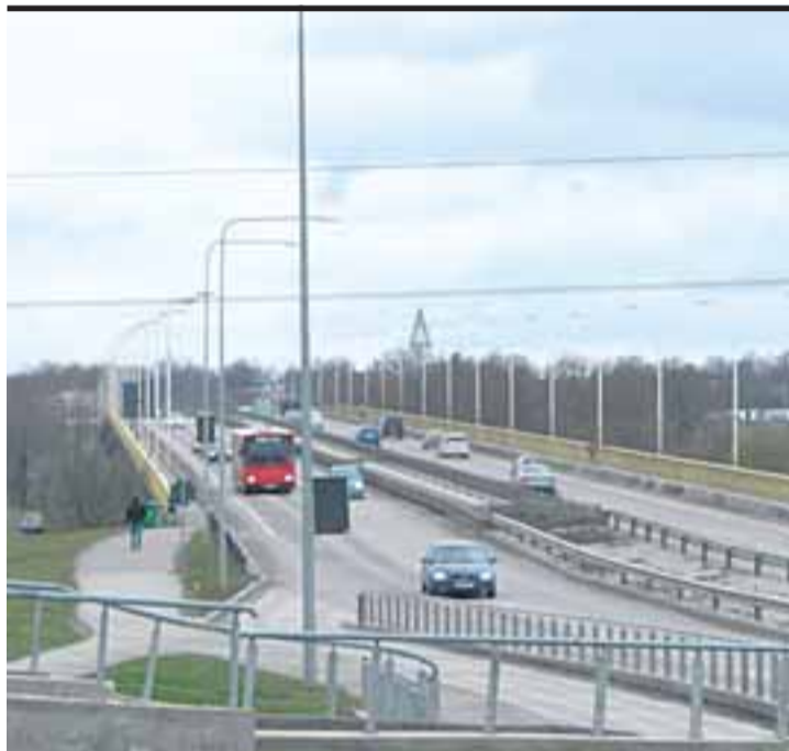
Hetkel veel on Sõpruse sillal kõik sõidurajad avatud.