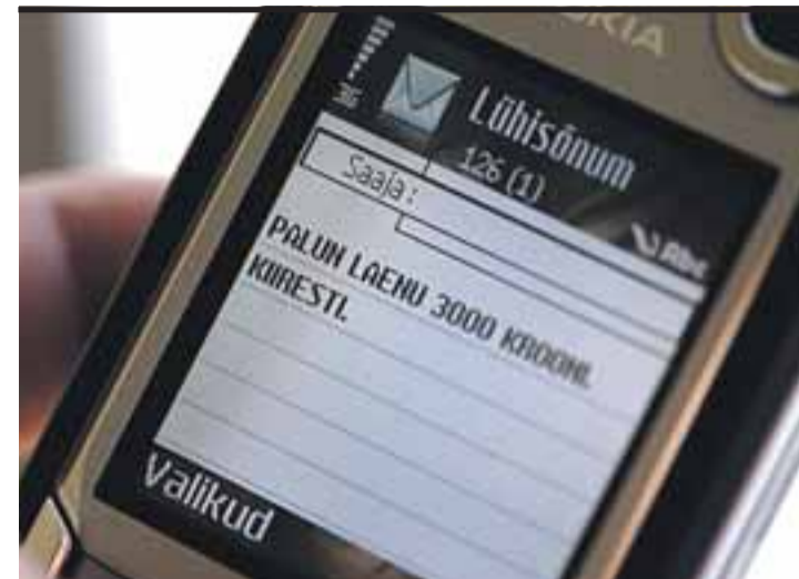
Mida rohkem on inimesel laene, seda sagedamini tekib tal nende tagasimaksmisega probleeme.