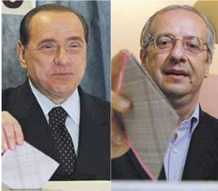
Nii Silvio Berlusconi kui ka tema paarivaal Rooma linnapea Walter Veltroni lubasid valimiste järel sama – vähendada makse ja tuua riik majanduskriisist välja.