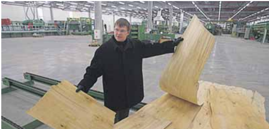
Kohila vineerivabrik on praeguseks "puhkusele" saatnud juba mõned liinitöölised, mehhaanikud ja insenerid. Sundpuhkus ootab ees 64 vineerivabriku töölisi.

Tööturuametile esitas taotluse 158 inimese koondamiseks ka Pärnu Linavabrik, kirjutas Pärnu Postimees. Ameti teatel tahab ettevõtte inimesi koondada 15. maist 13. juunini. Töö kaotavad eel- ja