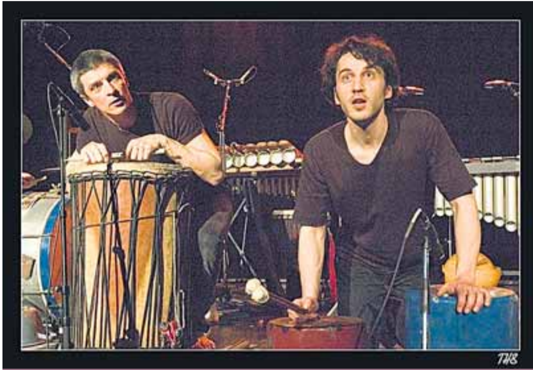
Prantslaste ansambel TH8 pillerkaaritab löökpillidega.

muusika keskuses kell 19 Tanel Ruben kvintett,