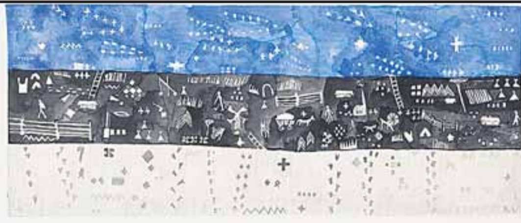
Eesti Rahva Muuseumi saabuva juubeli puhul korraldatud võistluse võitnud vaibakavand.

miljonit krooni. Projekti käigus võetakse kasutusse Lutsu 2 asuv hoone Tartu mänguasjumuuseumi teatrimajana. Teatrimajas hakatakse korraldama regulaarseid nukuteatri- ja lasteetendusi. LL