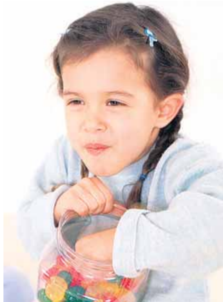
Enne kui lapsele midagi magusat osta, tuleks uurida, ega see ei sisalda lastele ohtlikke toiduvärve.

Tartus tehakse uuringut edasi ning ohtlike toiduvärvi- dega toiduainete loetelu koos- tamine jätkub. Huvilised saa- vad uuringust lugeda veebi- lehel www.tartutarbija.ee/ aktuaalne.html . LL