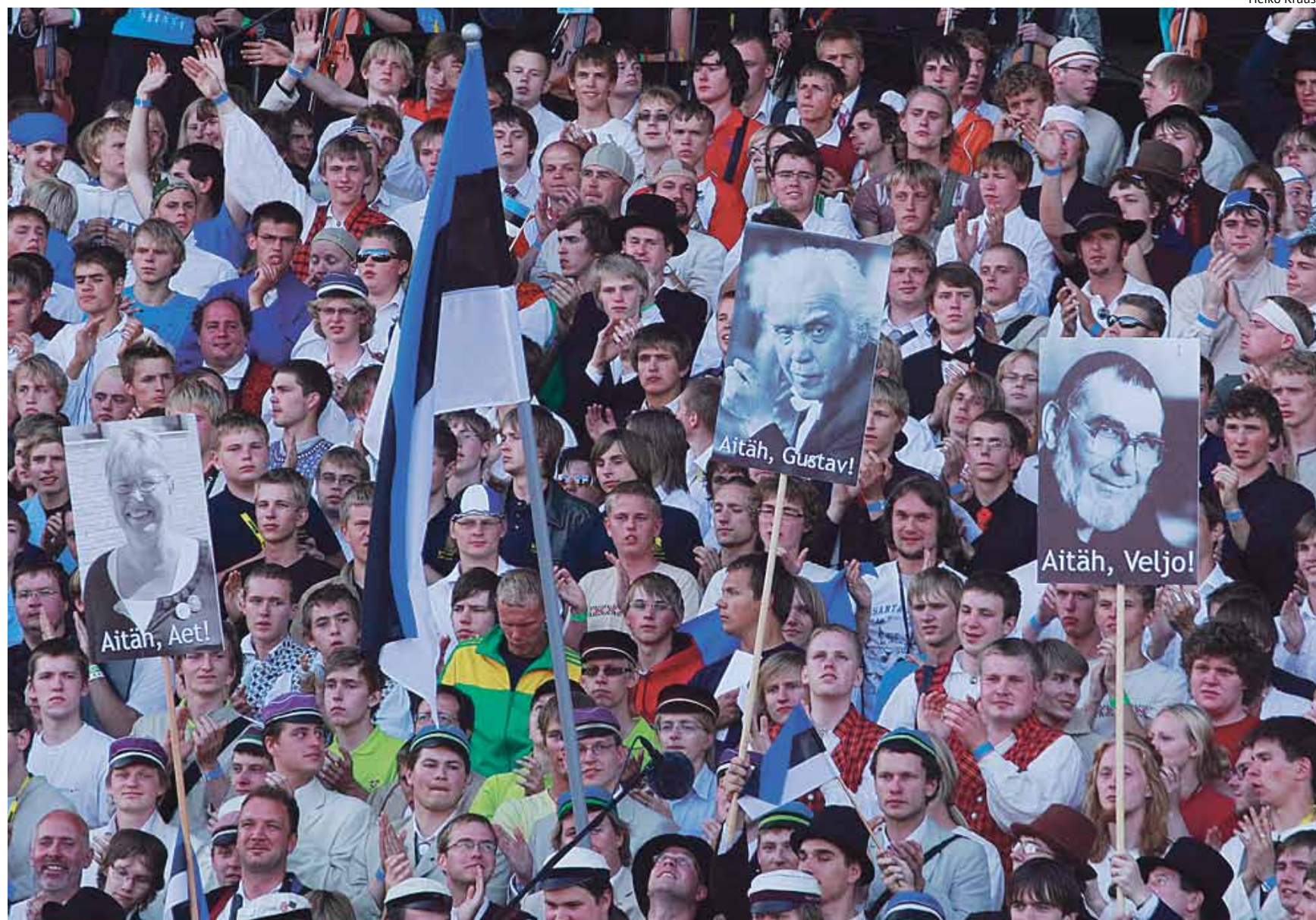
Tartu elab selle nädala lõpuni laulupeo lainel, sest käivad suurejoonelised Põhja- ja Baltimaade meestelaulu päevad.

Tartus toimuvaid meestelaulu päevi võib nimetada maailma suurima osavõtjate arvu-ga meestelaulu päevadeks. Ves-