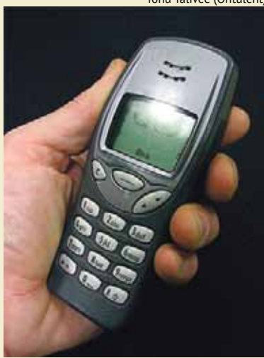
Tõnu Talivee (Ohtuleht)

Soome uhkus ja majanduse lipulaev, mobiiltelefonide tootja Nokia teatas 10 000 töökoha koondamisest, neist 3700 kodumaal. Tegemist on suurima koondamisega põhjanaabri ajaloos. Asja arutamiseks kogunes Soome valitsus hädaistungile. Taskutelefonide väljatootamise ja tootmisega kuulsaks saanud ettevõtte teatas ka, et loobub kõigist valdkondadest, mis ei ole põhitgevusega seotud, ning sulgeb tehased Saksamaal ja Kanadas, et hoida kokku 1,6 miljardit eurot.