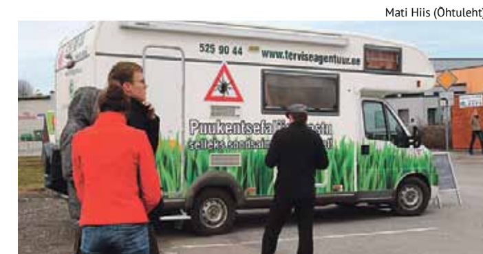
Puuksentsefaliiti haigestumist saab vältida vaktsineerimisega, meenutavad kaks mööda Eestit ringi tiirutavat nn puugibussi.