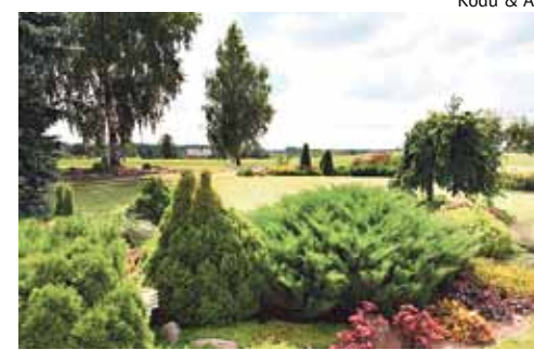
Kodu & Aed

Siinsetes aedades leidub vähem kadakate ja jugapuude bonsaisid, kuid ka neid tuleks samamoodi hooldada. Kui praegu veel aias bonsaid ei ole, kuid seal kasvab mõni liik, kellest võiks bonsai vormida, siis nüüd on õige aeg sellega alustada. Ilusa bonsai kujundamiseks kulub aastaid. Selleks, et vormida aia soolopuud, tasub käiku lasta kogu oma fantaasia. Kui teadmistest puudu tuleb, on mõttekas spetsialist appi kutsuda.