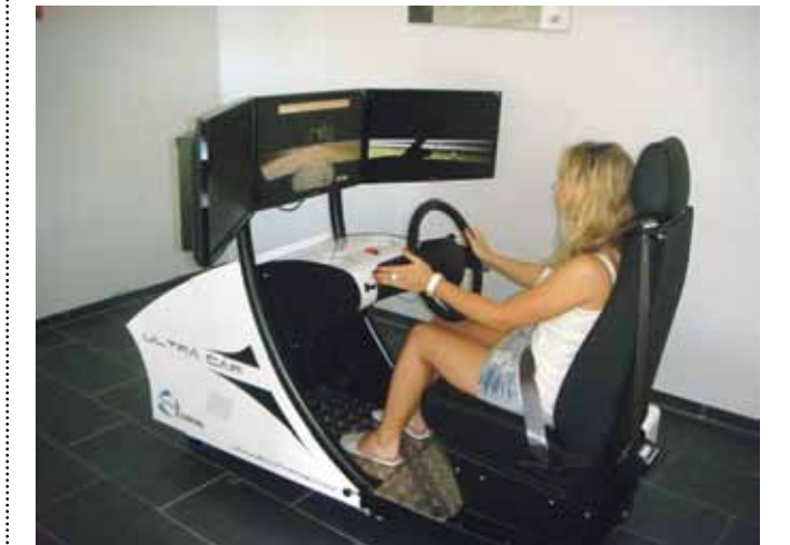
Turniiri ühe soosiku Hispaania fänn.

Selge autokool asub Tartus Soola 1A, tel 734 4330, 521 4596, meiliaadress selge@selge.ee, koduleht www.selge.ee.