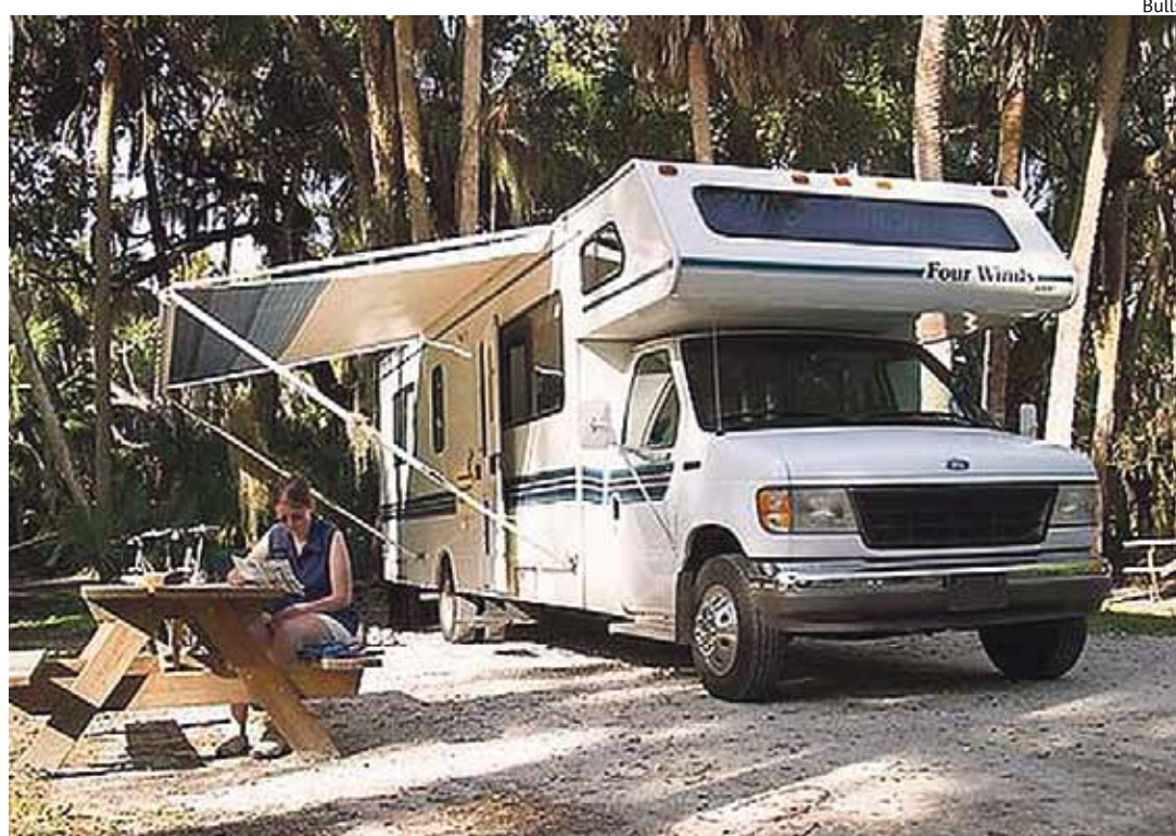
Matkaautoga võib mööda Euroopat ringi tiirutada, aga ka lihtsalt sõprade juurde grillima sõita. Nii ei teki kunagi muret sellega, kes öömajale mahub või kelle kanda jääb kaaine autojuhi roll.

Autoelamuga Euroopas reid-sides peab arvestama sellega-