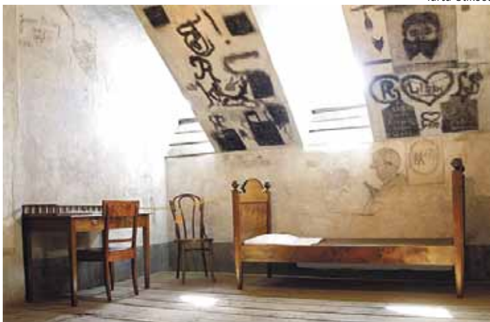
Originaalmaalungute paremaks kaitsmiseks muudeti ka kartseri ekspositsiooni.