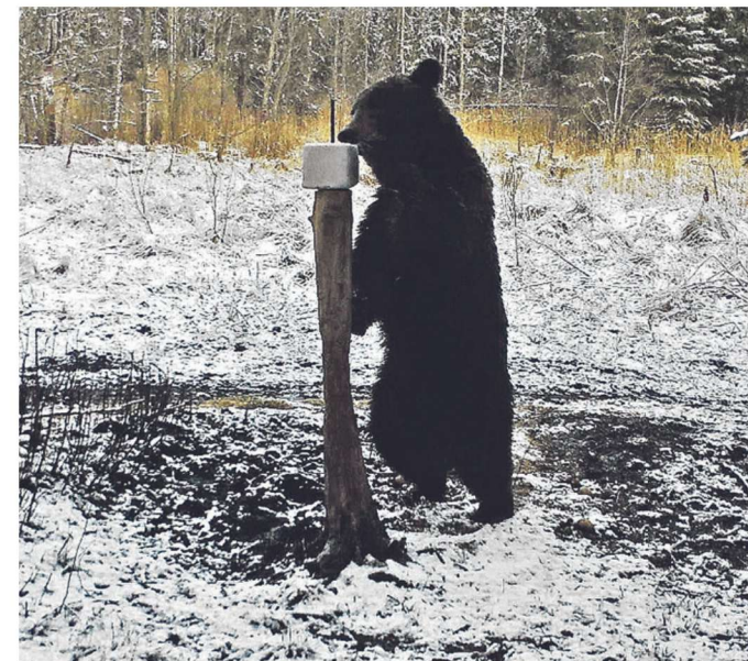
Karu Võrumaal soola mekkimas.

Kui karu ikkagi rünnab, tuleb pikali heita, kätega pead ja kaela kaitsta ning teeselda surnut. Jooksma ei ole mõtet hakata. Mõmmik on igal juhul kiirem.