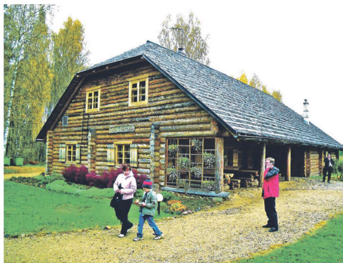
Taas saab külastada ka muuseumid.

10. maist on eritingimusi järgides lubatud avalike jumalateenistuste ja teiste avalike usuliste talituste läbiviimine. Tagatud peab olema 2 + 2 reegli järgimine ja desinfitseerimisvahendite olemasolu. LEPM