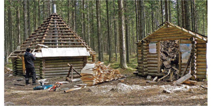
Rebasmäe onn RMK Räpina-Väraska puhkealal sai uue katuse. RMK

Täiendavatele töödele lisanduvad 2020. aastaks juba varem kavandatud tööd 1,7 miljoni euro ulatuses. LEPM