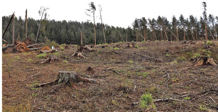
Lagedaks raiutud Rosma linnamägi

Linnuseõu oli omal ajal väga suur – üle 4000 ruutmeetri. Vanimad leiud – tekstiilkeramikakillud – on üle 1500 aasta vanad. Linnusevall on rajatud hiljem. «Arvan, et 1223. aasta ülestõusu ajal on vana linnust hakatud uuesti üles ehitama,» pakkus Valk. «Looduslikult nõrgemini kaits-