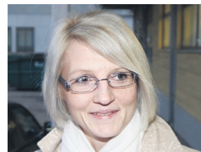
Kaili, ametnik: See on kirjanduse kohta kole sõna. Minu jaoks ei eksisteeri sellist mõistet. Iga raamatu jaoks on oma lugejaskond.