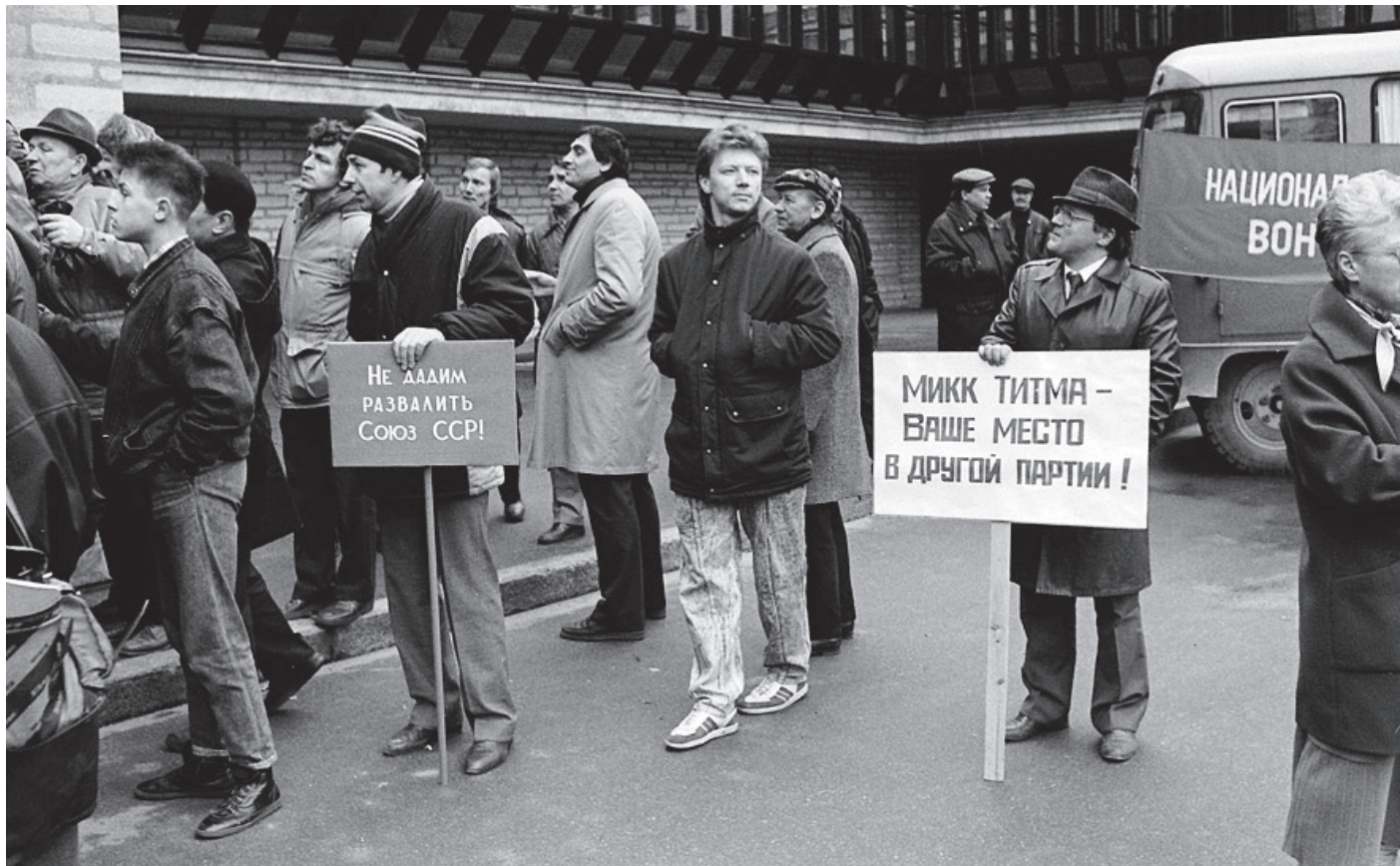
Venemeelsed kogunevad järjekordsele miitingule. Üks loosung kuulub: "Me ei lase Nõukogude Liitu lammutada!". Selles lühikeses lauses oli sõnum ja ka selge ähvardus neile, kes olid teist meelt.