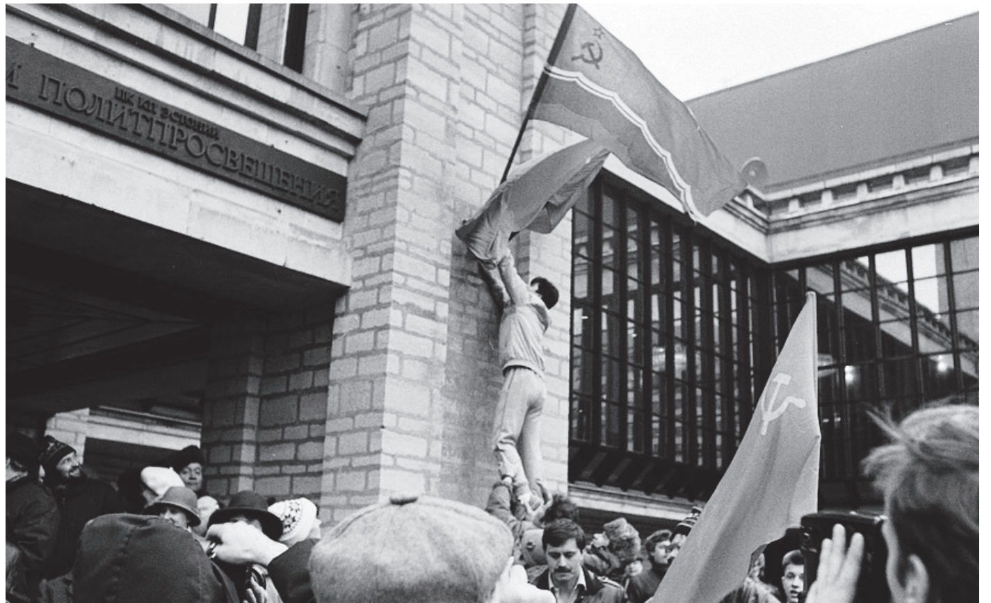
See foto iseloomustab hästi 90ndate aastate alguse meeleolusid Tallinnas. Interrindel on käsil järjekordne "lippude vahetamise aktsioon".