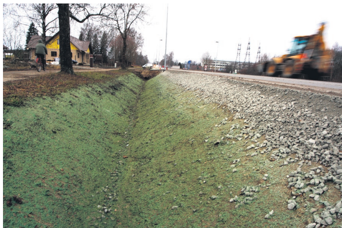
Miinusena toob sõiduõpetaja välja tee äärde kaevatud sügavad kraavid.