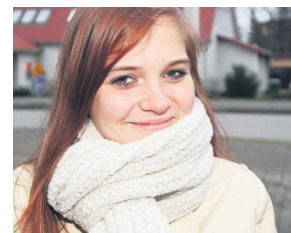
Aive, õpilane: Vanad ajaloooraamatud on need, mida ma üldse ei loeks.