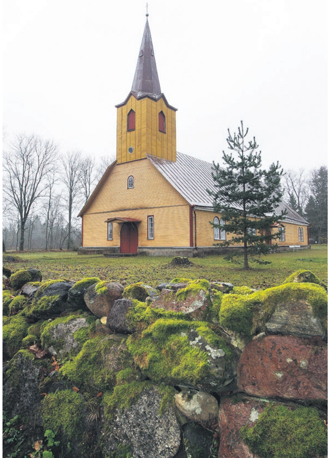
Vana Järvakandi (juurutatava uue nimega Kehtna) Peetri kirik ja kalmistu kiviaed.