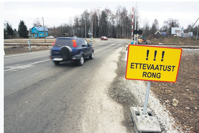
Uus raudteeülesõit Rapla jaama juures.