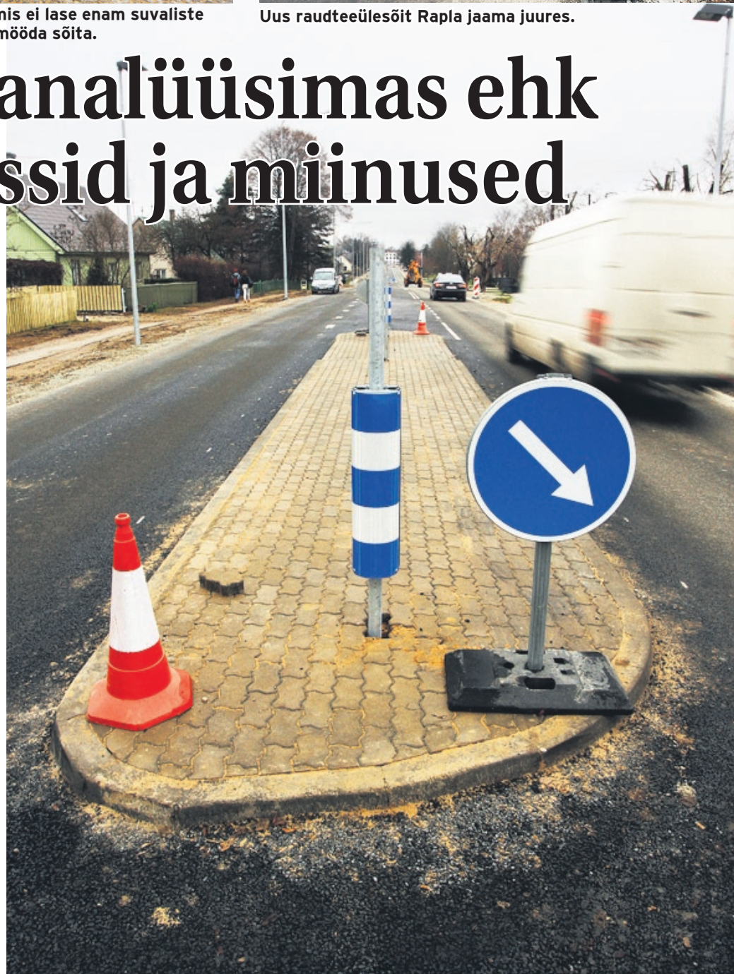
On kohti, kus ohutussaared end igati õigustavad.

Tervikuna võib aga nii tee kui ka liikluskorraldusega rahule jääda, sest plussid kaaluvad kõik miinused üles. „Kui haljastus ja kõik kõnniteed valmis on, siis on see tee siin väga ilus ja häbi ei ole vaja tunda,“ leidis teed analüüsinud sõiduõpetaja.