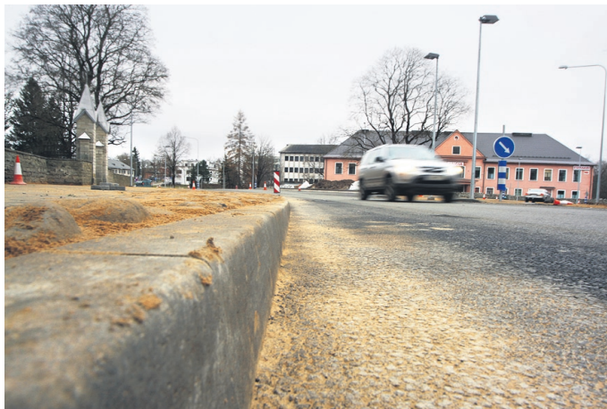
Kiirusõnu jagus äärekividele, mis ei lase enam suvaliste kohtade pealt ära keerata või mööda sõita.