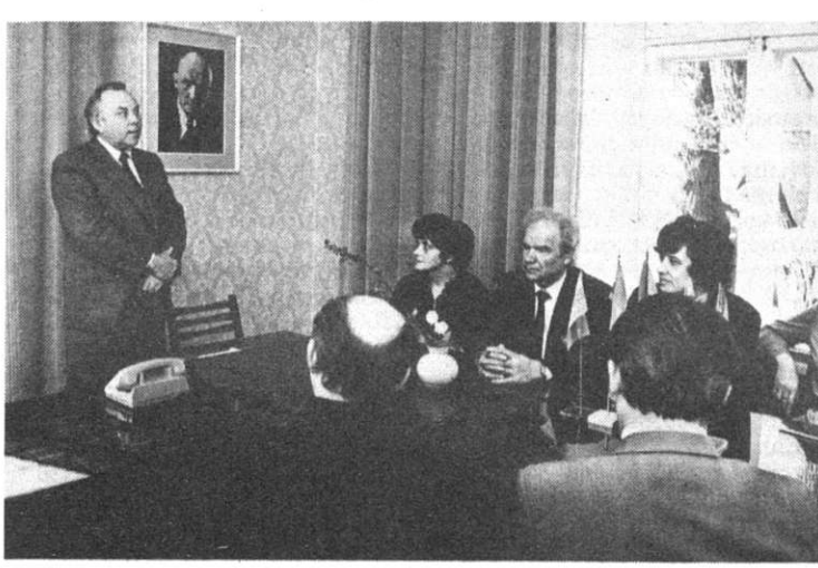
Küllalised Lätid, Leedust ja Moldaaviast VOT-is.

neldada siis, kui täiendusüsteem liitub meetodilise tööga ühtsese süsteemiks ja teostub õpetaja eneseharimises. Seda ideed toetas Leedu psühholoogikateedri juhataja A. Grigoni uurimus, mille kohaselt 45% õpetajatest saab kõige suuremas mahus nii pedagoogika- kui psühholoogiateadmistest ja -oskustest enesetäiendamise teel ning 29% õpetajatest kooli ainekomisjoni. Seega on õpetajate kvalifikatsiooni tõstmise süsteemis keskne õpetajate enesetäiendamise ja kooli ainekomisjoni töö korraldamine ning juhindamine. Vahetati kogemusi teadustöö meetodika, täienduskursuste diferentseerimise jom. üle. Õpetajate täienduskoostööte saad ühised probleemid ühtse lahendusena ja uurimused selles valdkonnas annavad alust loota, et on võimalik mõni teadustöö praktikasse viia. Toetudes senistele eksperimentaal kogemustele teokselt selgub, et õpetaja enesehariva tegevuse resultatiivsus nimel on vaja tõhusat abid just õpetajate enesetäiendamise: kujundada õpetajate vajadus ja võimalused enesetäiendamiseks, keskendada neid oma pedagoogil-