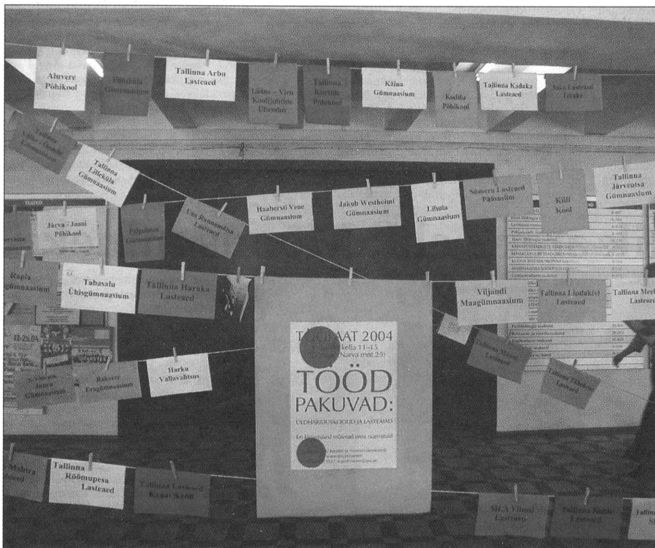
Jürikuul õied: koolid otsisid TPÜ töölaadal õpetajaid. Aga vanaaegsest kaadrivahetuse päevast – jüripäevast – on järel vaid mälestused nagu ka karjapoisiajast.

Silma hakkab, et Tallinnast ei taheta ära tulla. Tallinna koole oli töölaadal