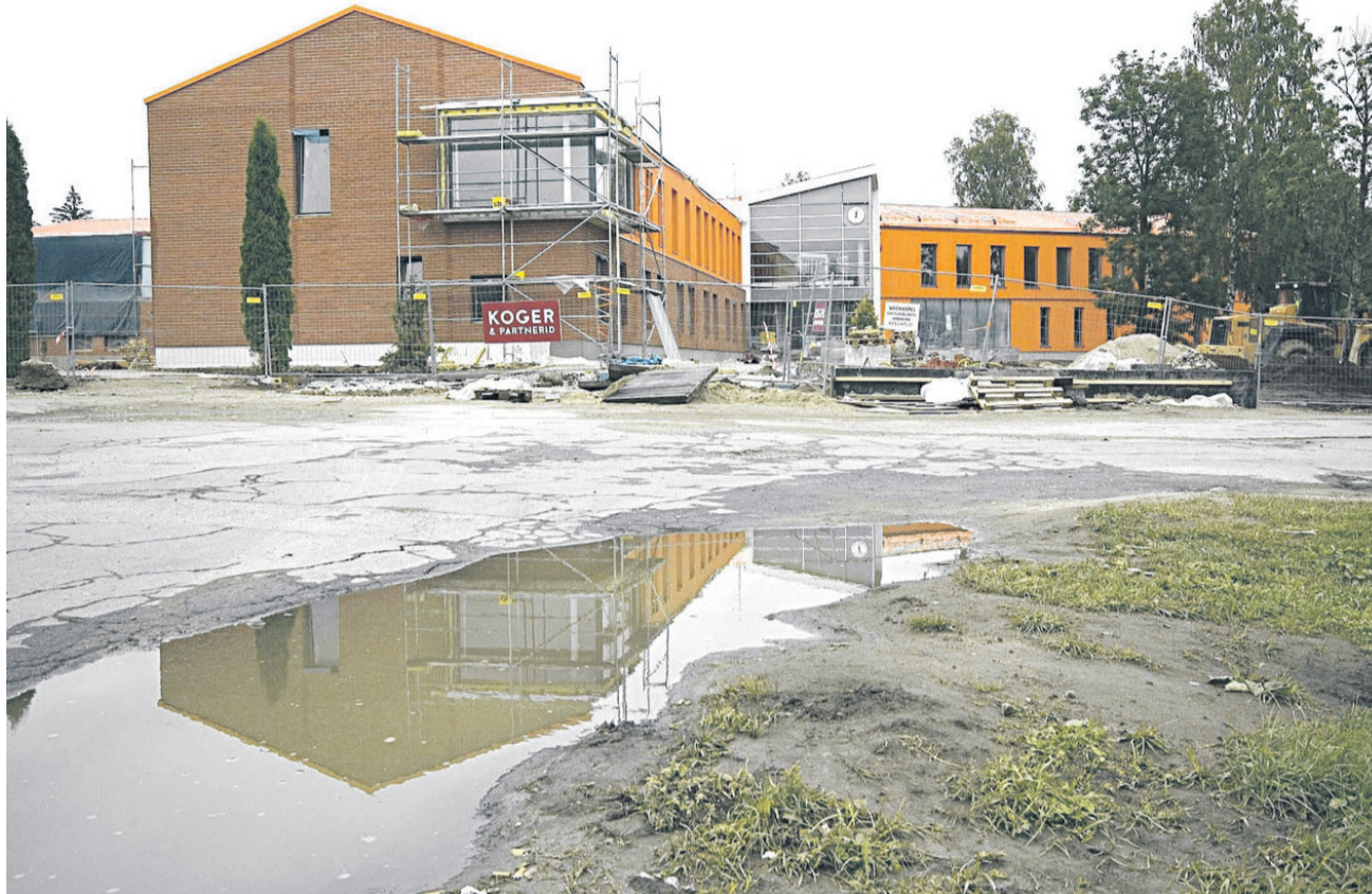
Kurtna uus koolimaja on senisest ligi kolm korda suurem. Eriliseks teeb selle aga 67 m 2 päikesepatareisid.

Viljandis tuleb uueks õppeaastaks nõelasilmast C. R. Jakobsoni nimelise gümnaasiumi remonditud hoone. Linna haridus- ja kultuuriameti juha-