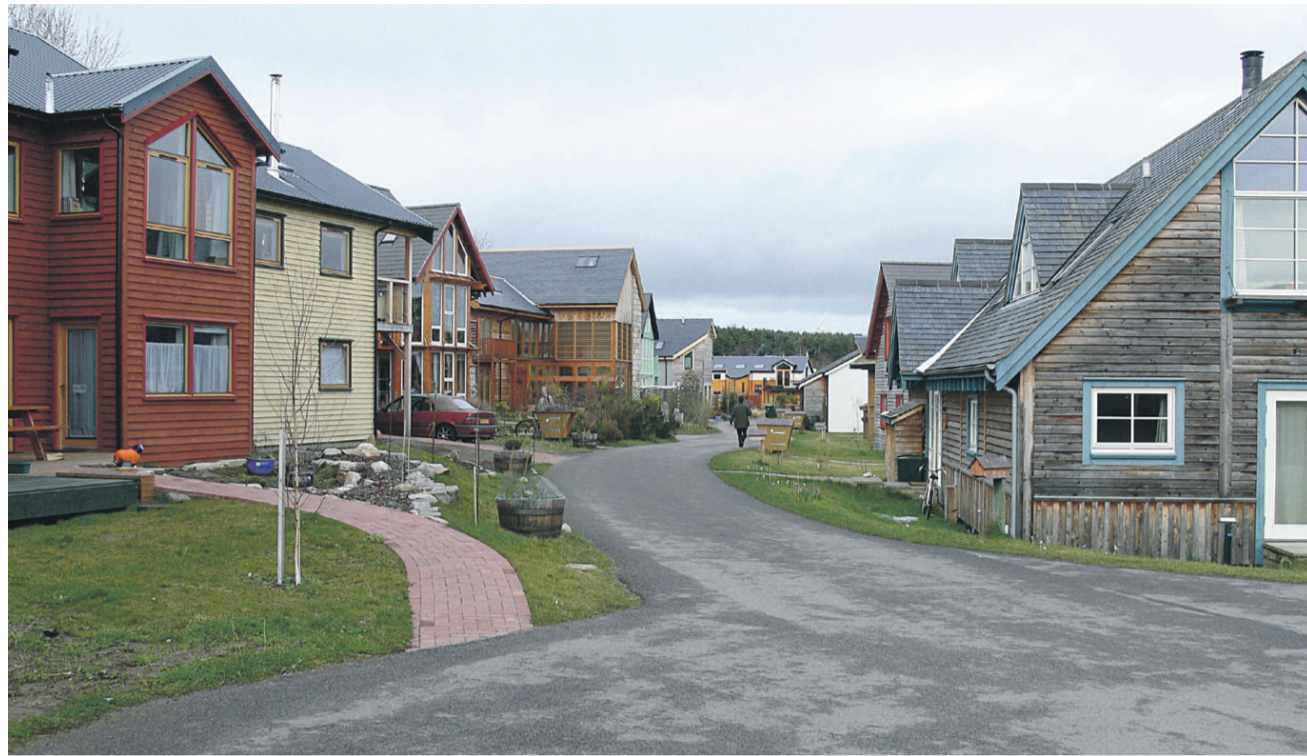
Neli aastakümnet tagasi Šotimaal Findhornis loodud ökokülas elab 500 inimest.

Kogukondades väärtustatakse eri andeid ning püütakse eri oskuste, eri isiksuste ühiselt leida neile sobiv roll ja tegevus. Kogukonnasiseid suhteid