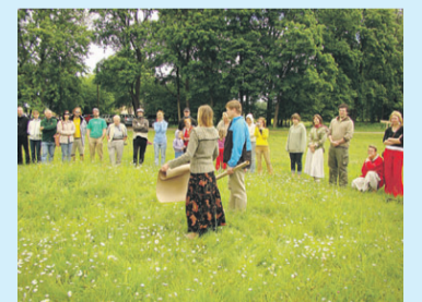
Eesti ökokogukonnad on juba kaks korda koos käinud, tänava tuli Esna mõisas kokku inimesi eri erialadelt üle riigi.

Kõrvaloleva artikli esimeses osas kirjeldatud neli aspekti esindavad uut ja arenevat maailmavaadet. Meie koolides on kindlasti üksikuid või sellest juba rakendatud, kuid tervikliku ja läbiva käsitlemiseni ning, mis veelgi tähtsam, selle maailmavaate järgi õppetöö korraldamiseni on veel pikk tee minna. Meie, kes me oleme seda ökokogukondade maailma pisut nuusutanud ning rohkem või vähem seal ka elanud, oleme koolidele ja õpetajatele nõu ja jõuga abiks kui neil on huvi neid mõtteid edasi anda.