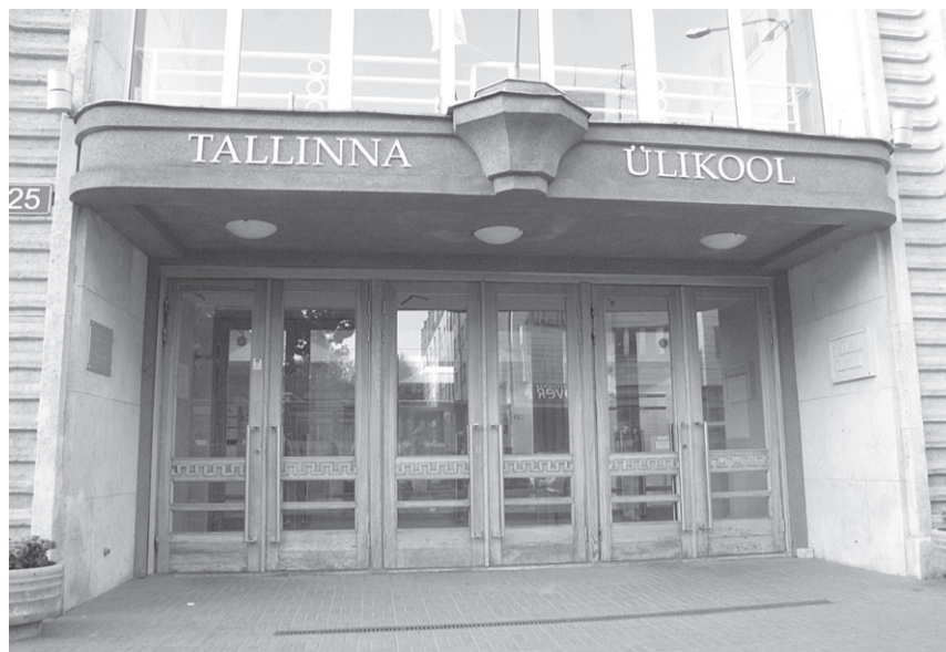
Tallinna ülikooli riigiteaduste bakalaureuseõppesse esitati rekordarv avaldusi – 793.

Magistriõppesse kandideerijate hulgas olid kõige populaarsemad erialad organisatsioonikäitumine (137),