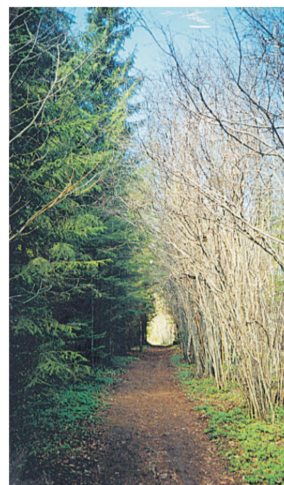
„Muusika sünnib valgusest“ – vrd Arvo Pärt: „Muusika sünnib vaikusest“. „Kukalt sügav helihark“.