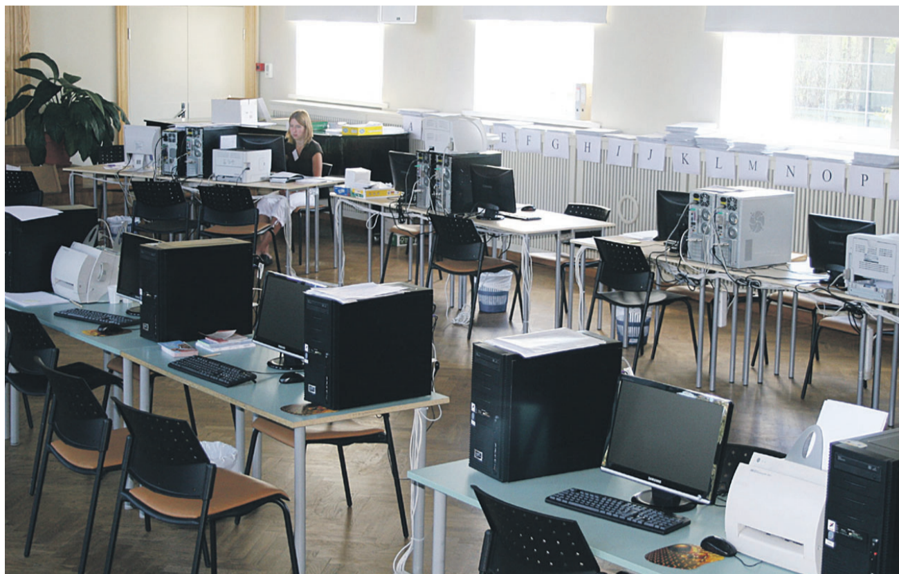
Tallinna ülikooli aulas oodatakse tulevasi üliõpilasi oma sisseastumissoovi kinnitama. Enamik neist teeb seda siiski Interneti teel.