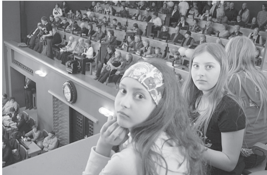
Riigikogu lahtiste uste päev tänavu 23. aprillil. Uuringud näitavad, et õpilaste usk oma suutlikkusse ühiskonnas kaasa rääkida on aina kahanenud.

Kõige vähem usku oma tegutsemise edukusse on tänasel 8. klassil. Nende näitaja jääb alla ka 1999. a sama eagrupi omale. Tõsi, tänased üheksandikud on küll noorematest