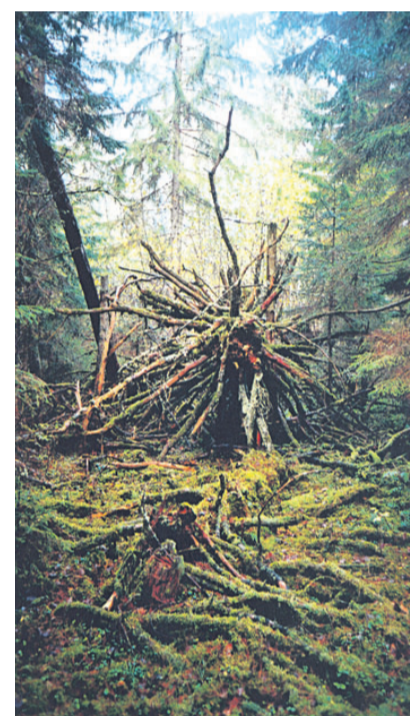
„Muinasjutu lävel“. „Haljendav Kalevipoja mõök“.

Omaette põneva osa metsast moodustavad Kalevipoja ajastuga seostu-