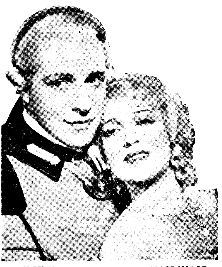
EDDY NELSON ja JEANETTE MACDONALD.