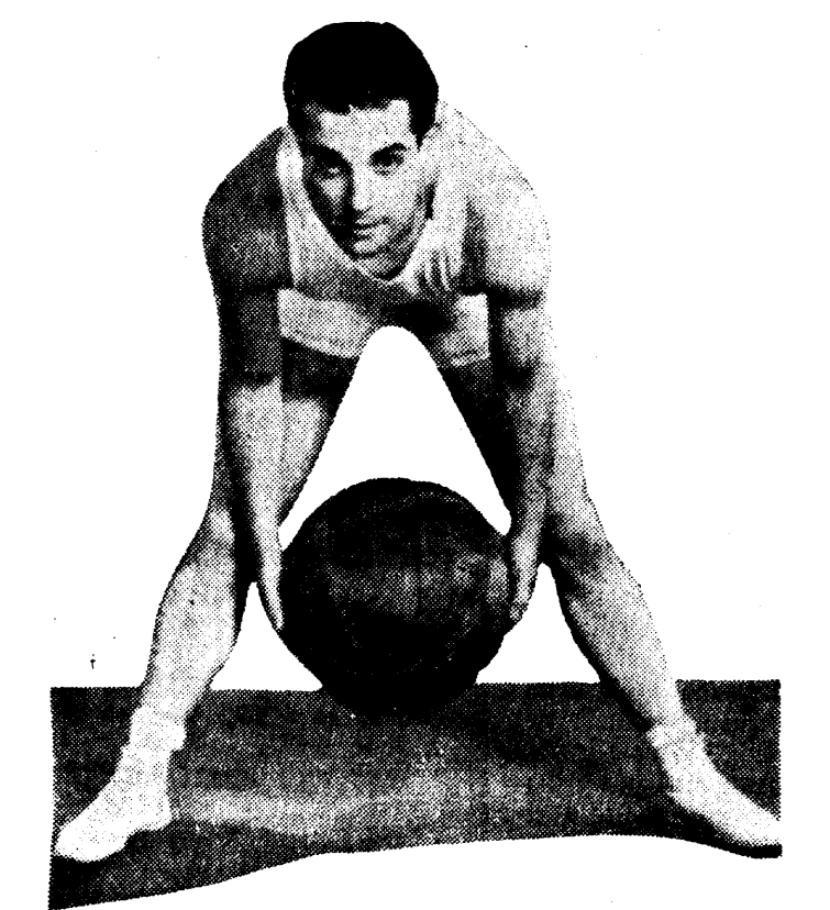
RAMON NOVARRO, keda hiljuti arvati saavuvat lennukit Tallinna.

PARIISI kinoajakirja „Cinemonde“ avaldab järgmise juhtumi tõestelust, mis kirjeldab mõningate režissööride iseteadlikkust, mille all Prantsuse filmitööstus tulevat kannatada. Rambouillet's, Versailles'i lähedal, tehni filmiülevõtteid. Režissöör, kes kannab naiterühma, nagu oleks ta olnud vähemalt Napoleon, märkas korraga näitleja valgetes purjeriided kingades. „Hirmus!“ hüüdis ta. „Kohes ajage jalga kollased kingad!“ Rambouillet on väike linnake. Ele-gantseid kollaseid kingi polnud seal saada. Sellest teatas rekvisiidi juht väriseval häälel režissööri-le. „Andke talle auto“, järgnes otsus. „Las ta sõidab Pariisi ja tuleb tagasi kollaste kingadega!“ Onnetu näitleja kihutas Pariisi. Kogu näiterühm ootas teda poolteist tundi (filmistöötud läheb keskmiselt maksma 30.000 franki). Viimaks näitleja jõudis tagasi kollaste kingadega ja ülevõtted võisid alata uuesti. Režissöör hakkas näitlejale seletama, mis tal tuleb teha. Ta pidi minema vagonisse ja akna all seisest lehitama taskurätti, kuni rong väljunud. Näitleja küsis aralt: „Aga kingad?“ „Millest kingad?“ „Mu kingi pole ju näha. Milleks ma sõitain Pariisi?“ „Pole teie asi!“ süüvas režissöör. „Tehke, mis teil käitakse!“