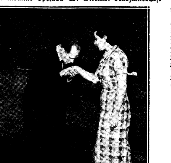
demonftrereib kawaleerififku käfjufidufit.

lektor käfi kokku lüles annab määrat lõpetamif. Tütarlaps wab lektorifit kiita: — Teie leidub fõiemifit rütmif, ütleb lektor. Muflegi näib, et juft fõit tütarlappel wõib olla eedufif näiteks faamifeks.