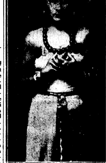
Nimiosa ooper „Aidas“.