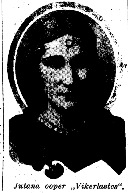
Jutana ooper „Vikerlastes“.

lava taga suime kokku, noomis ta mind itaalia keeles ning ütles ähvardavalt: „Tulge veel Itaaliasse või Hispaaniasse. Küll ma teen selle tasa.“ Hiljem aga leppisime ära, kui ta