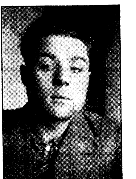
Nesnamow noormehe pilt

Wõõrsil ei ole jõealuse, kes on kokkuhooldikuse tippaolukorras. — Kinniswaraomanikud wõõrsil. — Spekulatsioonid maaga ja wõõrsil. — Wõõrsil rahaga laenu lahti jaabi. — Majanduskriisi häid tulemusi wäliseestlaste kapitali- ja wõõrsil