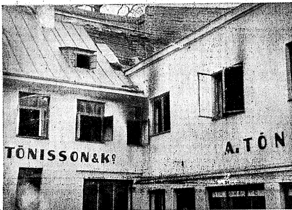
PÄRAST TULEKAHJU: osa hoone katust on hävinud, akendest on tunginud välja leegid.

Eile hommikul kella ¼ ajal süttis põlema Tallinna südalinnas, Rüütli tänaval nr. 28/30 Aleksander Tõnisson ja Ko-le kuuluv kahekoradne kivist büroo- ning ärihoone. Tules hävisid teisel korral asetsevad bürooruumid osaliselt ühes sisseaadega ja mitmesuguste dokumentidega. Tuli tungis ka laoruumidesse, sünnitamata seal aga suuremat kahju. Kustutusõudel kasutatud vesi, valgudes hoone alumisele korrale, rikkus osaliselt ladus olevaid puumaterjale. Kahjusumma suuruse kohta puudub esialgu ülevaade. Hoone oli kindlustatud 45.000 krooni eest k.-s. „Eeks-Majas“. Kogu sisseaadega, samuti laos olevad kaubad, olid tuleohu vastu kindlustamata. Tule tekkimise põhjused on seni täpselt selgitamata. Oletatakse põrandapoonimise ja teiste õliste ning tärpentiiniga immutatud lappide isesüttimist.