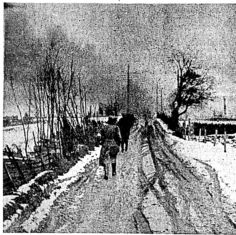
Sõda Norras. Lumine maastik, suits silmapilril ja Saksa sõdurid, nüüd arenevad Norras.

on sillas ja paljud tunnelid. 2.000 meest, kes moodustavad kahe rühma, asetsevad Narviki ümbruses, teatud rannikule. Nende positsioonid olid üpeval fõsiste pommitamise objektiks liitlaste maapatareide ja laevastiku suurte kahurite poolt.