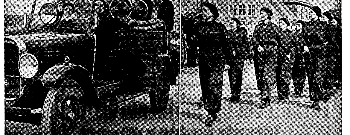
Nõmme naistuletõrjad oma mootorpritsiga ja paraadmarsil.