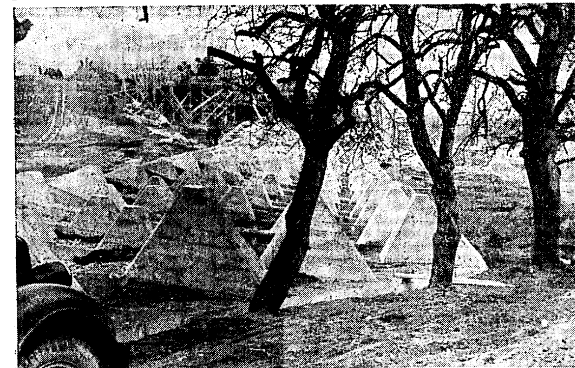
Läänevallil kindlustatakse. Meie plik kujutab vastvalminud tankitõkkeld Saksa läänevallil ees

tervishoiu alal. Narva haiglaküsimus kerkis vabariigi valitsuses päevakorrale juba mõni aasta tgaal. Algul oli kavatsus ehitada Narva täiesti uue haigla, millest aga loobuti. Kuna Virumaa põlevkiivitõustused tunduvad on laienunud, tekkis vajadus soetada suurem haigla, mis rahuldaks ka kaevandusrajooni. Nüüd on Narvas suurimad, avaramad ja õhurikamad haiglad Eestis. Minister märkis veel, et Rakvere ja Järvamaa haiglaküsimus tuleb lahendamisele veel eel- oleval sügisel. Ühtlasi tervitas kõneleja Narva linna vabariigi presidendit, peaministri ja valitsuse poolt. Oli saabunud rohkesti telegramme, teiste seas siseminister A. Jürimalt, linnade- liidult j. t. Lõppsõna ütles Narva linnapea, läkitades ühtlasi Narva linna ja koostööjate nimel tervitustelegram- mi vabariigi presidendile. Aktusele oli kogunenud inimesi 1000 ümber. Avatallituse lõppedes tutvus minister Narva hoole- kandse asutustega ja lahkus täna õhtuse rongiga.