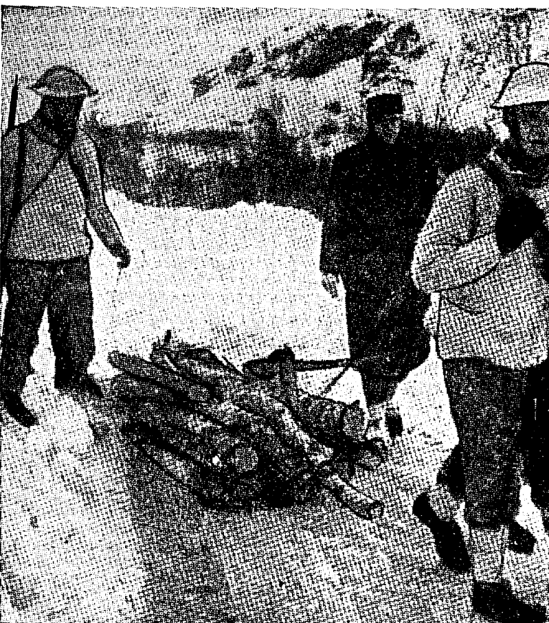
Maailma põhjapoolseimal sõjarindel. Inglise sõdurid võitlevad Narviki lähedal.

sõjalaev vajas 30 minuti jooksul põhja. Üks hävitaja sai tabamuse keskmisekallibrilise pommitamisega.