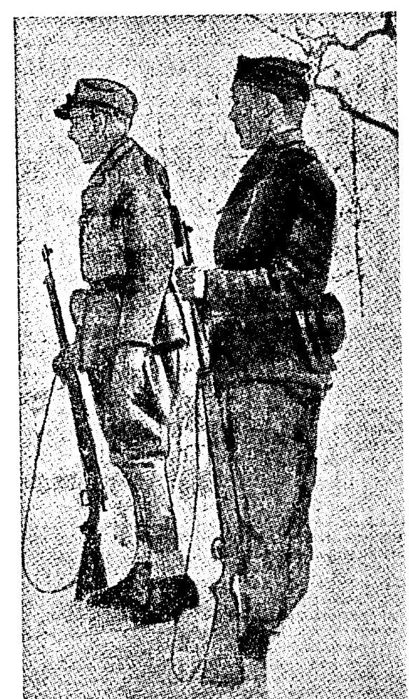
Norra sõdur ja vabatahtlik seisavad valveposiil „kuskil Norras“.

Oli vältimatu, et mõned materjalid hävitati. Näiteks lasti osa prantslaste varustust ja sõjamoona õhku varsti pärast nende maale toimetamist Namsoses. Üksainus õhubaas Kesk-Norras, kust liitlased oleksid võinud opereerida hävituslennukitega, oleks muutunud asjade seisukorda. Õhubaaside puudus oli kahtlemata liitlaste tagasitõmbumise põhjuseks. Lõuna-Norras võideldud liitlaste vägede arv oli tunduvalt väiksem kui seda üldiselt kujuteldi.