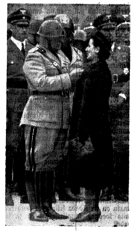
Musjolini annetas sõjas langenute lestedele medaleid. Roomas puhitseti Hispaania sõjas langenud wabatahtlike mälestuspuha. Sel puhul Musjolini annetas langenute lestedele medaleid.