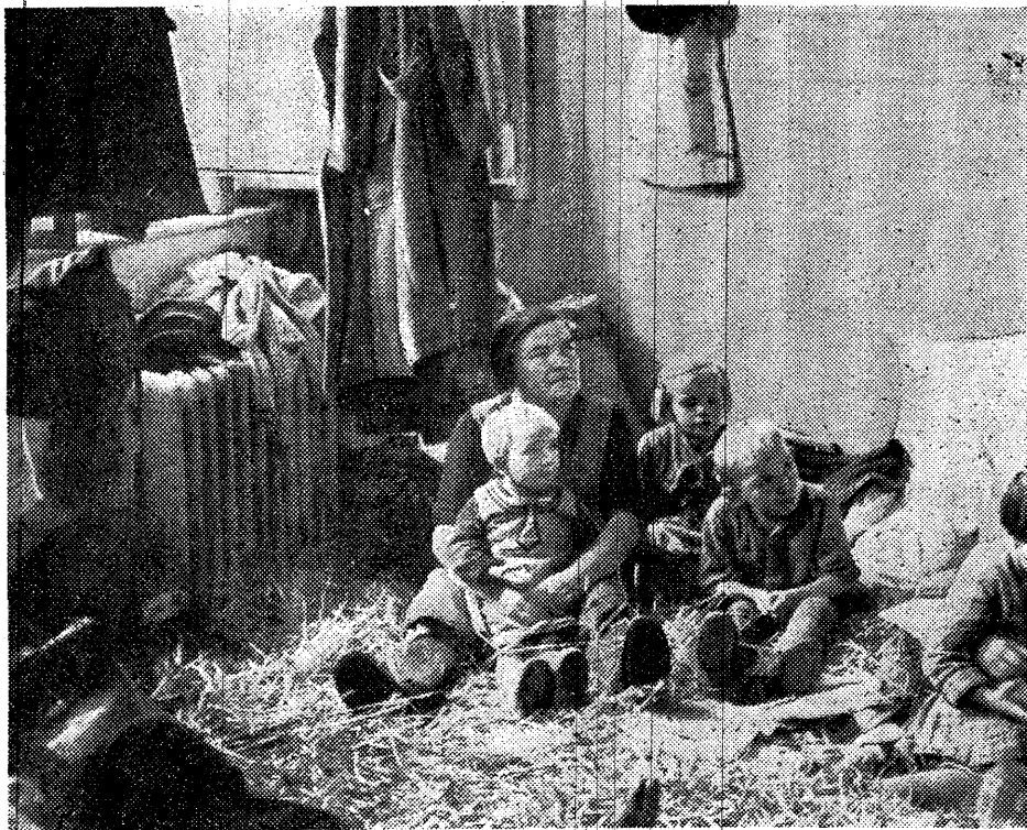
Bildil tšehhi naised ja lapsed, kes on põgenenud sakslastest okupeeritud piirkondadest Stetiti.