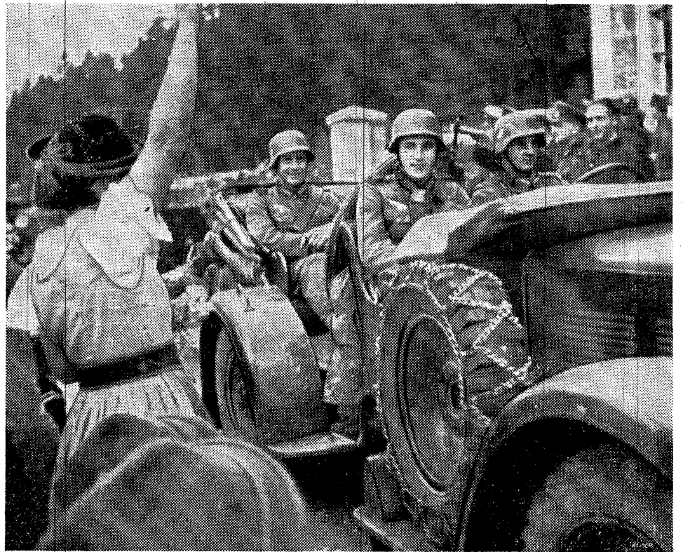
Saksa sõjaväeosad jõuavad Glöckelbergi Sudeedimaal.

See on aga esialgu ainult kawa, mis tuleb läbiwaatamisele ja kinnitamisele riikliku ehituskomitee koosolekul, w a b a r i i g i p r e s i d e n d i eesistumisel. Kawal läbiwaatamisest kütjutakse osa võtma ka sõjavägede ülemjuhataja kindral J. Laidoner, kes Wabadusväljaku aegse sõjavägede ülemjuhatajana on ühtlasi mälestusmonumendi püstitamise peakomitee esimeheks, nagu seda näeb ette wabariigi walituse poolt riigivoli kogule esitatav monumendi püstitamise korraldamise seaduse eelnõu.