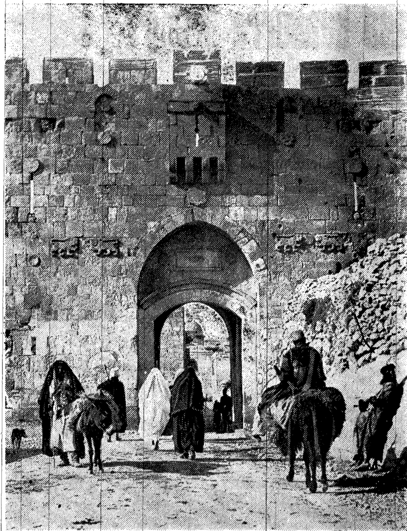
Wana linnavärav Jeruusalemas, kust nüüd maršivad sisse Inglise väeosad.

Rino „Modernis“ näeme tuntud näitlejate Magda Schneideri, Hans Söbneri, Karin Sardti, Ewald Blaski ja teiste kaasamängimisel moodat abieluolukorras, mis ähvardab purustada nelja noore inimese lootusrikka tuleviku. Peale sügavat läbielamust ja traagikat labeneb sündmuslik lõpuks iflagi nii, nagu seda soovitab laialdane kinopublik. „Raine teelakmel“ on film, mida võib vaadata ja kaasa elada.