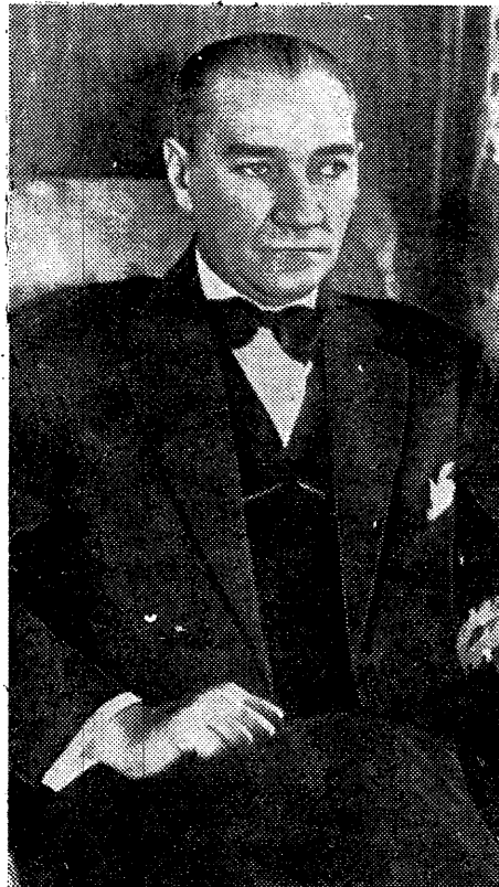
Türgi president Kemal Atatürk, kes on raskesti haige.

Metallihindade langus oli põhjustatud peamiselt nõudmise langusest ühendriikides ja ühtlasi tagavarade kaswamisest. Nüüd näib aga nõudmine ühendriikides uuesti kasvavat ja ühenduses sellega näitawad metallide hinnad maailmaturul tõusu.