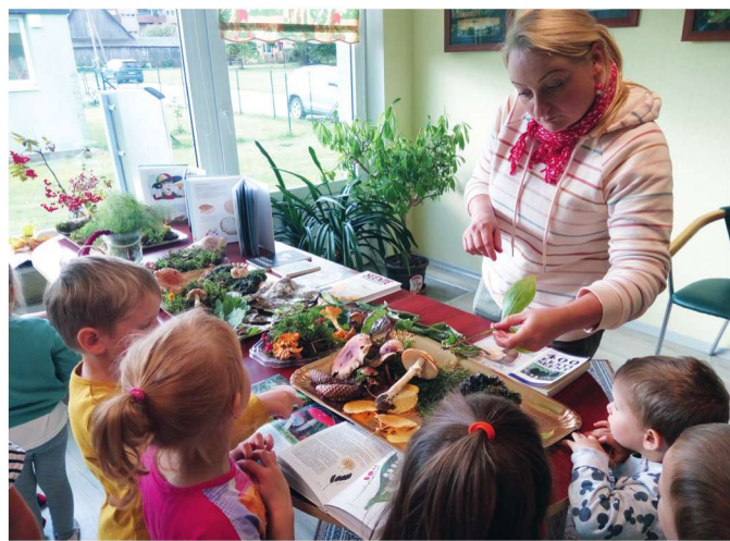
Seenenäitus Koosa raamatukogus.

Septembris, kõige magusamal seenekuul, panime Koosa raamatukogus üles seene- ja metsanäituse. Tõsi, ilmataat oli selleks ajaks kõik taevased veekraanid kinni keeranud ning metsaalune seetõttu üsna liigivaene, kuid tuntuimad seenemaailma juhtfiguurid meelitasime näitusele siiski kokku. Näitust külastasid kohalikud seenefanaatikud ning põhjalikuma seenetuuri tegime Koosa lasteaia lastele, kõige pisematest kuni suuremateni