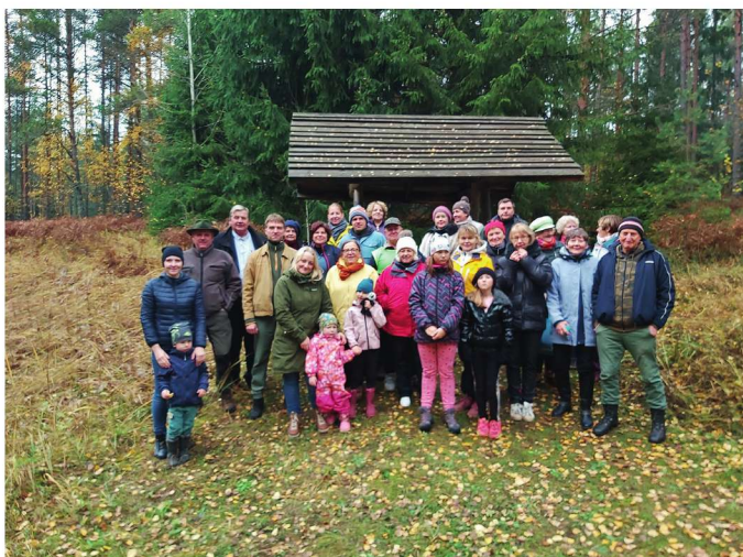
Kirjanduspikniku metsik seltskond.

suurest teest piisavalt eemal, et saaks eraldatust ja metsavaikust nautida. Teiseks on vaja söögi- ja joo-gipoolist, sest tühja lauaga ikka piknikku ei pea. Siin tulid appi kohalikud agarad pagarid (aitäh, Vigurid!) ja piknikulised ise: kes võttis kaasa kuuma taimeteed, kes maitsevaid kiluleibu, kes punapõskseid ubinaid – laud sai igaljuhul uhke. Ja kuna rõhk on sõnal kirjanduspiknik, siis loomulikult on sellisel üritusel vaja kedagi, kes pajataks lugusid ja meelitaks omakorda kuulajatelt mõned põnevad lood ja juhtumised välja. Seekordne esineja ei pidanud tulema kaugelt, võib öelda, et ta tuli lausa siitsamast,