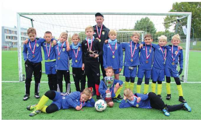
FC Peipsi United Junior poisid.

Teist päeva alustasid FC Peipsi United Junior poisid edukalt võites Soome VJS klubi poisse 2:1. Järgnenud mängus FC Helios Tartuga tuli meil aga vastu võtta napp kaotus – FC Helios