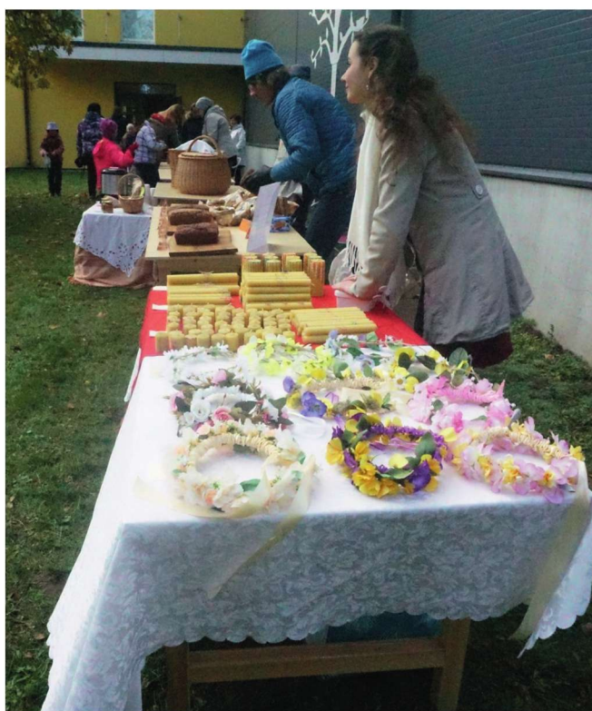
Vara külapäev ja sügislaad.

Kindlasti tuleb katsetusi leidmaks „meie oma“ erinevate sündmuste näol veelgi, sest uuring elanike vastuste näol on andnud meile omajagu sisendit ning mõtteid. Sündmusi korraldavad küll kultuu-