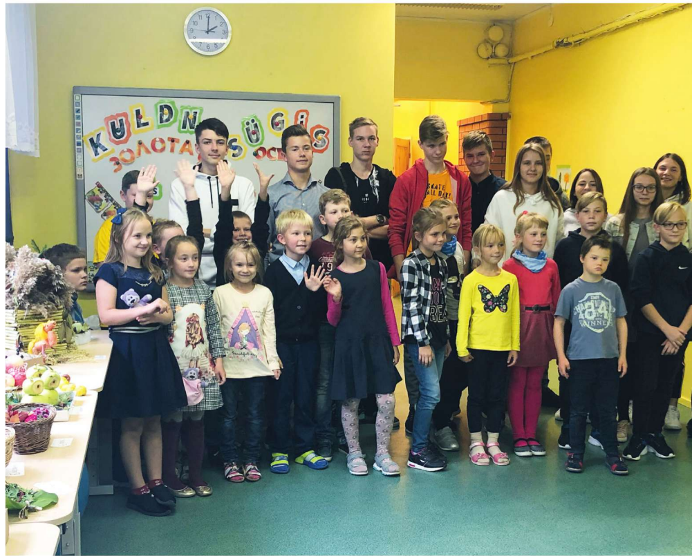
Дружная школьная семья Колкья

Колкьяская школа – это удивительный мир, где каждый день не похож на предыдущий. Школьный мир наполнен яркими событиями, открытиями, достижениями, незабываемыми впечатлениями. Здесь проходят современные уроки с использовани-