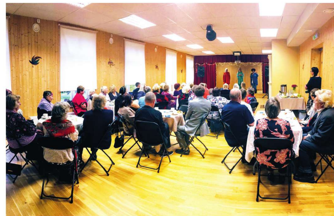
Pidu võib alata!