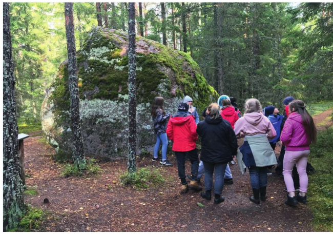
6. klass Lahemaal.