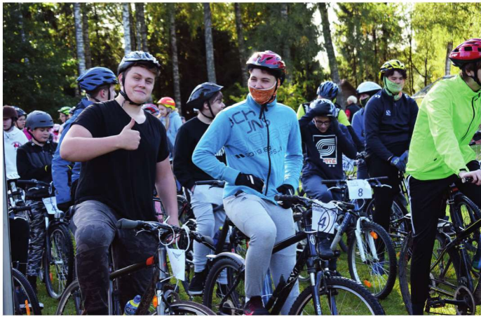
15. Pala Jalgrattamaraton.