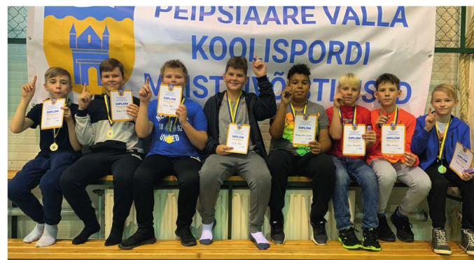
ja I poiste võistkond.

dus noppis võistluspäevalt kaks võitu, ühe viigi ja ühe kaotuse, mis andis meistrivõistlustel II koha. Vahetõttu kõige pingelisema heitluse pidasid omavahel Vara põhikooli tüdrukute võistkond ning Alatskivi kooli teine tüdrukute võistkond, kus võrdsete heitluse suutis siiski nabi võidu napsata Alatskivi kooli esindus ning neile kuulus võistlustelt III koht. Vara põhikooli tüdrukutele 4. koht ning Kallaste lasteaed-põhikooli võistkonnale kuulus 5. koht.