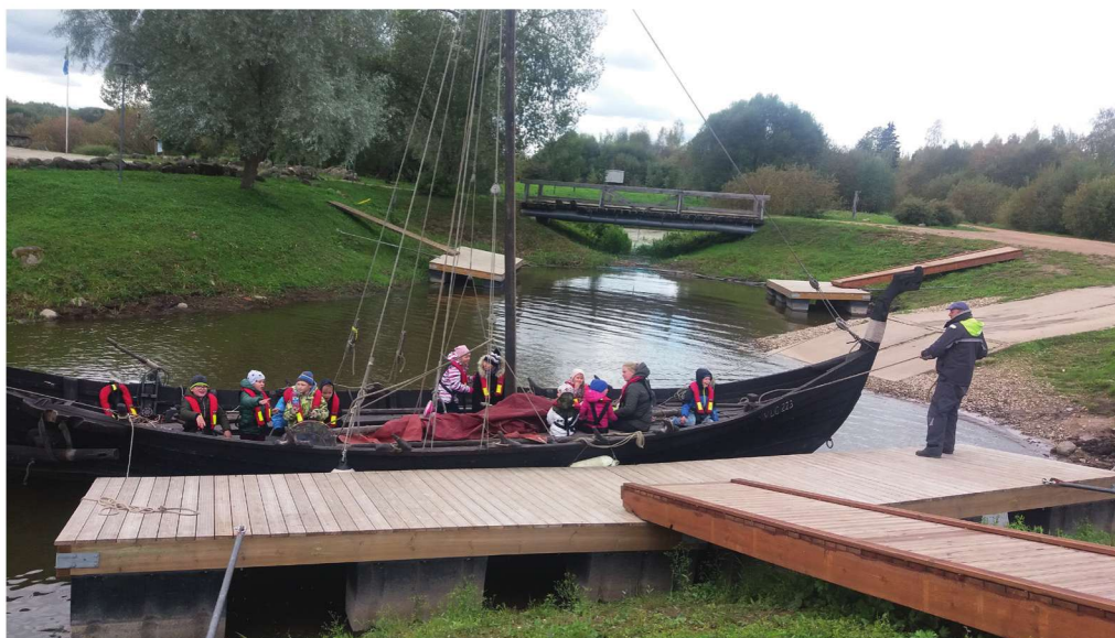
Õppepäeval Emajõe-Suursoos 1. klassiga.

MTÜ Jõe- ja Järvehuntide Akadeemia korraldas ka 3. ja 4. klassi õppeprogrammi „Eesti veekogud kaardil