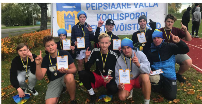
Peipsiääre valla koolispordi jalgpalli meistrivõistluste võitjavõistkond Pala kooli meeskond.

Kõige pingelisemaks ja traagikat pakkuvamateks mängudeks osutusid mängud 2.–4. kohale, kus omavahel püsisid Vara, Kallaste/Kolkja ning Alatskivi1 meeskonnad. Omavaheliste võrdsete mängude tulemusel suutis hõbemedalid välja mängida Kallaste/Kolkja koondvõistkond, mängides viiki Vara kooli meeskonnaga ning võites Alatskivi 1 meeskonda. Viimane omakorda alistas napilt Vara kooli meeskonna ning tänu sellele võidule kuulusid