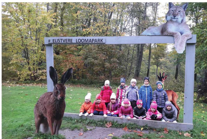
Pala lasteaia vanem rühm Elistvere loomapargis.

24. septembril olime külas oma sõpradel naaberlasteaias Kääpal Siilikese rühmas. Võistlesime koos ning „võtsime üksteiselt mõõtu“.