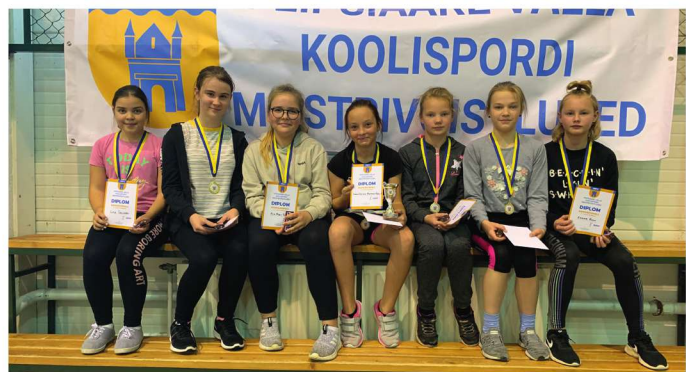
Juhan Liivi nim Alatskivi kooli I tüdrukute võistkond ...

Enne esimest koolivaheaga toimusid Pala kooli spordisaalis teist korda Peipsiääre valla koolispordi meistrivõistlused rahvastepallis 4.–5. klassile. Kokku osales kümme võistkonda – viis poiste võistlusklassis ja viis tüdrukute võistlusklassis. Mõlemas võistlusklassis osalesid Pala, Kallaste, Vara ning kahe võistkonnaga Alatskivi kooli esindused.