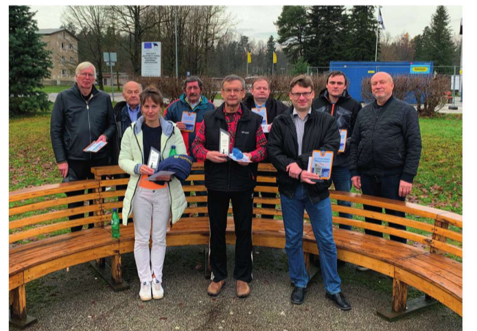
L. Holsti mälestusturniiril osalejad.