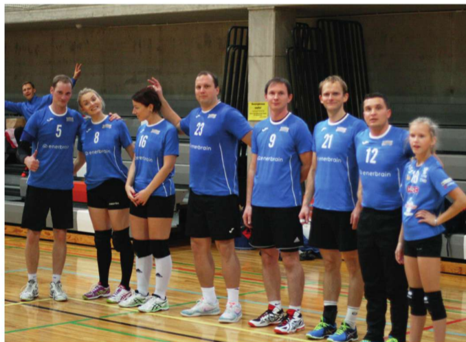
SK Juku indiacas MV I voor.

Lõplikud kohad 2020 EMV selguvad pärast teise vooru mängu 7.–8. märtsil 2020 uuesti Suure-Jaanis.