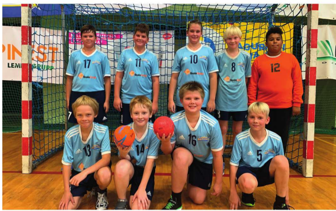
Spordiklubi Juku käsipallipoisid 2019 Eesti karikavõistlustel.

Nädalavahetusel, 19. ja 20. oktoobril osalesid Alatskivi spordiklubi Juku käsipallipoisid oma hooaja esimestel võistlustel. D-vanuseklassis 2007 ja hiljem sündinute võistkonnaga mängiti Eesti karikavõistlustel Põlvas kokku viis mängu. Võistlustel osales kokku 12 võistkonda, kes olid jagatud kahte alagruppi Põlvas ja Kehras. Alatskivi spordiklubi Juku võistkonnaga mängisid A-alagrupis koos Põlva SK 1, Viljandi SK, Tallinna Käsipalliakadeemia 1, Tallinna Käsipalliakadeemia 2, Põlva SK 2. Võistluste esimeses mängus võideti kindlalt Viljandi spordikooli esindust. Järgmises mängus Tallinna Käsipalliakadeemia 2 võistkonna vastu pusiti kõvasti ja tasavägiselt kulgenud