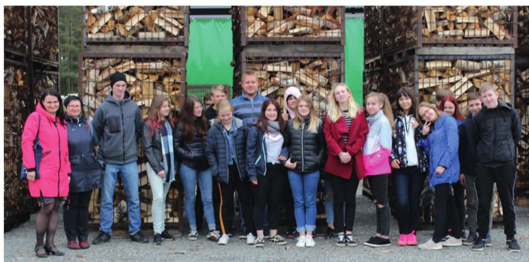
OÜ Kroonipuu külastamine mais 2019.

SA Innove rahastatud projekti „Ettevõtlikkuse arendamine Juhan Liivi nim Alatskivi Koolis“ raames on toimunud alates aprillist 2019. a mitmeid tegevusi, mis on aidanud tõsta noorte teadlikkust ettevõtlikust ja arendada ettevõtlikku hoiakut. Projekti periood on 01.04.2019–30.09.2020 ja seal osalevad Juhan Liivi min Alatskivi kooli 8. ja 9. klassi õpilased.