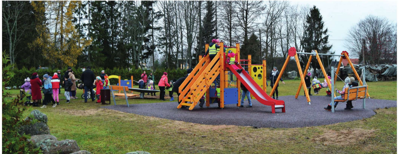
Pidulik mänguväljaku avamine ja lindi läbilõikamine.