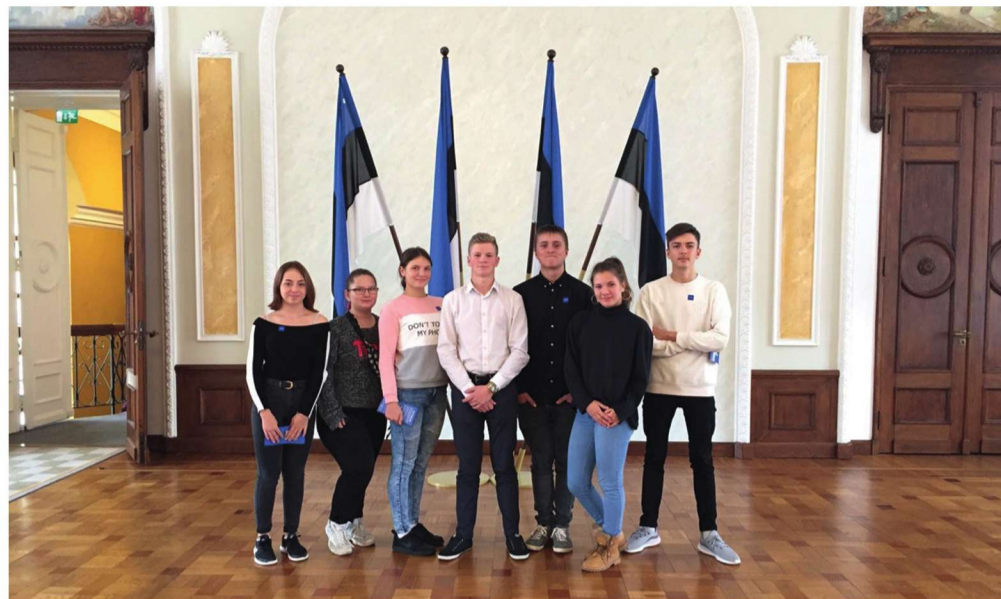
Наши Дети - это наше будущее!