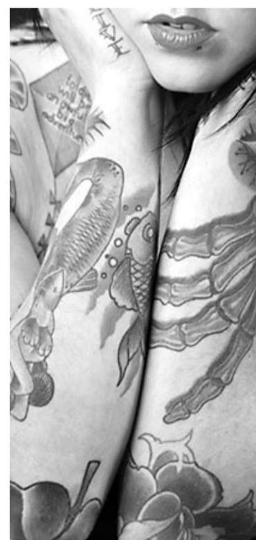
Tätoveeringud võivad saada töötajale tööleilmisel üheks peamiseks takistuseks.

Timmingu sõnul muretsevad juhid, et kliendid võivad tätoveeringuga töötajat pidada eemaletõukavaks, maitsetuks ja lohakaks. Sellegipoolest ei olnud mitte kõik värbajad täielikult neile vastu. Tim-