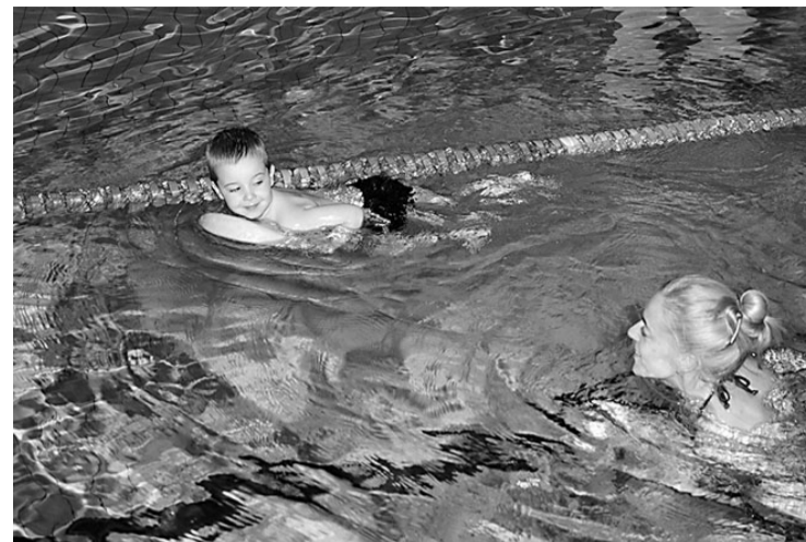
Mäetaguse ujumisteisipäevakutel saavad osaleda nii suured kui ka väikesed.

Etendus "Eesti balleti 95" toimub Jõhvi kontserdimajas neljapäeval, 26. septembril kell 19. Pileti hind 10, 15, 20 eurot.