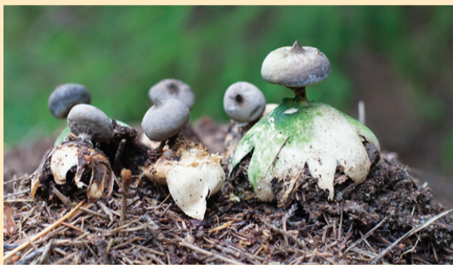
Seenenäitus jääb RMK Kauksi loodusmajas avatuks nädalaks kaheks. Lahtiolek sõltub sellest, kui palju õnnestub väljapanekut värskendada. Näitusel näeb teiste seas ka efektseid maatahti (pildil). Seenepäevad korraldavad keskkonnaamet, riigimetsa majandamise keskus, Alutaguse matkaklubi ja lisaku vallavalitsus.