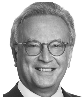
Hannes Swoboda.

Selleks peab Venemaa muutma oma seadusi ja korra ning muidugi ei saa seda teha Venemaa ja Ukraina ja teised riigid ei saa sama vastutuleku osalisteks. Ma ei kujuta ette väga massilist emigreerumist Venemaalt välja, kui inimesed teavad, et saavad vabalt liikuda sisse ja välja. Peab olema kindlalt fikseeritud, et kui sellele viisavabadusele järgneb liiga suur migratsioon, see režiim katkeb. Kui siinne regioon upuks Vene migrantidesse, oleks see muidugi negatiivne, aga ei usu, et