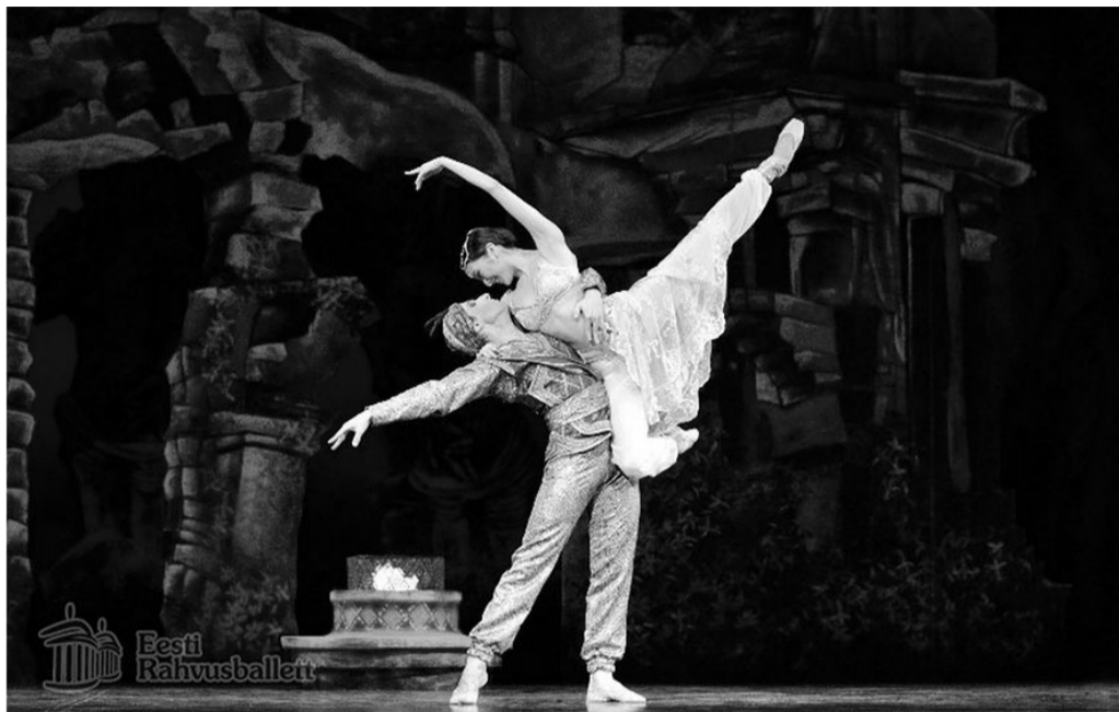
Estonia rahvusballeri galal näeb ka soolot balletist "Bajadeer".

Eile keskpäeval pandi nurgakivi Jõhvi eesti gümnaasiumi uuele spordihoonele, millest kohalikud spordisõbrad on unistanud aastakümneid. Nurgakivi paneku ajaks olid ehitajad tulevase sporditempli esimesed sarikad juba püsti ajanud. Nende hinnangul käib sellist tüüpi hoone "skeleti" rajamine kiiresti, märksa enam võtavad aega sisetööd. Spordihoone peaks valmima järgmise aasta augusti lõpuks. Spordihoones saavad olema pallimängude ja raskejõustikusaal ning tribüün, mis mahutab 630 pealtvaatajat. (Põhjarannik, 24. september 2008)