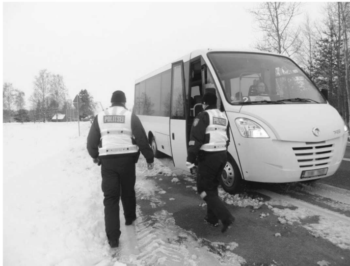
Politseinikud kontrollisid eile hommikul bussides turvavöö kasutamist ning pidid tõdema, et hiljutised õnnetused pole enamikule sõitjatest hoiatavalt mõjunud.