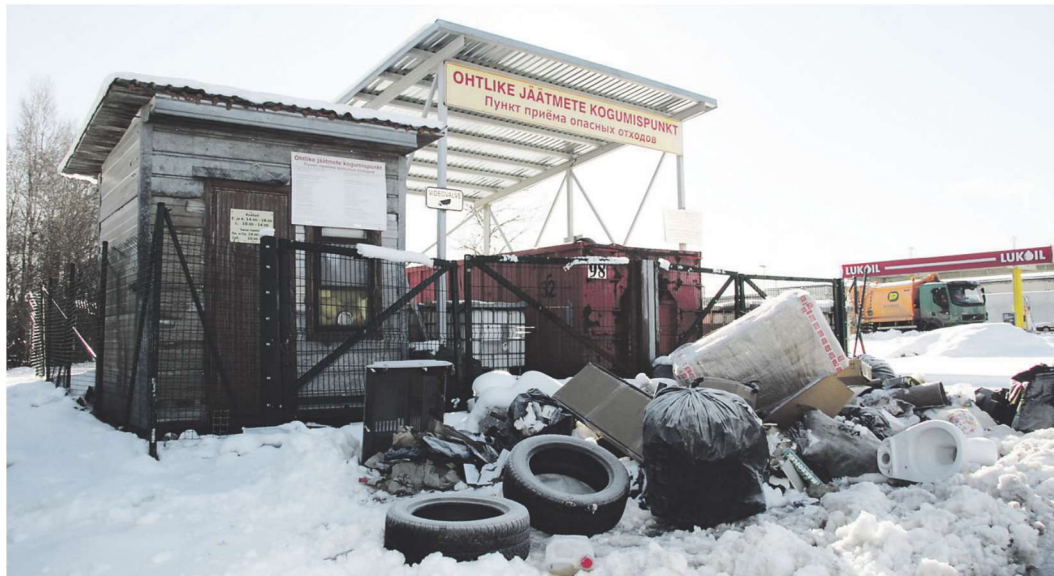
Ahtme ohtlike jäätmete kogumispunkti juurde prügikoormat maha pannes tasub nüüd arvestada päris kopsaka trahviga. PEETER LILLEVÄLI

"Varem polnud mõtet selliseid kirju saata, sest linnavalitsus poleks saanud süüdlaste leidmiseks midagi teha," ütles Ekoviri juhatuse liige Vikto-