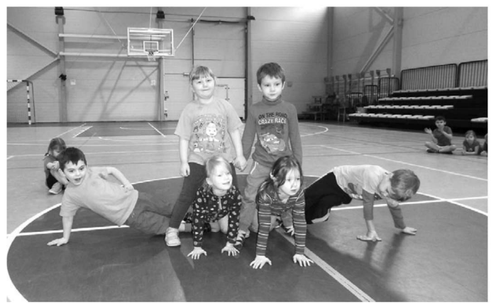
Voka spordihoones toimunud spordipidu kinkis lastele hulgaliselt emotsioone ning väsimusest hoolimata ei tahtnud keegi koju sõita.