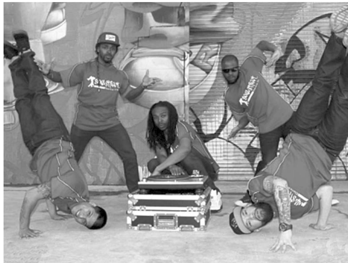
Breiktants on noorte seas populaarne. Foto on illustratiivne.

Osalejaid hinnatakse kolmes vanuserühmas: kuni 11aastased lapsed, 11-16aas-