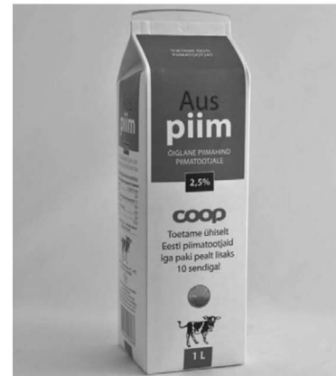
Aus Piima ostjad toetavad Eesti piimafarmereid.

Möödunud nädalal tuli Eestis müügile Aus Piim, mille eesmärk on toetada Eesti