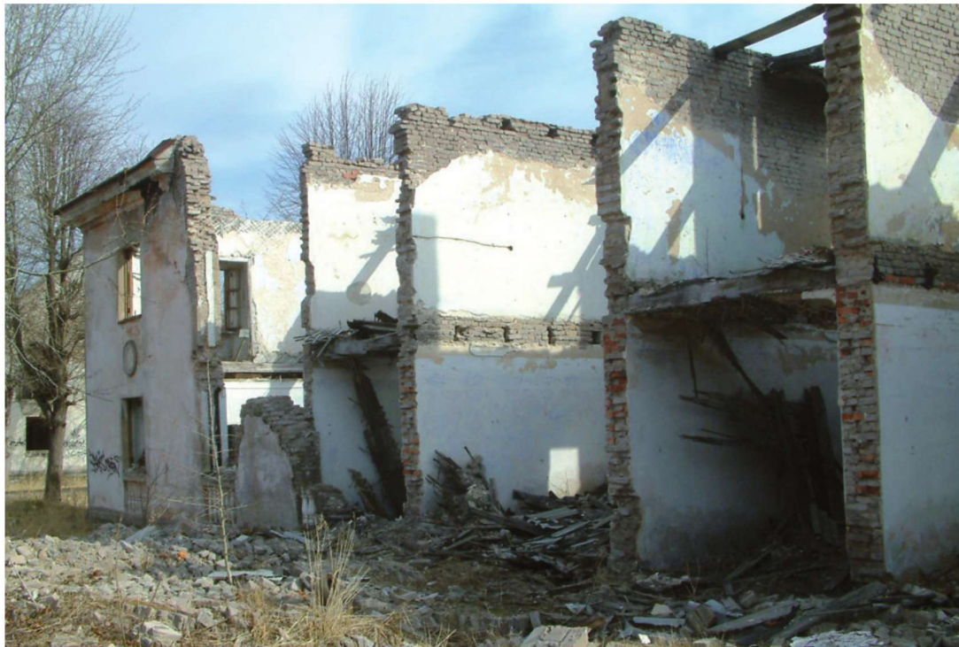
Selline näeb välja n-ö kohustuslik pilt Viivikonnast.