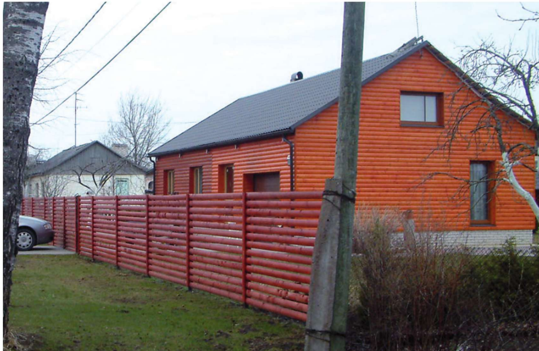
Selline näeb välja Viivikonna kenam pool, mis Ida-Virumaast järjekordset öuduspilti maalima tulnud saate- või filmitegijaid ei huvita.