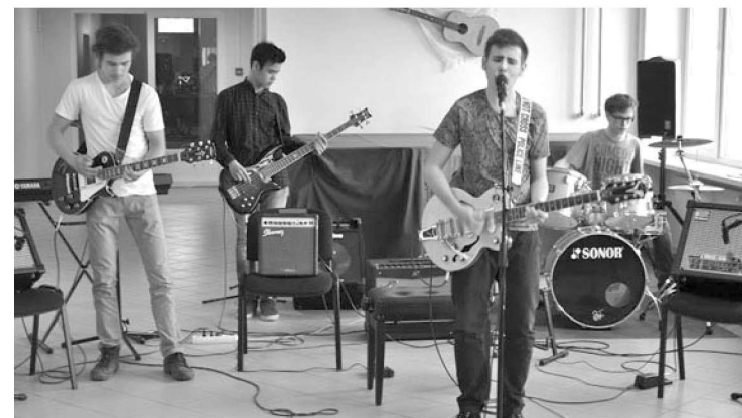
Kohtla-Järve kunstide kooli ansambel Apple Juice tunnustati tänavuse konkursi-festivali "Vaba lava rock" parimaks rokkbändiks.

Festivali "Vaba lava rock" ammu traditsiooni kohaselt antakse parimale uustulnukale eriauhind. Tänavu sai selle Ahtme kunstide kooli ansambli Band AKK noorem koosseis.