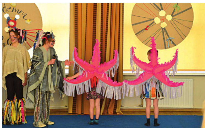
Moedemmi võitjad, Kohtla-Järve Järve gümnaasiumi 7. klassi noored disainerid oma fantaasiaküllast tööd demonstreerimas. MARIANNE LAINEMÄE

"Päev enne moedemmi tu- li meil tublide õpilasesindu- se liikmetega olla lausa ühek- sani õhtul koolis. Valmistasi- me saali kaunistamiseks hiig- laslikud nõõbid ja muudki hu- vitavat. Pidime olema heaks