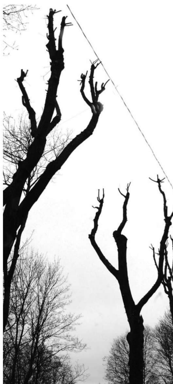
Kas see on tõesti euroopalik lõikustüü või on see oskamatu puude lõikamine?

Lotkova sõnul tasub ära oodata puude lehtemineku ja alles siis anda lõikamisele hinnang. "Inimesed po-