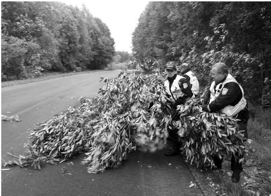
Teele langenud puid ja oksa eemaldasid nii politseinikud kui päästjad.