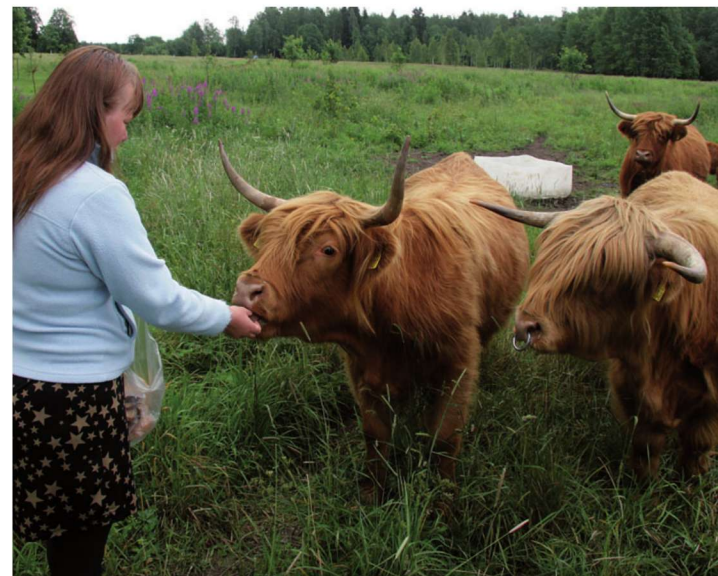
Hedi Aia varub ka avatud talude päevaks leiba-saia, et külastajad saaksid šoti mägiveistega sõprust sobitada.

Üle-eestiline avatud talude päev toimub teist korda.