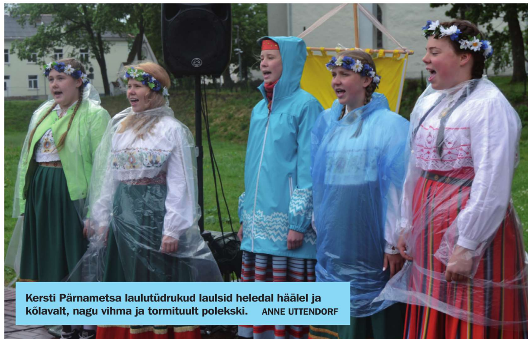
Kersti Pärnametsa laulutüdrukud laulsid heledal häälel ja kõlavalt, nagu vihma ja tormituult polekski. ANNE UTTENDORF