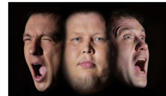
Hellad Velled esinevad Purkse Jaanitulel.