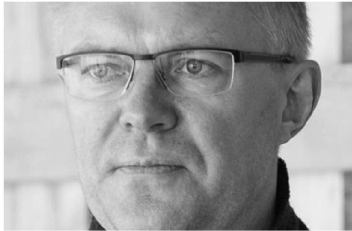
HANNES HANSO, KAITSEMINISTER, SOTSIAALDEMOKRAATLIK ERAKOND

Eestis ringi sõites olen ma kogenud, et inimestele jääb termini "heidutus" tähendus mõneti arusaamatuks. Seetõttu on selgitamine igati asjakohane. Me seisame heidutuse eest, mis koosneb neljast osisest. Neist esimene hõlmab meie iseseisvat kaitse-