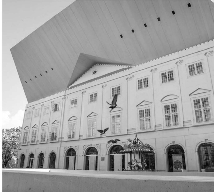
Välismaalased õpivad Narva kolledžis vene keelt kaheksa nädalat kestval suvekursusel.

Tartu Ülikooli Narva kolledži vene keele suvekoolide traditsioon sai alguse 2014. aastal ning iga järgneva aastaga on vene keele õppes osalejate arv kasvanud. Suurenenud on ka tudengite geograafiline taust, kus lisaks Ameerika Ühendriikidest pärit noortele leiavad tee Narva ka Prantsusmaa, Rootsi ja ka Eesti õppijad.