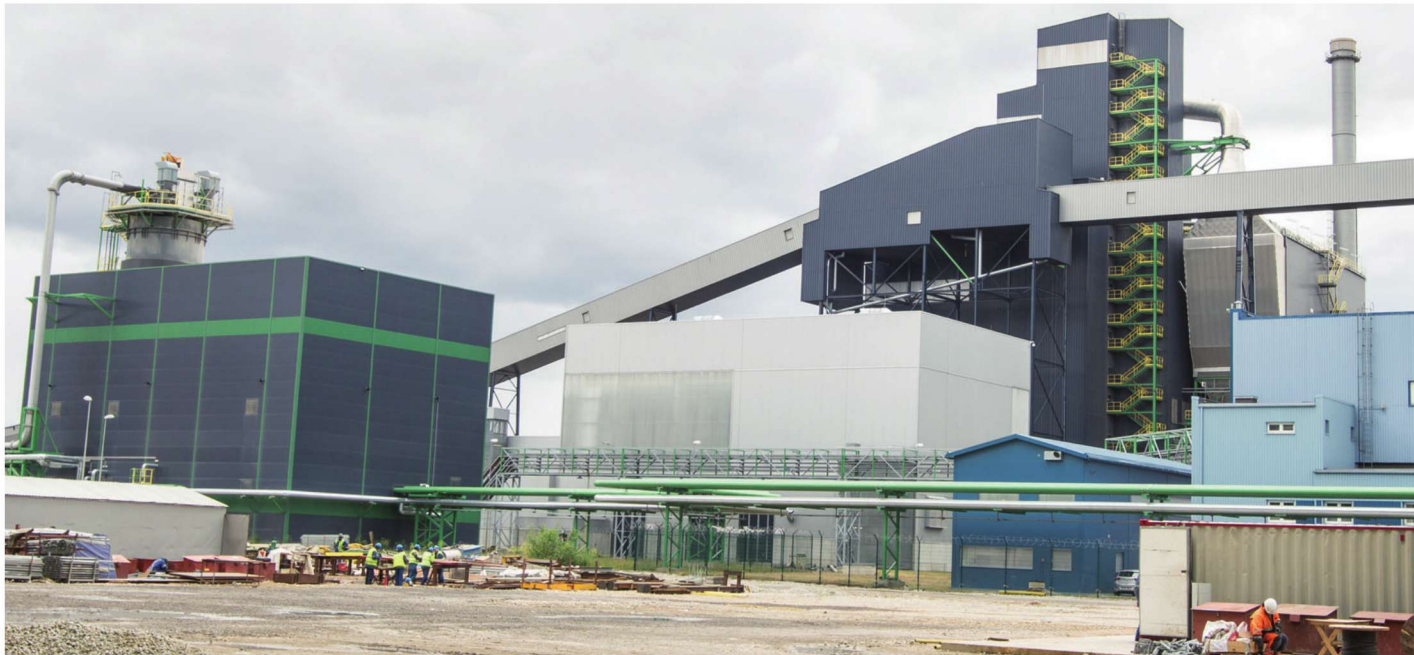
Uue õlitehase Enefit280 käivitamiseks on kulunud loodetust mitmeid aastaid rohkem. Kuid nüüd ollakse kavandatud töökindluse ja koormuse saavutamisele lähedal ning Eesti Energia loodab järgmisel aastal teha otsuse järgmise õlitehase püstitamiseks. MATTI KÄMÄRÄ

Harku vangla tootmistehhis valmistab firma õmlustoodangut ning komplekteerib ja pakendab kaupa. Viru vangla tootmistehhis toodab firma saunaahjusid ja metallkonstruktsioone, puitkonstruktsioone ja mööblit. Tartu vangla tootmistehhis toodab ettevõtte metallmööblit, grille, suitsuahjusid ja metallkonstruktsioone. (BNS)