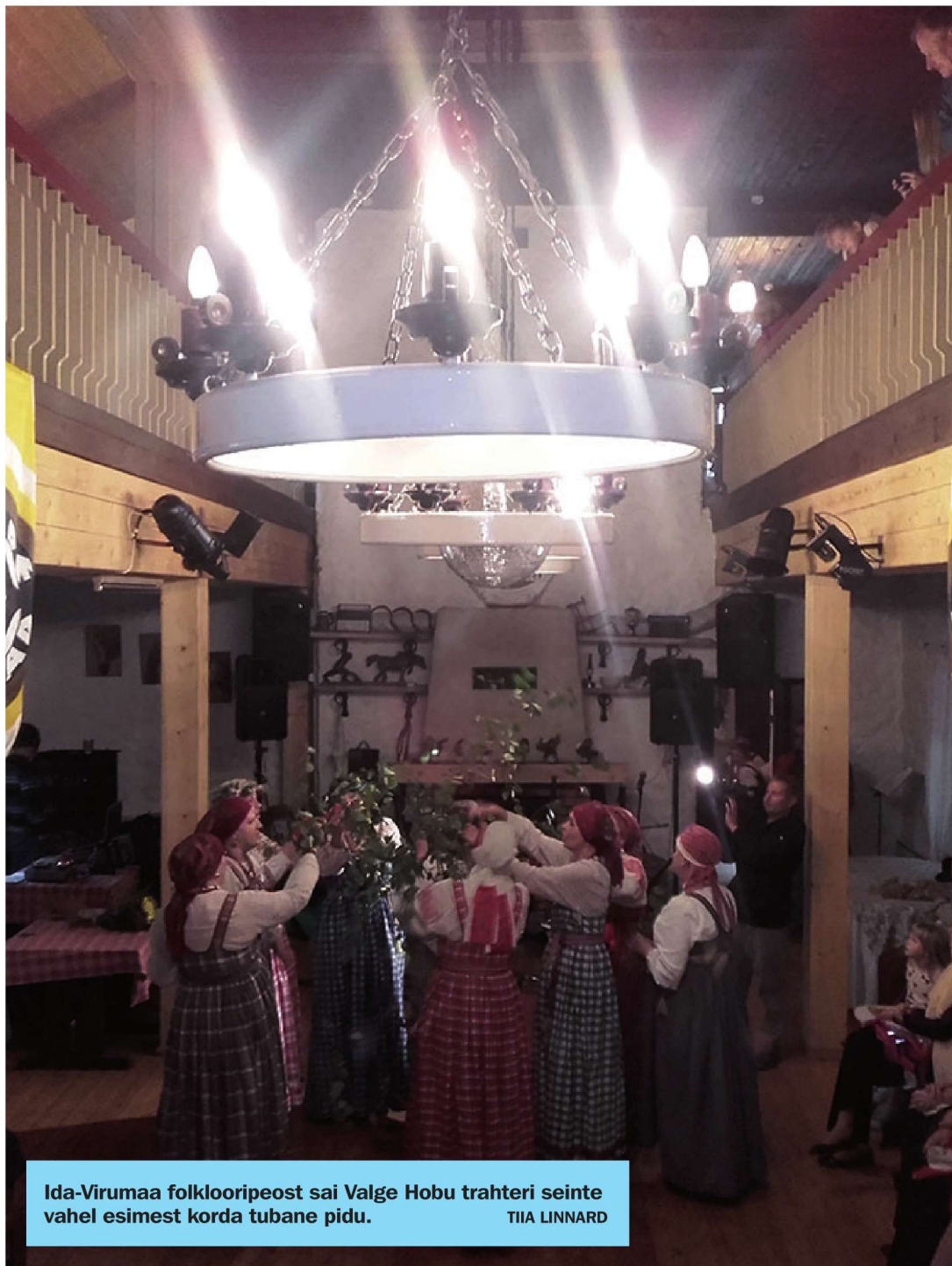
Ida-Virumaa folklooripeost sai Valge Hobu trahteri seinte vahel esimest korda tubane pidu. TIIA LINNARD