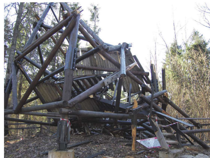
Vanurist vaatetorn ei pidanud tugevale tuulele vastu.

2001. aastal ehitatud Iisaku vaatetorn pidas vastu pikemalt, kui eksperdid tolaegsete puittornide elueaks pakuvad ehk 12 aasta asemel lausa 15 aastat. Tõsi, viimastel aastatel on torni paigutatud ja tugevdatud ning selle külastuskoormust vähendatud. (PR)