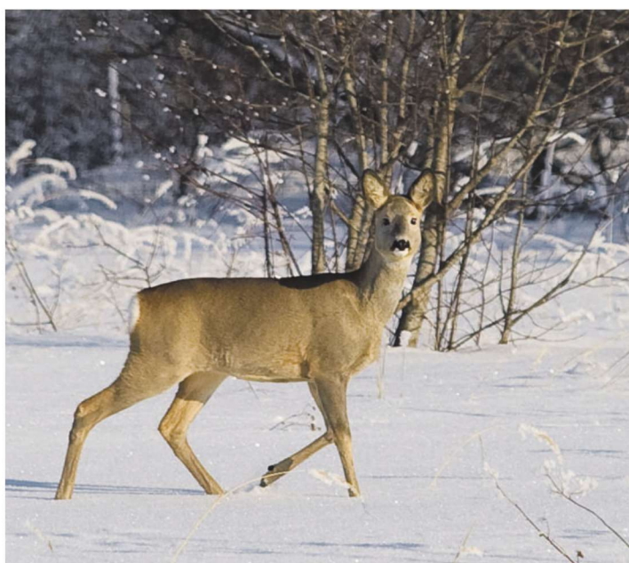
Kaber ehk metskits, kes on tegelikult hoopis hirvlane.

oma vahepeal unustusse jäänud talled üles ja hakkab nendega koos ringi liikuma.