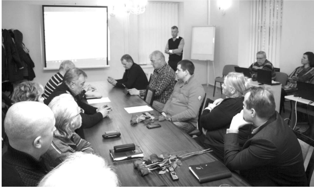
Märtsis oli Murru lubjakivikarjääri teema arutusel Lüganuse vallavolikogus.

Müra uurides võeti aluseks olukord, kus korraga töötavad nii buldooser, ekskavaator kui ka kallur, ning leiti, et isegi siis ei ületata lubatud piirväärtust. Müra leevendamiseks soovitati karjääri välispiirile kõrgemaid pinnase-