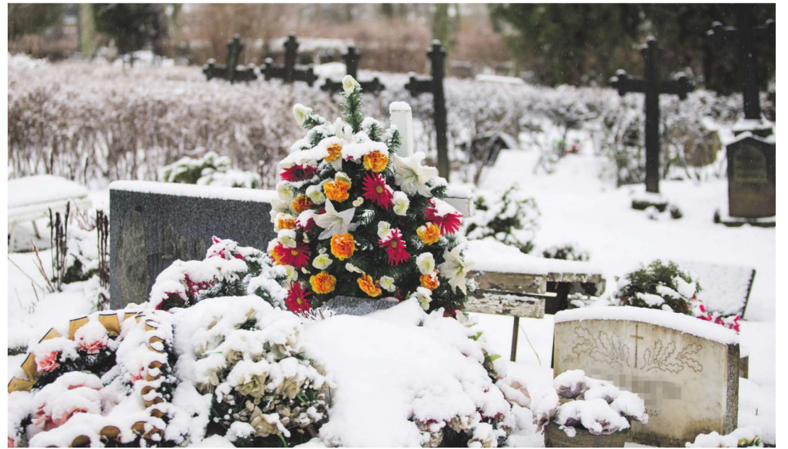
Riik on lubanud toetada matuste korraldamist kõikide lahkunute puhul 250 euro ulatuses, ent eraldatud summa seda kõikides omavalitsustes ei kata. Pilt on illustratiivne. MATTI KÄMÄRÄ

Tammiste meenutas, et kui nn matusetoetuse eelnõu läks riigikogus esimesele lugemisele, oli selle algne mõte teist-