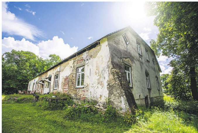
Mõisa peahoone ostis selts endale 2001. aastal.