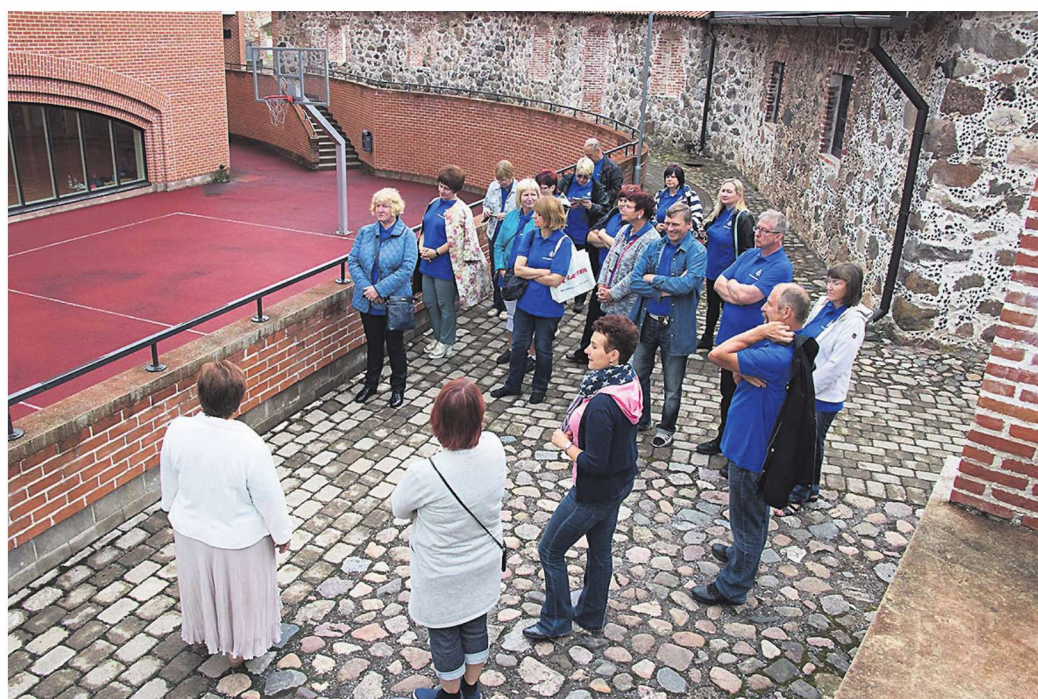
Heimtali ringtalli ringluses.

sellega seonduvad pinged, suhted/ettevõtlus külates, haridusprobleemid. Leiti, et külas ei muutu reformi tõttu midagi, aga inimesed kardavad muutusi. Ent sellega oleval nagu teise veekaussi hüppamisega – käib plärts, aga varsti seda ei mäletagi. Ka peljatakse eksimise-silti külge saada ja sealt tulebki pidur.