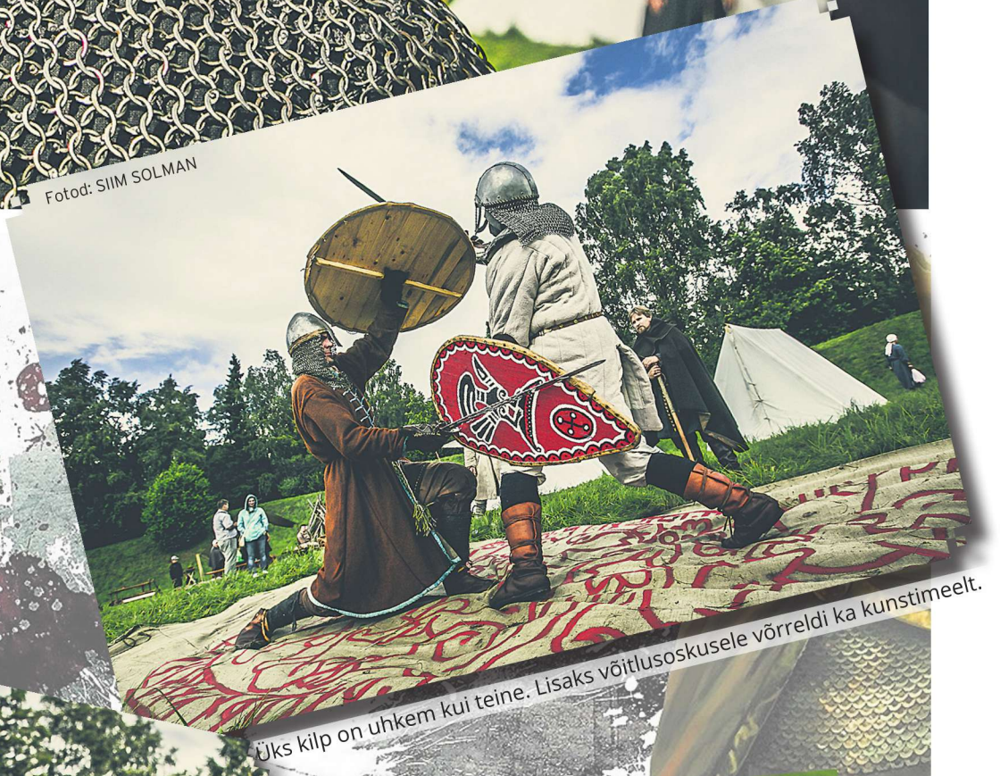
Üks kilp on uhkem kui teine. Lisaks võitlusoskusele võrreldi ka kunstimeelt.