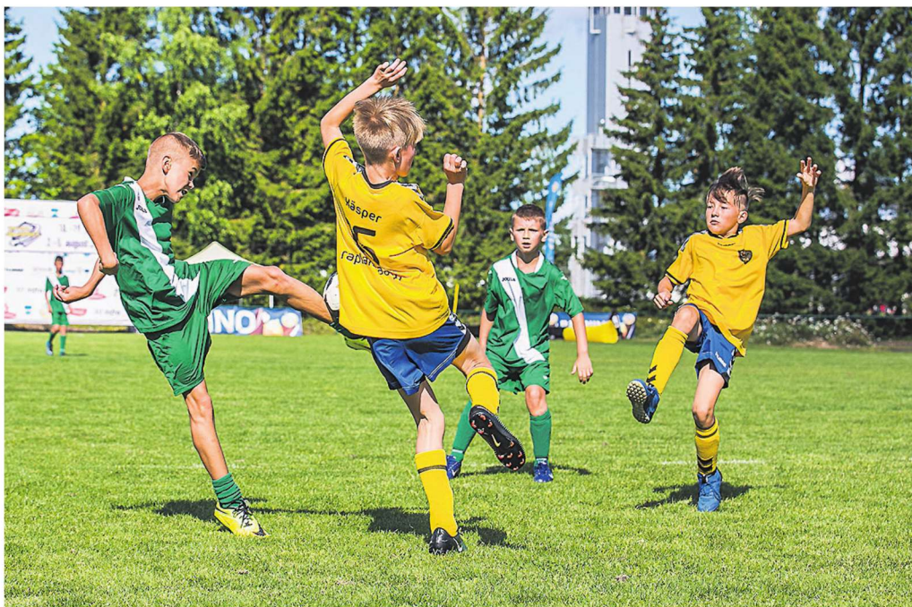
Rohelises vormis FC Snovsk (Ukraina) oli üks kahest välismaa klubist, kes oma esindused Jalkafestil välja pani. Teine oli SK Babite Lätist.