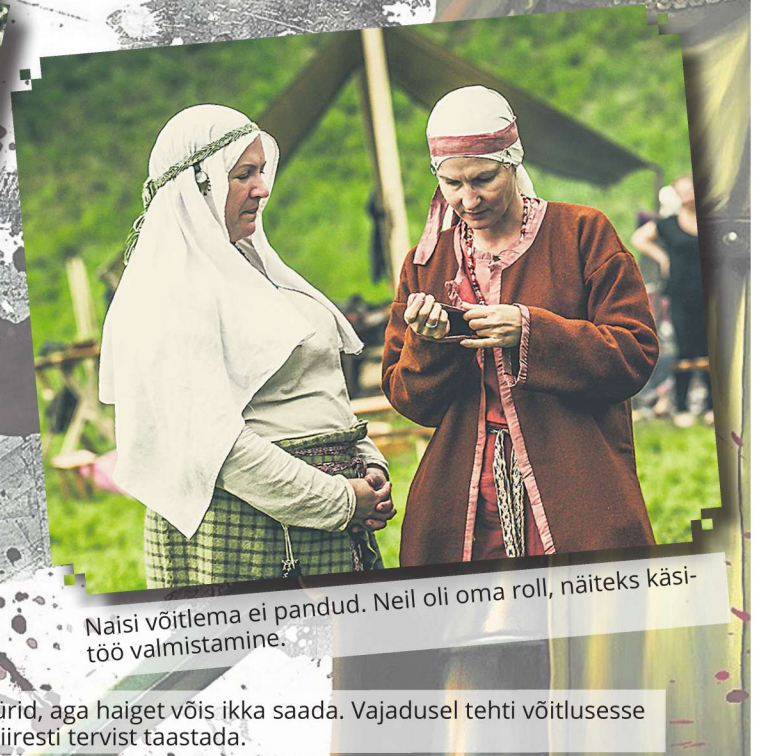
Naisi võitlema ei pandud. Neil oli oma roll, näiteks käsitöö valmistamine.