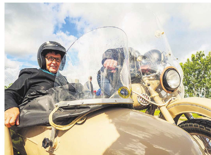
Kiivrid peas ja lõbusõiduks valmis!

Vanatehnika päeva korraldab Spordiklubi Laansoo Motokrossi Team MTÜ koostöös MTÜ-ga Kaiu Koos.