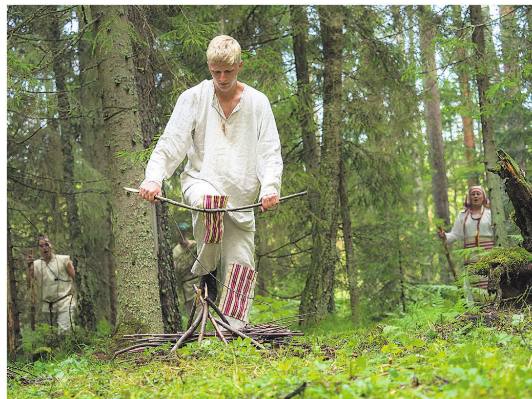
Meenus muinasajast, kui tuli süüdati kaitseks võõraste vastu.

Rasketel aegadel kerkis aga armastus veelgi enam esile. Olgu ajad kui rasked tahes, lootus ja armastus püsivad siiski. Näitlejate ühiselt lauldud Kadi Uibo loodud lõpulaul tekitas külmavärinaid. Selles oli mingi jõud, mis ongi ilmselt see, mis pole lasknud meil kunagi täielikult kellelegi alistuda.