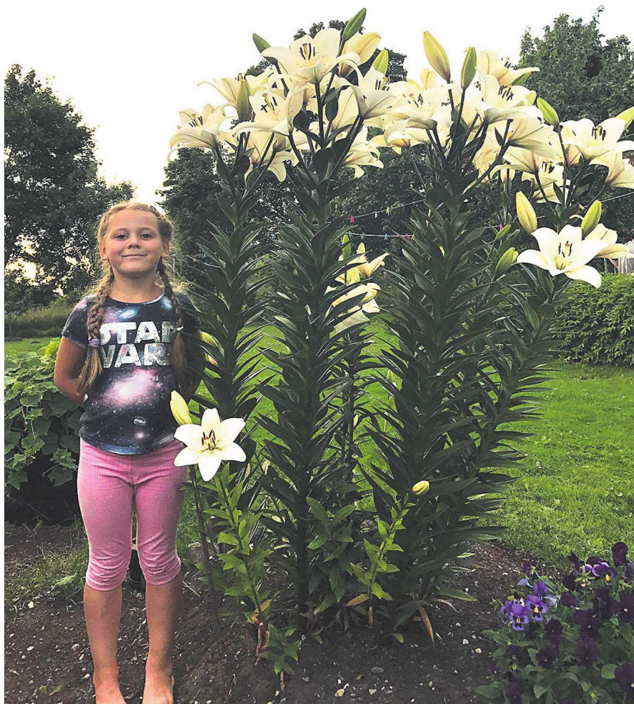
Väike tüdruk ja hiigellilliad.