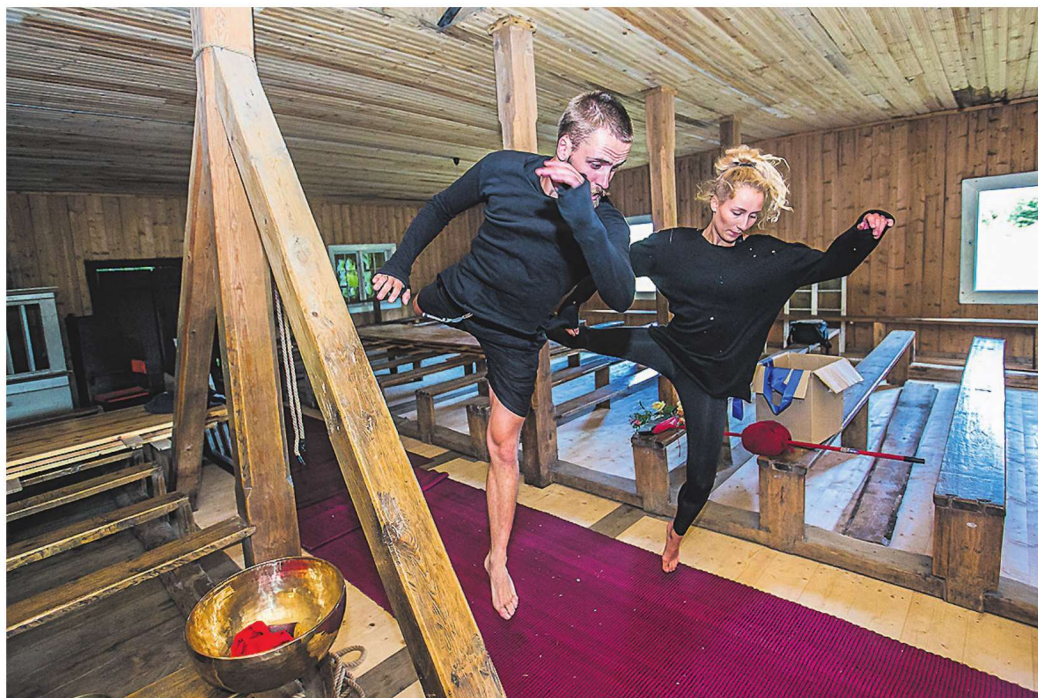
Hetk etenduse proovist, kus tantsuliigutused detailideni paika pandi.