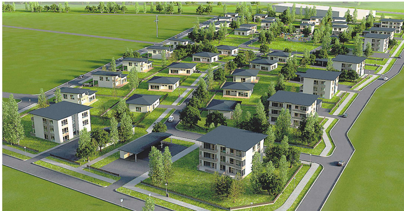
Uusküla tulevane elurajoon. Eskiis.

Kui järelejäädud avalikustamise perioodi jooksul ettepanekuid ega vastuväiteid vallavalitsusele ei laeku ning volikogu detailplaneeringu kinnitab, on Pärna sõnul võimalik, et n-õ kopa maasse loomine toimub juba tänava oktoobris. Ta lisas kohe, et pigem on see optimistlik hinnang. Samamoodi võib tööde algus edasi nihkuda järgmise aasta kevadesse.