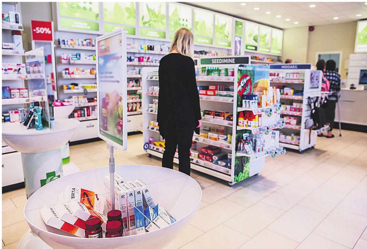
Aegunud ravimid saab aga jäätmejaama asemel ka kohalikku apteeki tagasi viia.

Jäätmekavaga on võimalik tutvuda kõigi osalevate omavalitsuste ruumides ja veebilehtedel.