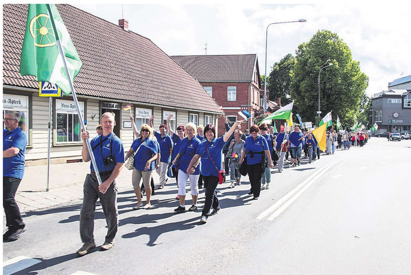
Heia-heia hipp-hopp, Raplamaa on tipp-toppi!

Need kolm päeva möödusid lennates ja taevataatki oli maa-rahvaga mestis – kui rahval vaja väljas olla, pihustas vaid paar piiska, ja kui päästev katus peakohal, ladistas mõnuga. Külarahva tulevik tundub igati helge, kui lisaks valitsusele jätkub koostöö ka ilmvavanaga, piisab kui Põlvamaa Maapäevalgi.