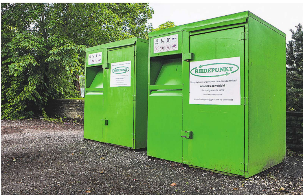
Riidekonteinerid on kahtlemata kõige kiirem ja mugavam viis oma korralikest riietest vabanemiseks. Asuvad need Rapla kultuurikeskuse kõrval.

säästupirnid), päevavalguslambid, patareid ja akud.