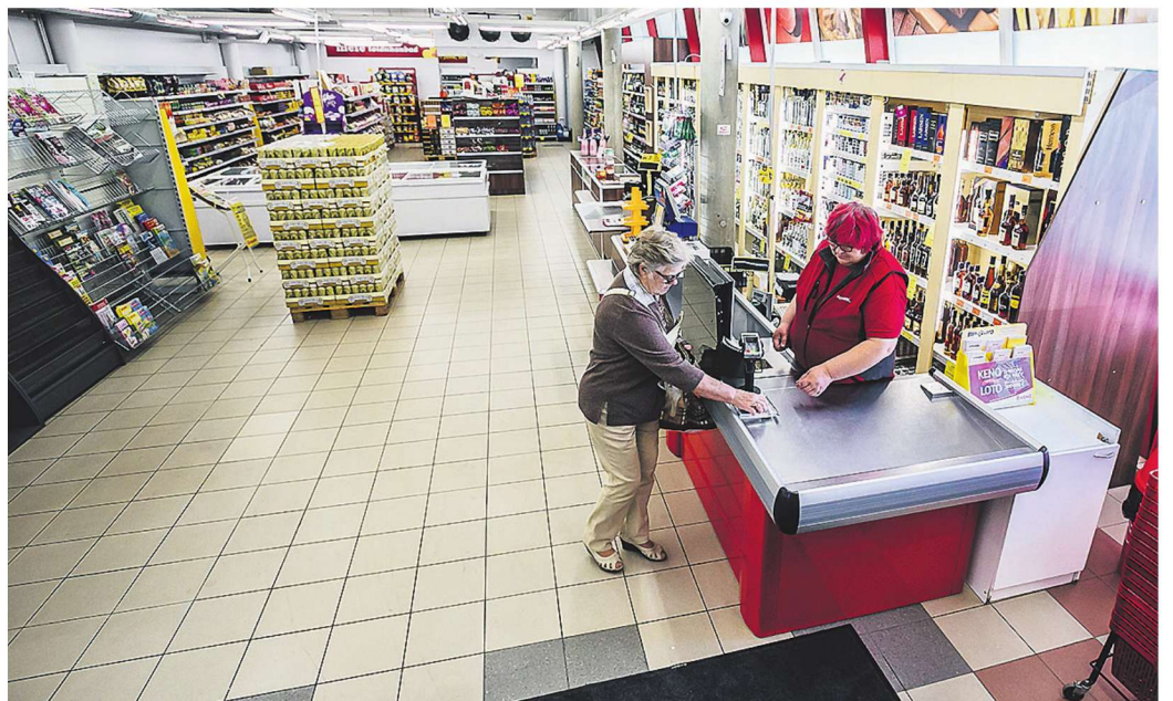
Meie Toidukaupad on taas puhta ja valgusküllasena külastajatele avatud.