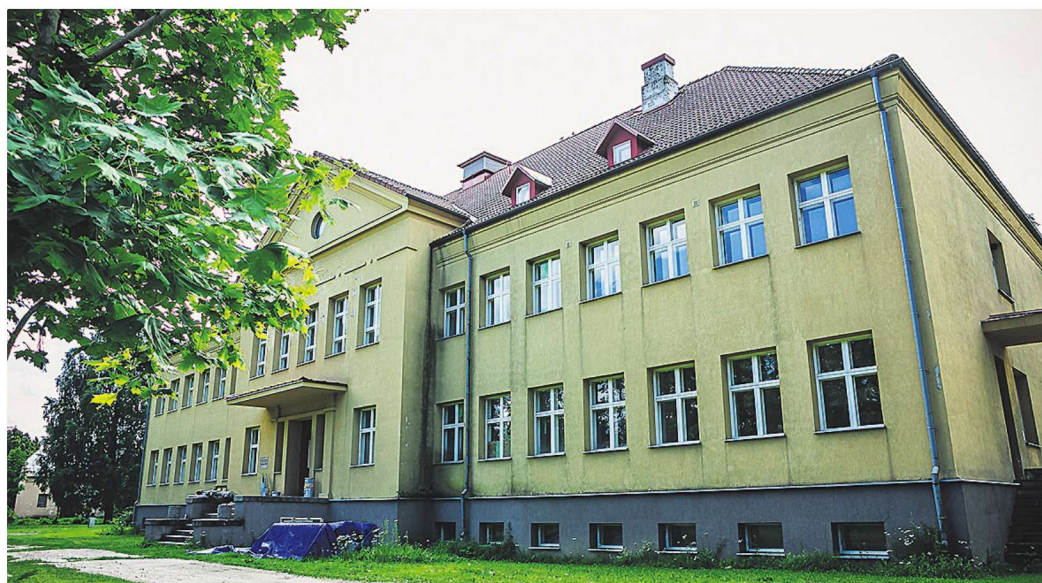
Paistab, et tööd endise katsekeskuse hooldekoduks muutmiseks on täies hoos.

Juuni keskel toimunud Rapla vallavalitsuse istungil otsustati anda ehitusluba Kuusiku alevikus asuva korterelamu ümberehitamiseks hooldekoduks. Tegemist on endise Kuusiku katsekeskuse majaga, kus hakkab hooldekodu pidama Ardis Konsultatsioonid OÜ.