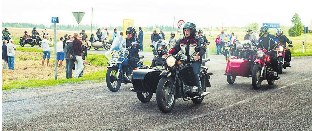
Tähesõidust võttis osa umbes 160 masinat.