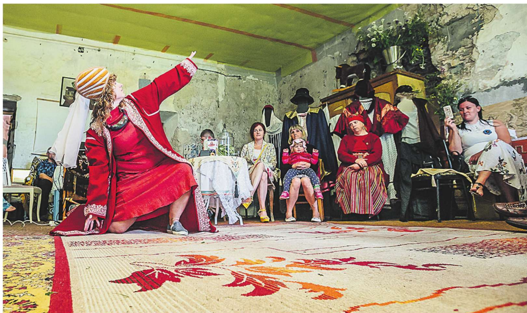
Kohaletulnud said nautida hubast atmosfääri, maitsvat kehakinnitust ja natuke meelelahutust.

Mõisa uksest sisse astudes tervitab külastajaid hubane atmosfäär. Ruumis on mitmeid pehmeid istumiskohti ja väikesed lauakesed, kuhu kohvitass toetada. See on mõisa ainuke suur ruum. Kontsertide ja etenduste ajal on sinna ka 120 inimest mahutatud. Kõik mõisas vaadata olev on aja jooksul vaikselt kogunenud.