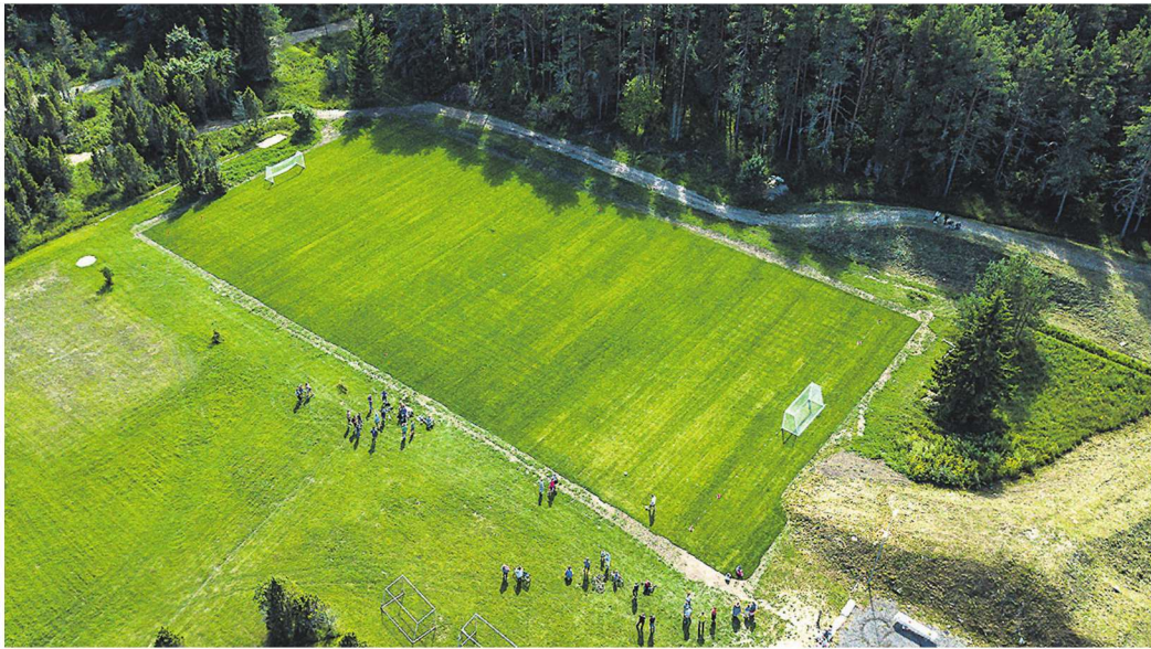
Tegemist ei ole küll täismõõtmelise väljakuga, aga see-eest on seal väga korralik murukate ja uued väravad.