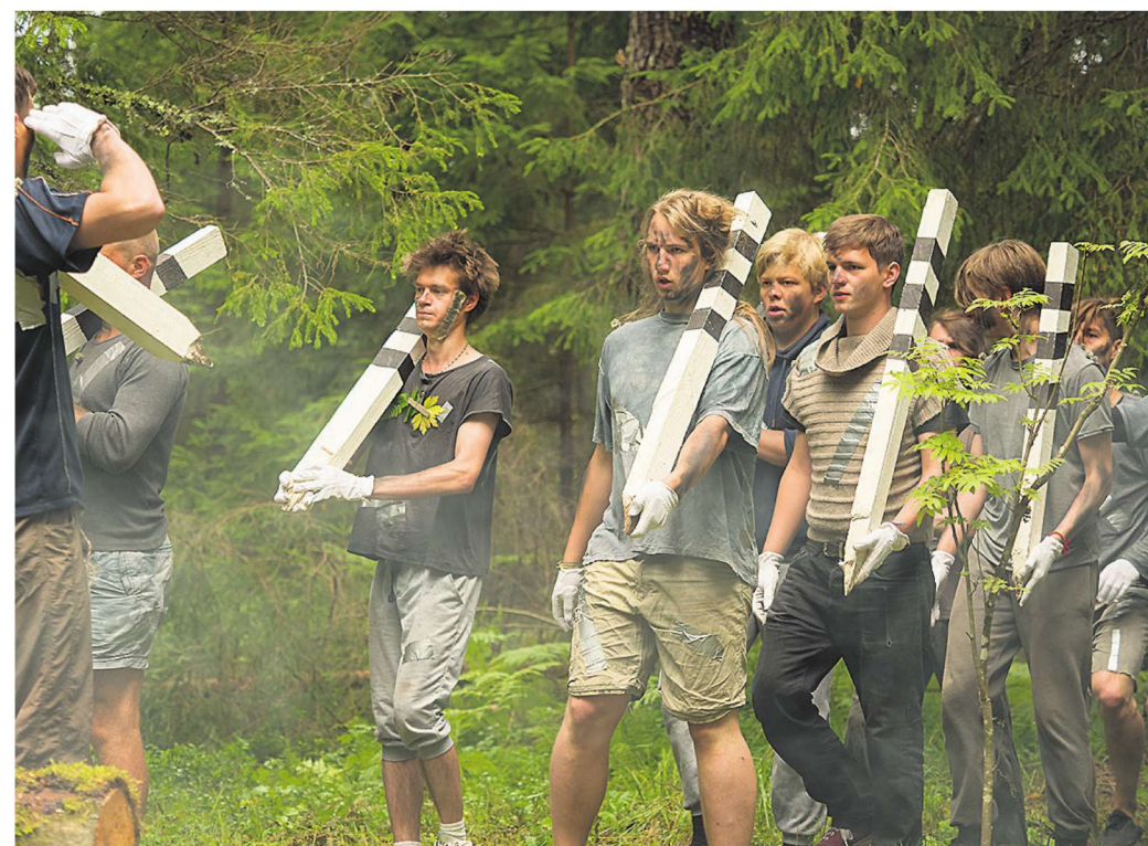
Tuli ei aidanud, võõrvõimu hallid tegelased oma vallutusretkel.