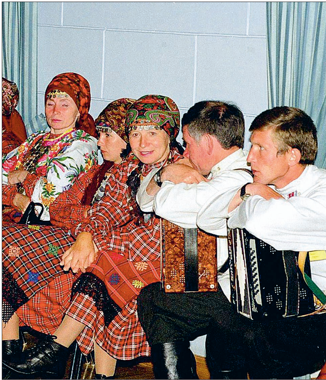
Rahvusvahelise folkloorifestivali «Baltica» Viljandi maapäevade kaugeimad külalised olid Lõuna-Udmurtiast Assanovo kolhoosikülalast. KAAREL KALA

30. juunil kella 10–15 oodatakse Posti t. 20 end kirja panema neid vähihaiged, kes soovivad sõita Piirissaare-ekskursioonile.