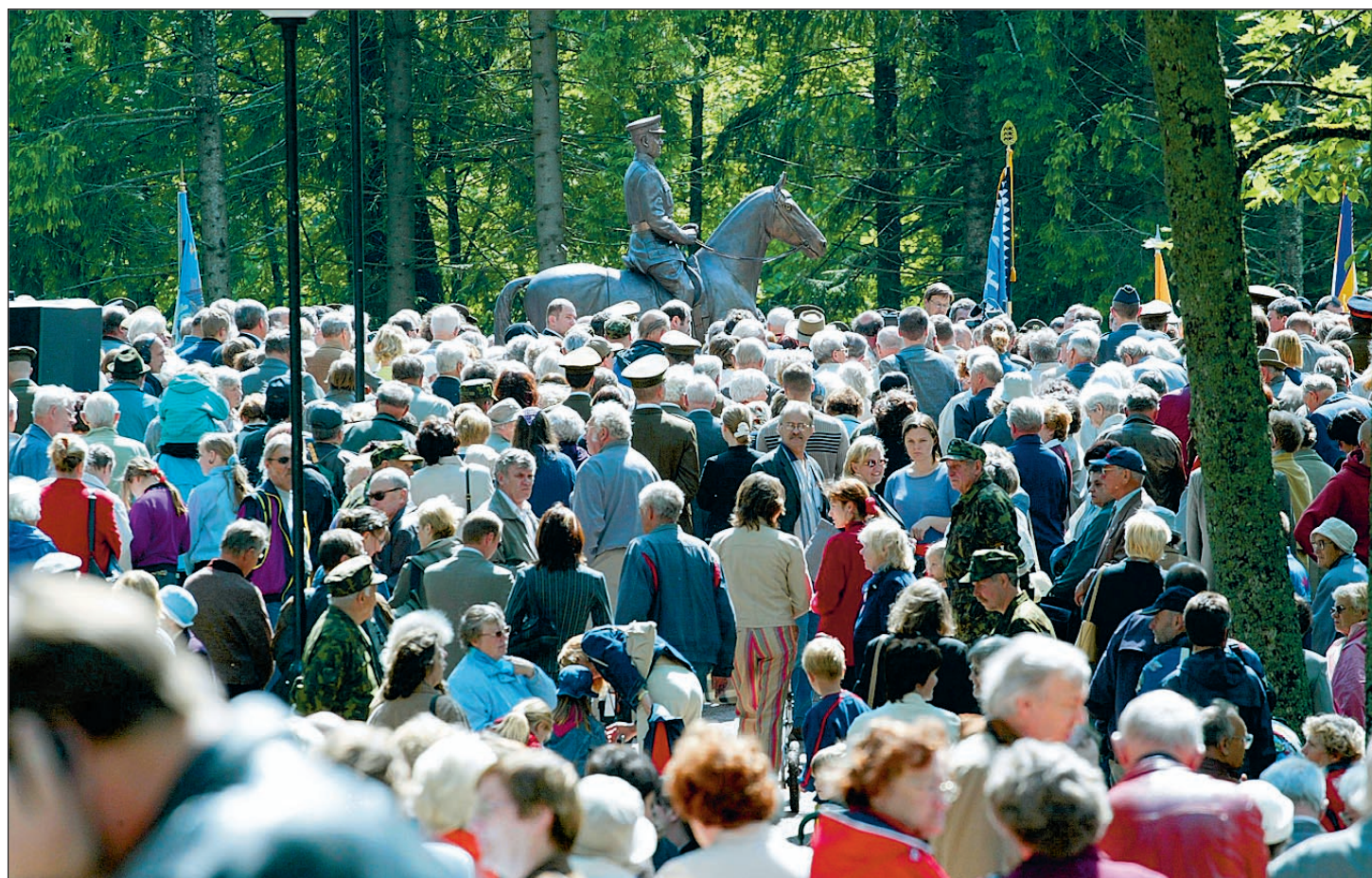
Kindral Laidoneri monumendi avamisest kujunes üle-eestiline sündmus, mida kogunes tunnistama suur rahvahulk.