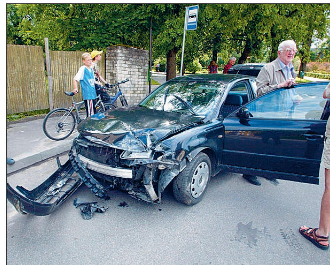
Eile päeval kümme minutit enne nelja pörkasid Viljandis Lossi ja Jakobsoni tänava nurgal kokku kaks autot. Lossi tänavalt sõitnud Volkswagen Passat, mida juhtis vanem mees, ei andnud teed mööda peateed lähenevale väikeveokile Mercedes-Benz 310. Inimesed vigi ei saanud, küll aga voolas ristmikule õli ja bensiini. ELMO RIIG