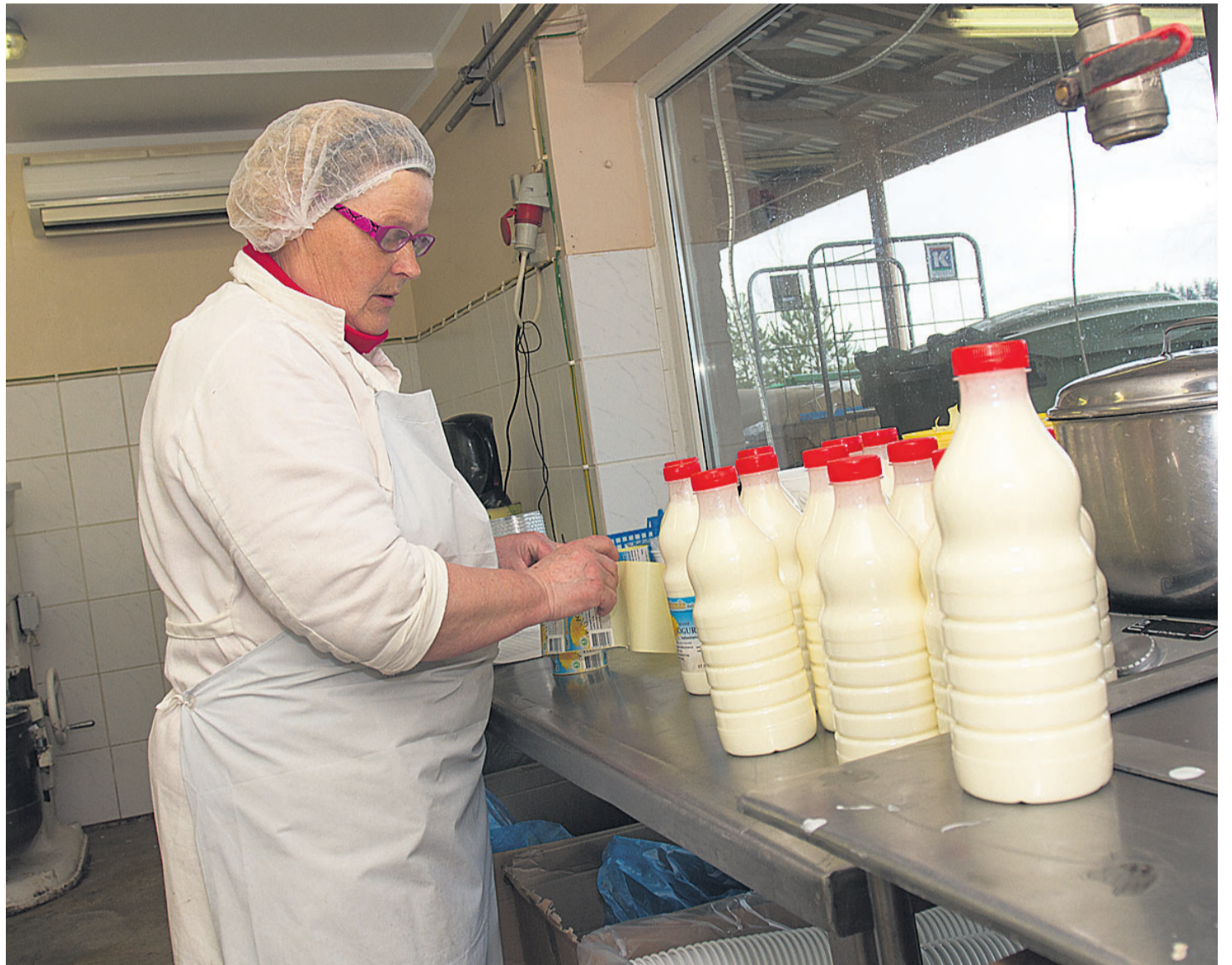
Kui piimapudelitele keeratakse Pajumäel kõrge peale nii käsitsi kui masinaga, siis pudelite sildistamine käib ainult käsitsi.

Pudelisse villitud toorpiima rasvasisaldus on nelja protsendi ringis. Seda antakse meile ka maitsta. Kuigi fotograaf joob väikse tropsi ühe hooga