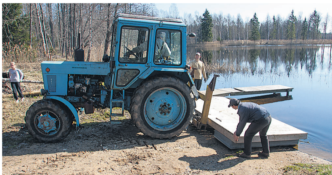
Pärstis korrastati mõisaparki ning veeti järve talvepuhkusel olnud ujumissild.

Tüüri sõnul tõi vahetu tagasiside talgupaikadest esile selle, kui tähtis on inimestele ko-