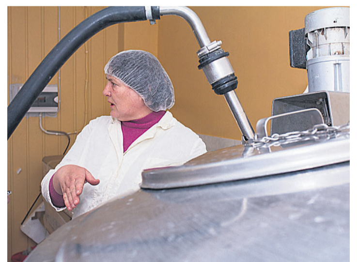
Äsja lüpsitud piim läheb torusid mööda piimatanki, kus see jahutatakse enne pudelitesse villimist kahe kuni nelja kraadini.

«Separeerimise käigus eraldatakse piimast koor ja lõss, mis siis normaliseerimise käigus kindlas vahekorras kokku viiakse, et saavutada