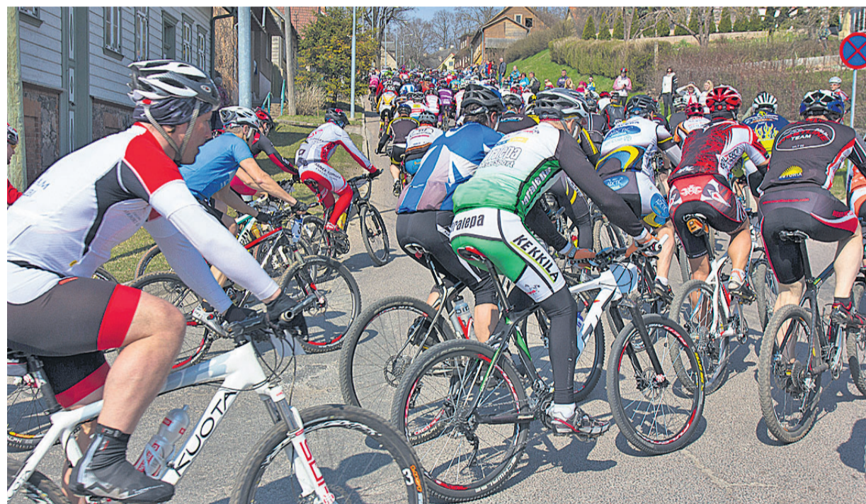
Pühapäeval 13. korda peetud Mulgi rattamaratoni põhidistantsile lähetati 1119 ratturit, kes traditsiooniliselt alustasid katsumust Tartu tänava põndakuga.