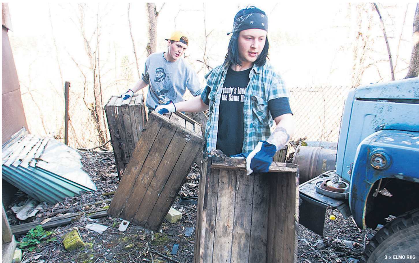
Mõned Viljandi vana lennukitehase ruumid lähevad sügisel Viljandi avatud noortetoale ja tragimad noored panid seal tööle käed külge.

enne talve välja võtnud, et vesi seda ära ei lõhuks.»