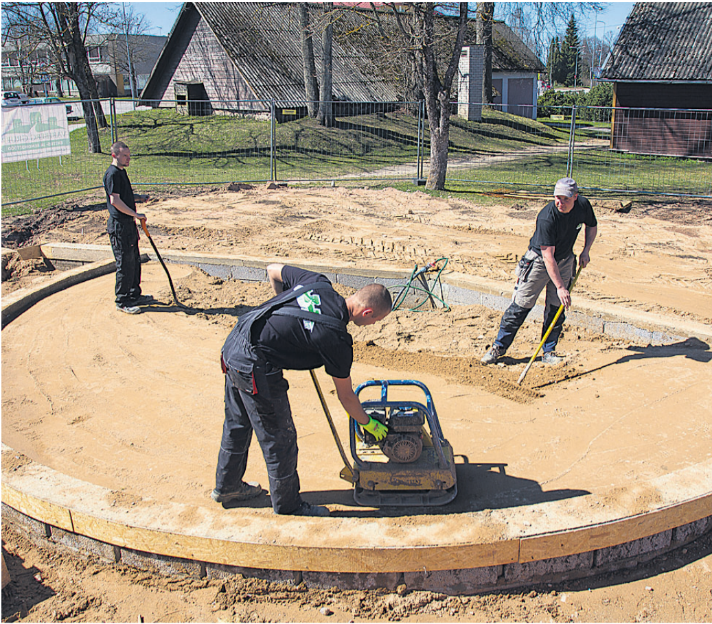
Karksi-Nuias käib uue bussiootekoja ehitus. Poolkaarekujuline klaasfassaadiga koda, milles on tuule eest varju pakkuv ooteruum, koristajaruim ning tualetid, valmib suvel. MARKO SAARM

Kogu üritus on osalejatele tasuta, tulekust palutakse varem teada anda. («Sakala»)