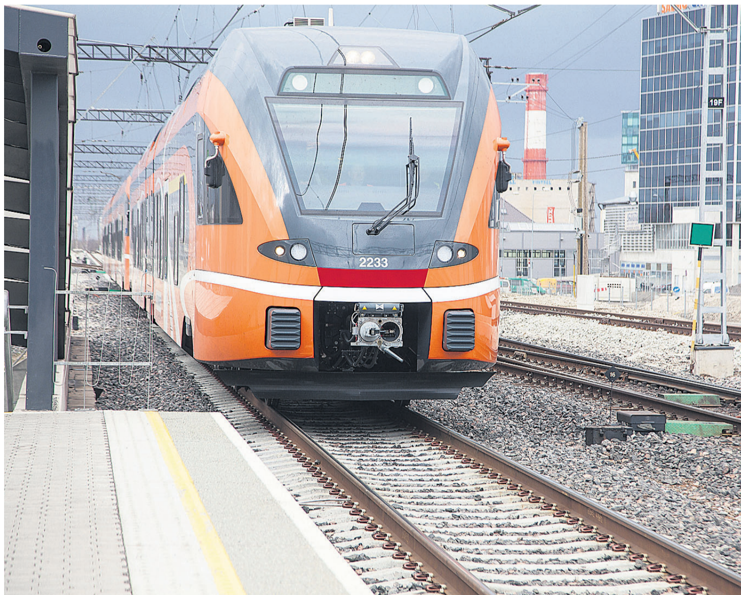
Järgmise aasta aprillist hakkavad uued rongid viljandimaalasi pealinna viima ning sealt tagasi tooma kuus korda päevas.

Möödunud laupäeval ja pühapäeval käisid Viljandimaa päästjad kustutamas viit kulupõlengut.