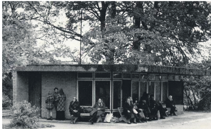
Nuia bussijaam 1970. aastatel. Tol ajal oli bussijaamas samuti käimlatega ooteruum, mille uks käis kinni.