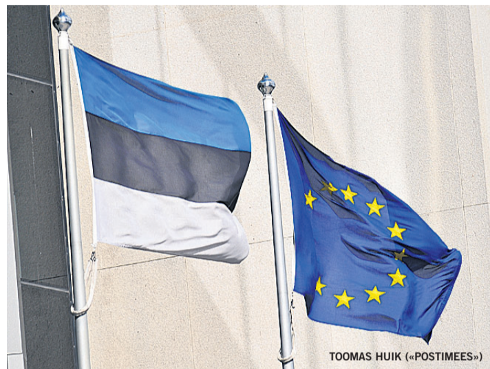
TOOMAS HUIK («POSTIMEES»)

Kriisist ajendatuna käib Euroopas elav arutelu teemal, kuidas võimalikult kiiresti majandus jalule aidata ning kuidas liitu kriiside vältimiseks tulevikus remontida. Eurooplaste ja eestlaste enamik pool-dab seisukohta, et kriisist väl-jatulekuks on vaja rohkem koostööd. Paraku takistavad edasiminekut riikidevahelised erimeelsused, mis tekivad ko-he, kui lauale pannakse mõni muudatusettepanek.