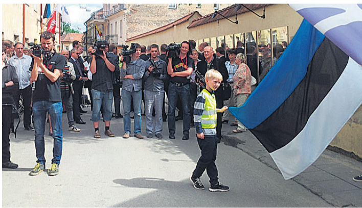
Leedu telekanalite ja veebiväljaannete operaatorid rivistusid Eesti presidenti oodates üles peaaegu sama sirgelt ja pidulikult, kui teda saabumisel tervitanud sõjaväelased. HANS VÄRE