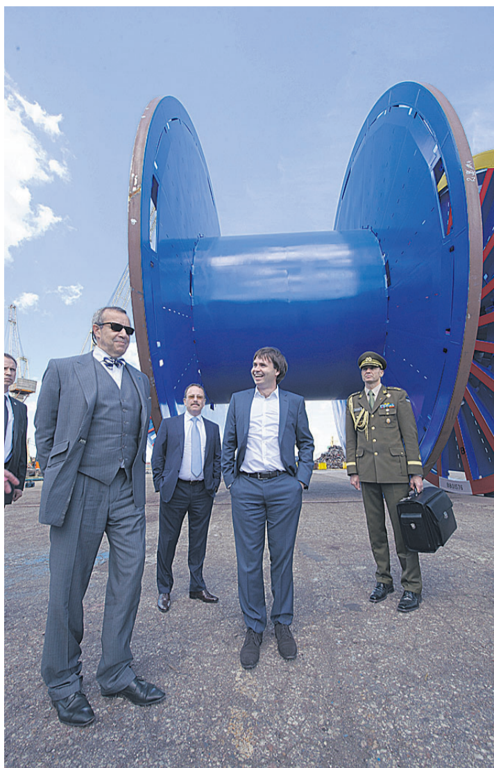
BLRT Grupile kuuluva Klaipeda laevaremonditehase kail seisavad hiiglaslikud kaablirullid. Nende abil Stockholmini veetav elektrikaabel peaks tublisti vähendama Leedu sõltuvust Venemaa elektrist.