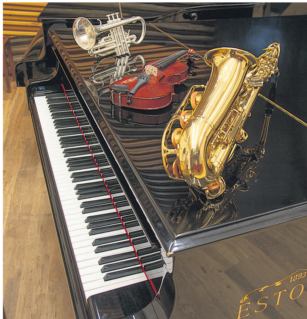
Et põhiharidus on kohustuslik ja tasuta, tuleks Viljandimaa lasterikaste perede ühenduse sõnul soodustada lapse maksimaalset arengut ka huvihariduse toel.