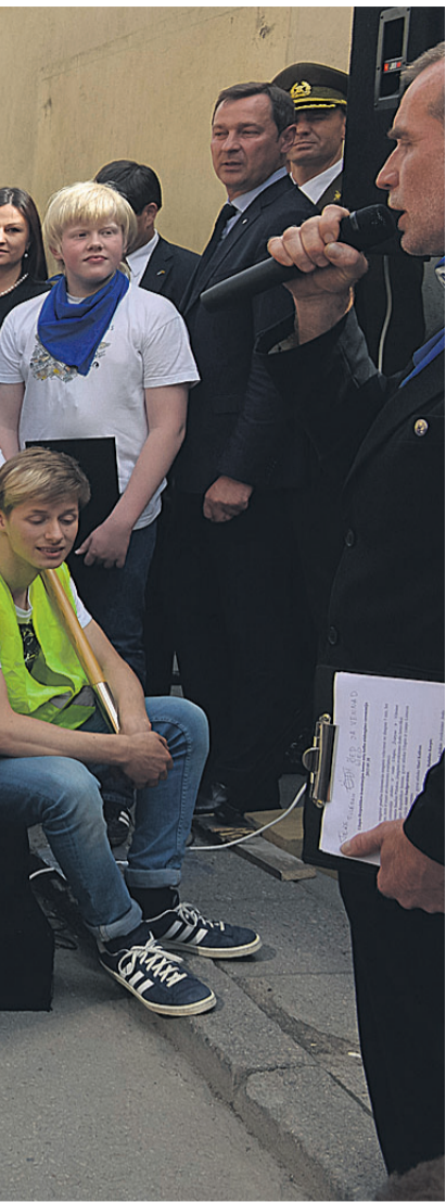
tsiaalide abil. Boheemlikus Užupises oli ja president Dalia Grybauskaitė (sinises 3 x