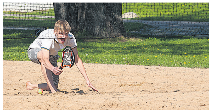
Pärast laulu- ja tantsurohket hommikuvirgust algasid pallimängud, milles rannarahvas üksteiselt möötu võttis.

Üheks lõbusamaks mänguks nii pealtvaatajate kui mängijate seas tundus naeru ja inimeste rohkuse poolest olevat pushball , milles kaks võistkonda ajasid inimesekõrgust punast palli üle mänguala piirjoone. Polnud mingi ime, kui mõni neiu üle palli veeres ja teisele poole maha prantsatas. See andis siiski vaid mängulusti juurde ning mäng jätkus sama suure innuga.