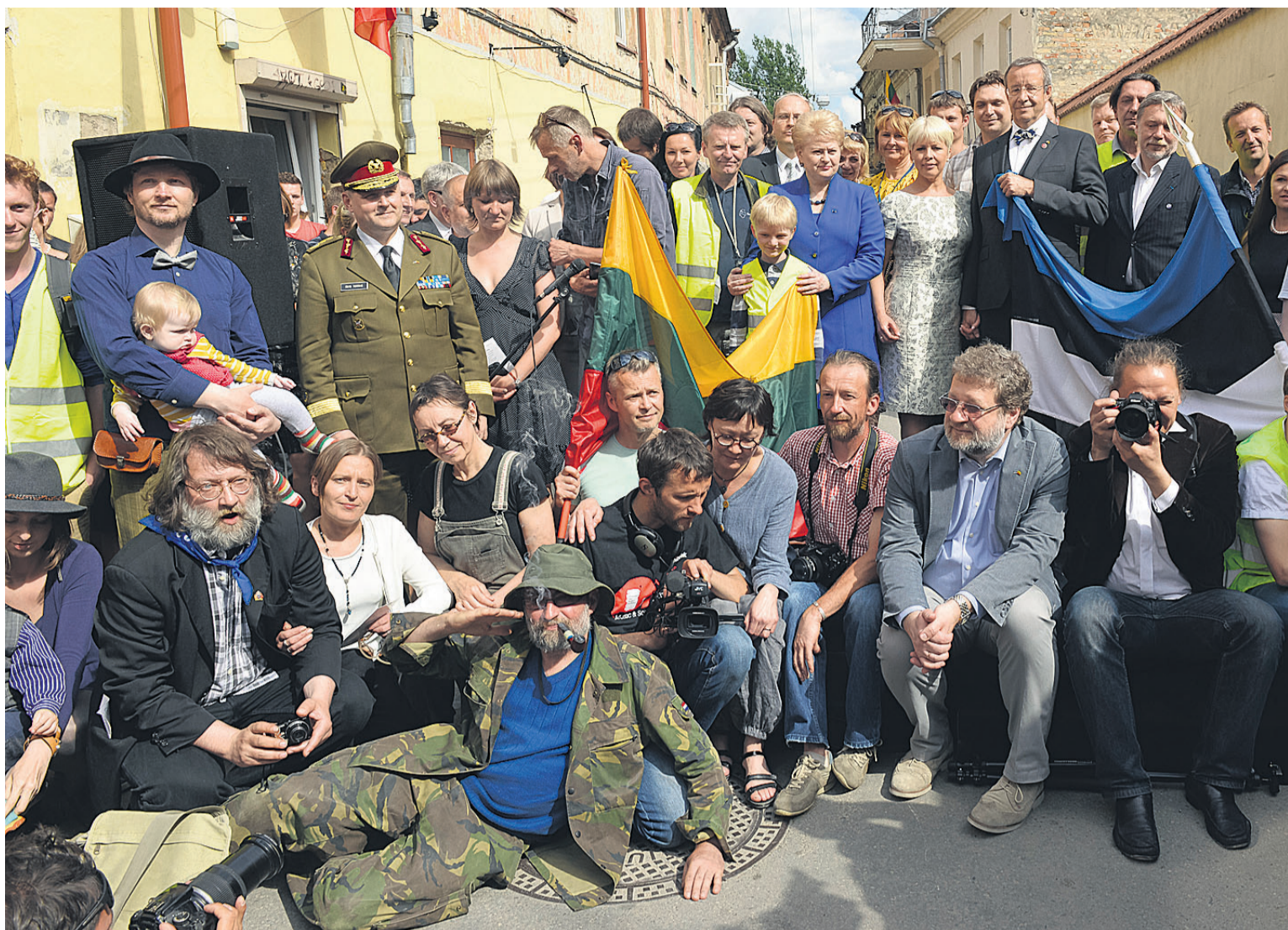
Ametlikel kohtumistel tehakse riigijuhitidest grupifotosid väga kindla paigutusega: iga pildil olija leiab õige koha pörandale kleebitud lipuvärvide või iniseevastu täiesti loomulik, et pildile võisid minna kõik, kes tahtsid, ja soovi korral end kas või pikali visata. President Toomas Hendrik Ilves, Evelin Ilvese (kostüümis Evelin Ilvese kõrval) võeti iseenesestki mõista keskele.