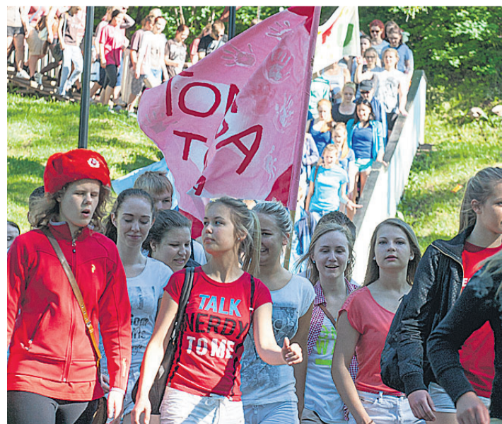
Viljandi gümnaasium lõpetas oma esimese kooliaasta mängudega rannas, kus kõik õpilased said veel enne suvepuhkusele minekut kokku.