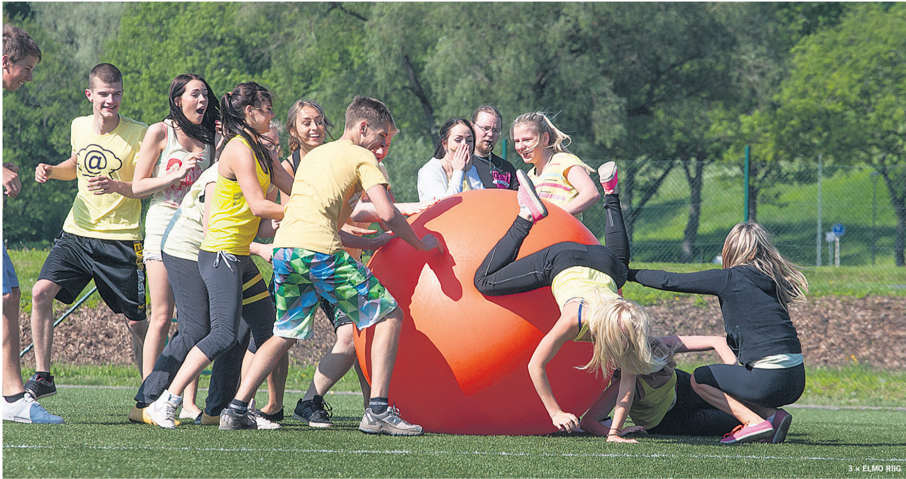
Suure punase palli tagaajamine ehk pushball 'i mängimine tekitas iseäranis palju lõbu nii nende gümnaasistide seas, kes veeresid üle palli maha, kui nende seas, kellest pall üle veeres.

Politsei sai avalduse inimeselt, kes teatas, et ööl vastu 31. maid kella ühe ajal on Viljandis ühest Väiksel tänaval asuvast korterist varastatud arvuti ja 20 eurot.