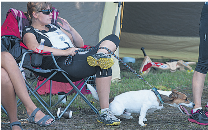
Kuumusest hoolimata kibelesid kõik võistlejad rajale.

Pärast võistlusi andis ta kaks päeva koolitusi. Tirmaste avaldas lootust, et ehk on täna aega kohtunikule ka lin-