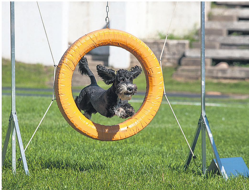
Koerad tegid, mis suutsid, et läbida takistusrada võimalikult kiiresti.

Süsteemi valmimise tähtajaks on 2014. aasta jaanuar. (E24.ee)