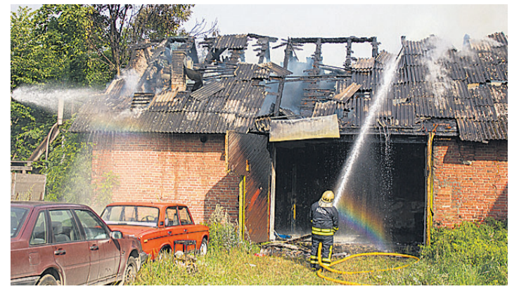
Lahtise leegiga põlenud maja katus sai tugevalt kahjustada ning hoone ise suitsukahjustusi.

Kõiki tulemusi saab näha veebiväravast http://www.agilitykoer.ee/ . Seal on kirjas ka Viljandis asetleidnud rahvuslike ja rahvusvaheliste agility võistluste saavutused.