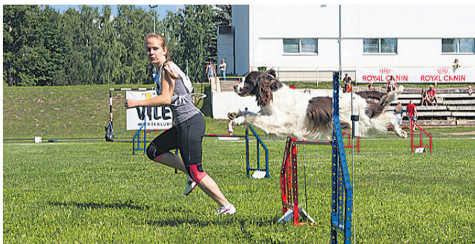
Rasketes tingimustes tuli anda endast maksimum.

na tutvustada, sest seni oli too näinud vaid võistlusrada ja majutusasutust.