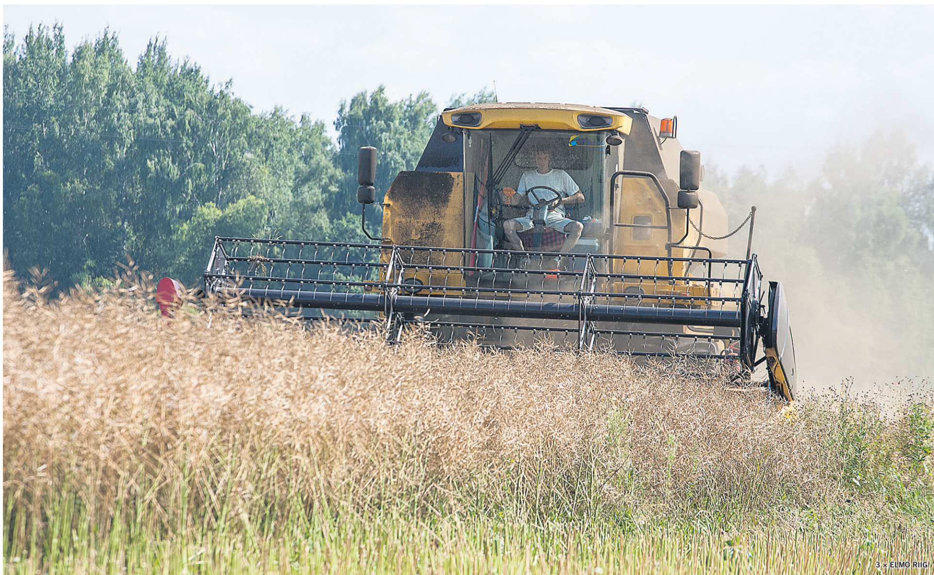
Kombain läks Kissa-Märdi talirapsipõllule juuli lõpul.