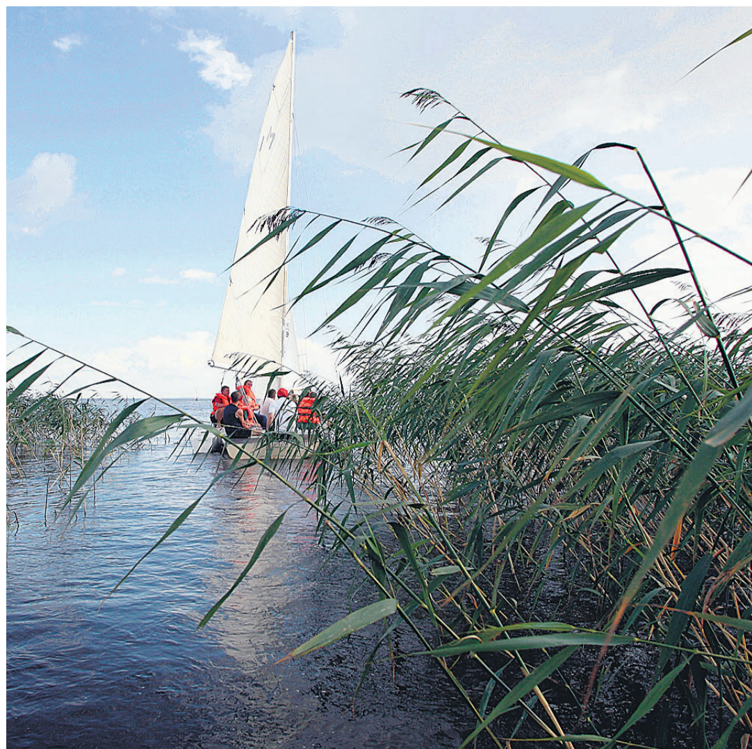
Võrtsjärve kallas on 1980. aastate keskpaigast üha tihedamini pilliroostunud ning see võõnd on aina enam järve avavee poole laiinenud.