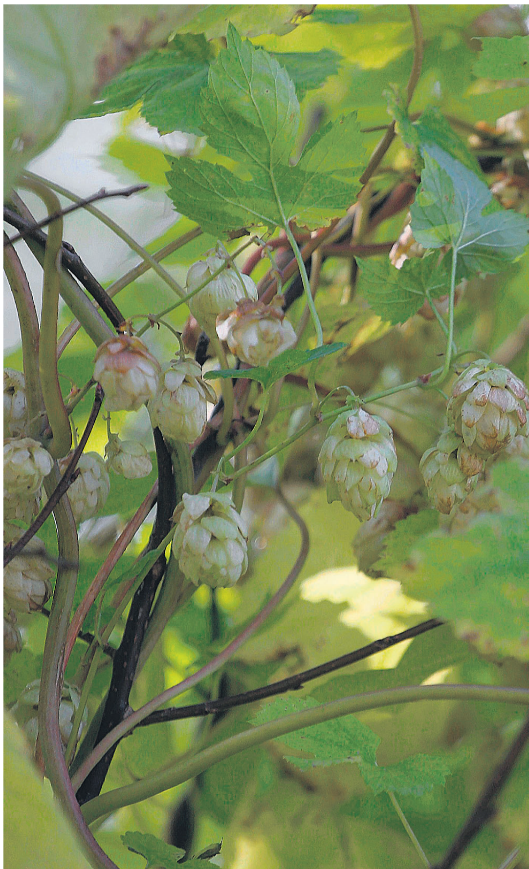
Humalakäbid lisavad õllele maitset ja aroomi.

Veel saab Vikipeediast teada, et esimest korda kultiveeriti humalat Saksamaal Hallertau piirkonnas 736. aastal. Õlle sisse visati käbid esimest korda teadaolevalt aastal 1079.