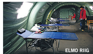
Täna ja homme võib Vabaduse platsil näha doonoritelki.

Neil, kes täna või homme telki ei jõua, võivad minna 29. augustil kella 9.45–13 Viljandi haigla C-korpuse kolmanda korruse saali, kus verekeskus taas doonoreid ootab.