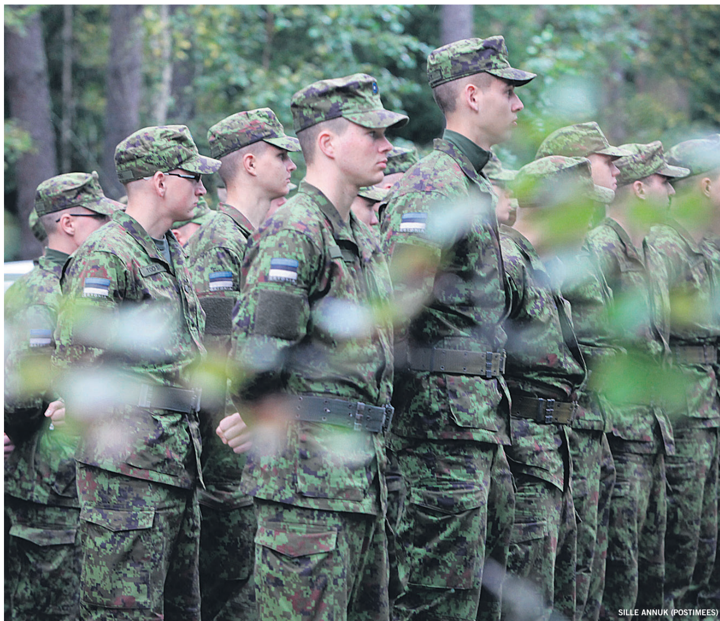
82 protsenti küsitluses osalenud kaitsevällastest tunnistas, et uut sorti menüü kasutamise korral on kõht päeva jooksul ühtlasemalt täis.

Pakkuja peab kuuluma eriala loomeliitu, omama kunsti- või arhitektuuriharidust või olema viimase viie aasta jooksul teostanud kaks või enam avalikku ruumi paigaldatavat skulptuuri, millest ühe maksumus on vähemalt 15 000 eurot. Hanget rahastab Euroopa Liit. (BNS)