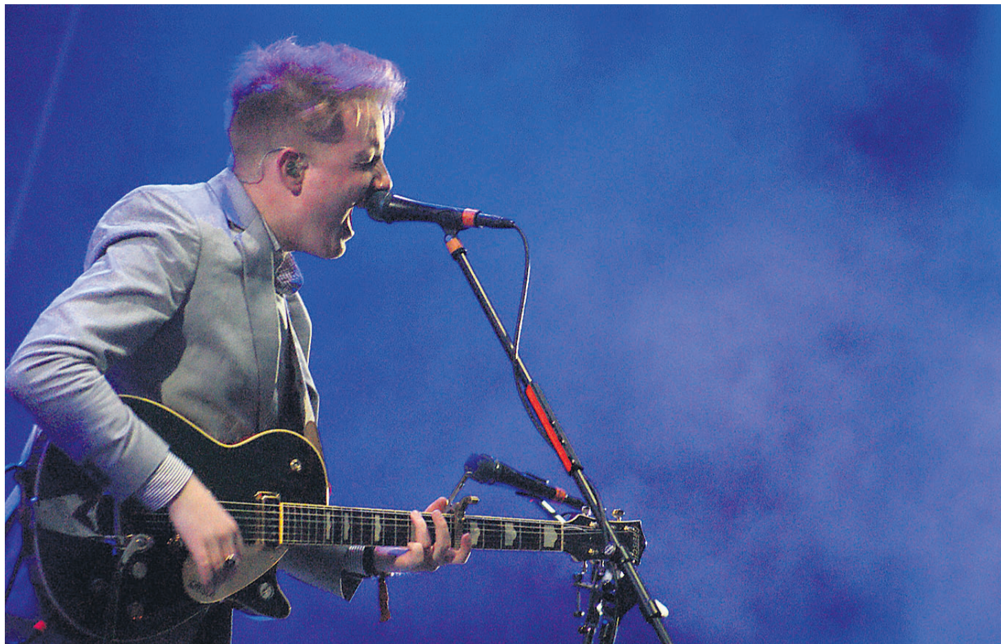
Lätlased on julgenud kutsuda ka uusi muusikuid. Tänavu ühe peasinejana üles astunud iiri bänd Two Door Cinema Club esines «Positivusel» esimest korda neli aastat tagasi. Siis oli see ansambli esimene kontsert väljaspool Ühendkuningriiki.

Nädalavahetusel tuleb Paides arvamusfestival, kus 150 inimest räägivad paarikümnes paigas Eestis aktuaalsetel teemadel.