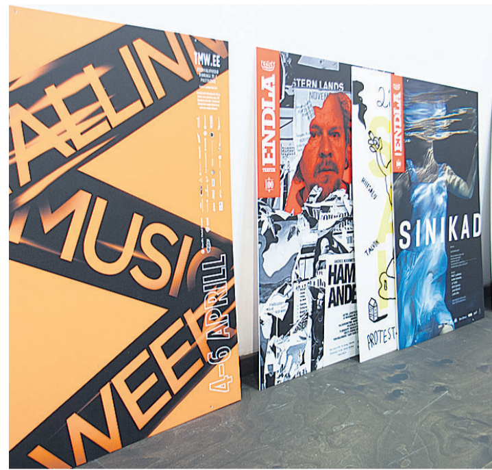
Linnagaleriis näeb Haapsalu graafilise disaini festivali näitust «Eesti kultuuriplakat 2013».

Tänased nimepäevalised on Gisella ja Svea.