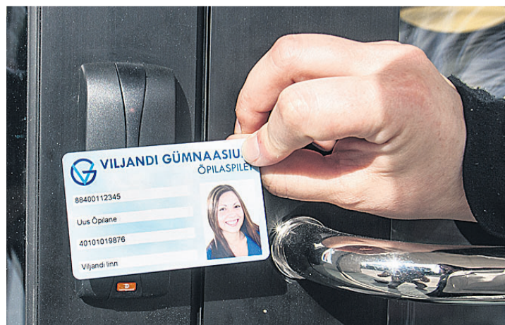
Õpilaspiletis on peidus magnetluku võti, millega peauksest sisse pääseb.