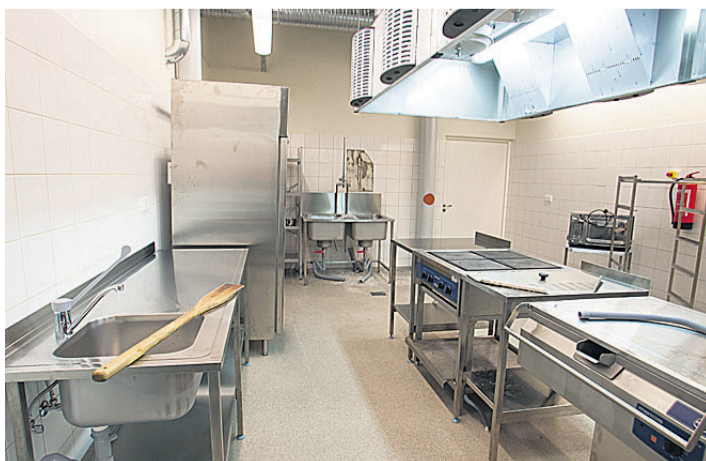
Pilk köögi poolele. Ultramoodne sisustus ja vana hea puust möla.