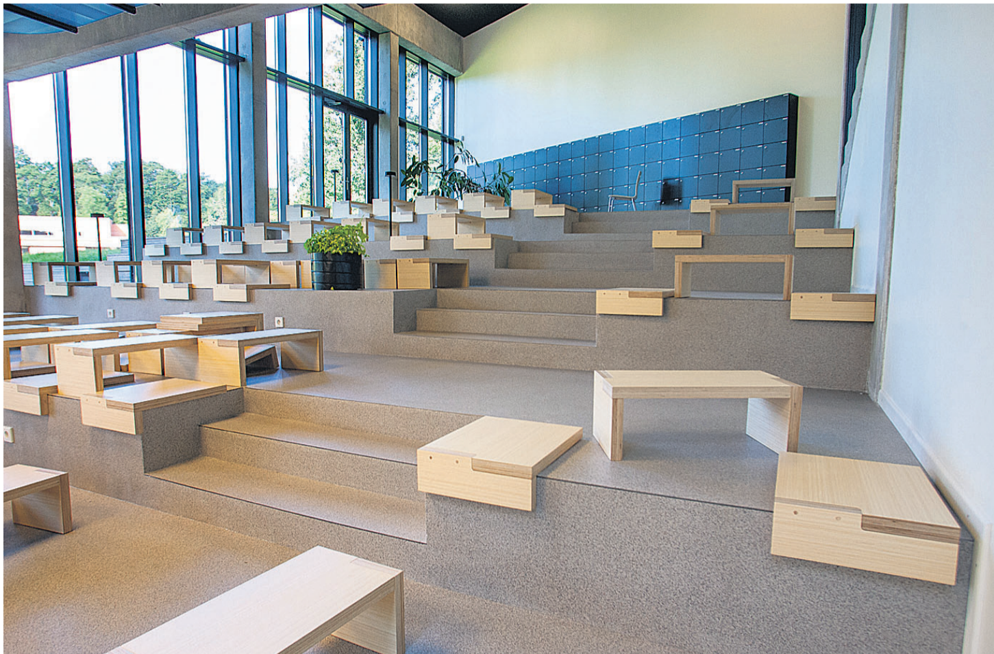
Moodsa arhitektuurekelega koolimajas on üks põhilisi pilgupüüdajaid 120 meetri pikkune avar ja valgusrikas ühisruum, kus fantaasiaküllastel trepistikel on igapäev võimalik originaalsete istumisvahendite abiga endale mugav koht leida.