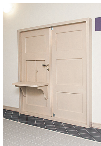
Üks, mis ei vii kuhugi. Tegemist on mälestusega vanast sööklast.

«Kõige erilisem on uus hoone ise oma ruumilahendusega,» on Ülle Luisk veendunud. «Teist sellist ehitamisvõimalust koolimajadel Eestis niipea ei tule. Teised riigikoolide majad renoveeritakse olemasolevatest ja ruume seal ju ümber ei paigutata. Ja muidugi oleme erilised meie ise.»