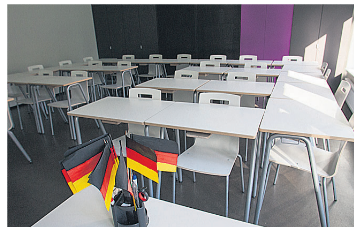
Võõrkeelte klass on sama sisustusega nagu kõik ülejäänud klassiruumid.