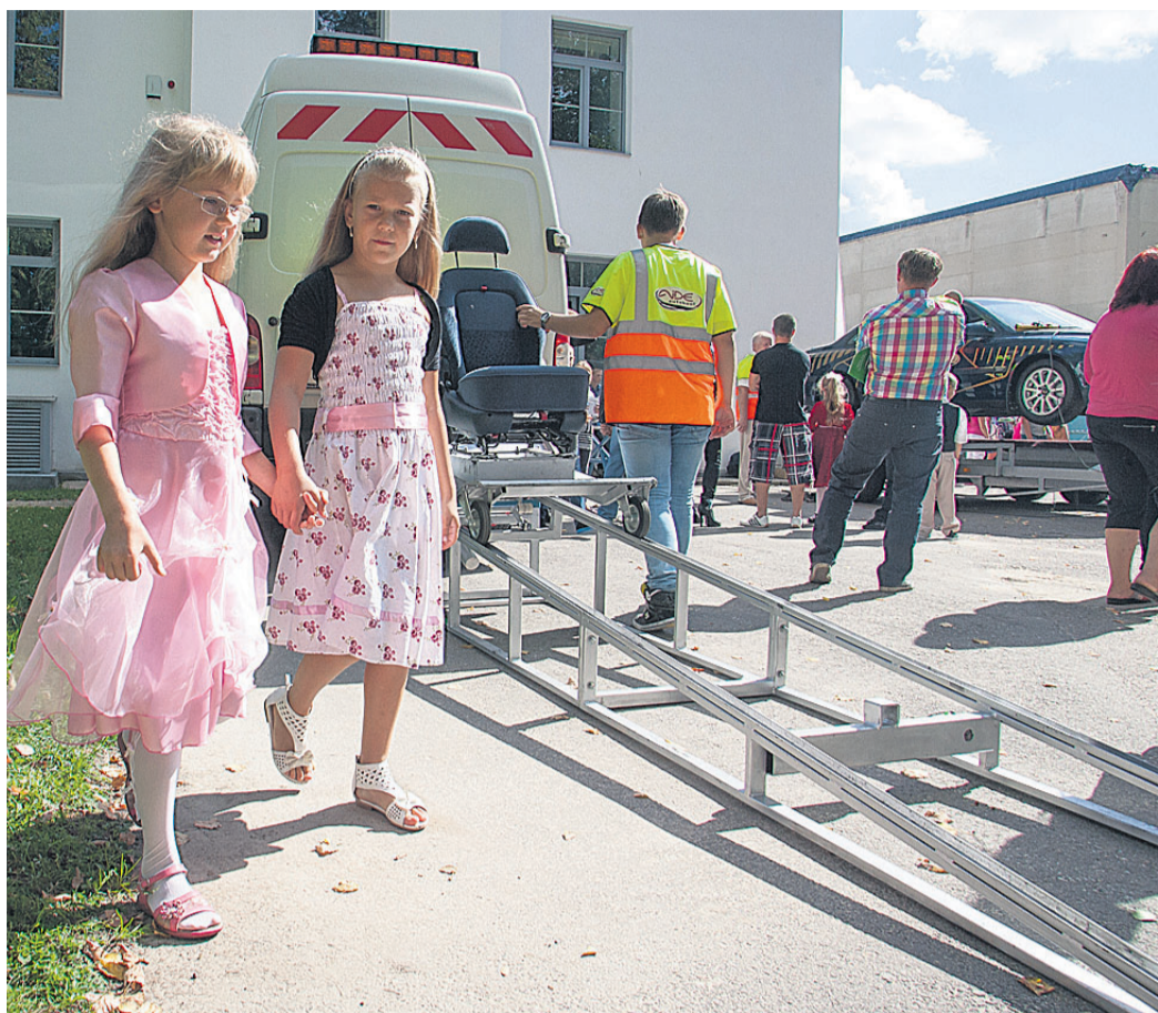
Maanteeameti spetsialistid jagasid Tarvastu vallas kooliteed alustavatele lastele teadmisi liiklusohutusest. Maavalitsuse andmetel läheb tänava Viljandimaal kooli 450 last. ELMO RIIG