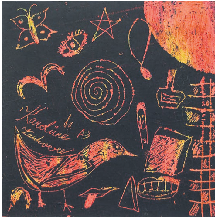
Viljandi muuseumis on vaadata Viljandi huvi- ja kunstikooli õpilaste ühishäitus «Mustrimängud».

Viljandi muuseumis on 5. oktoobrini Viljandi huvi- ja kunstikooli õpilaste ühishäitus «Mustrimängud». Johan Laidoneri plats 10. Tel 433 3316.