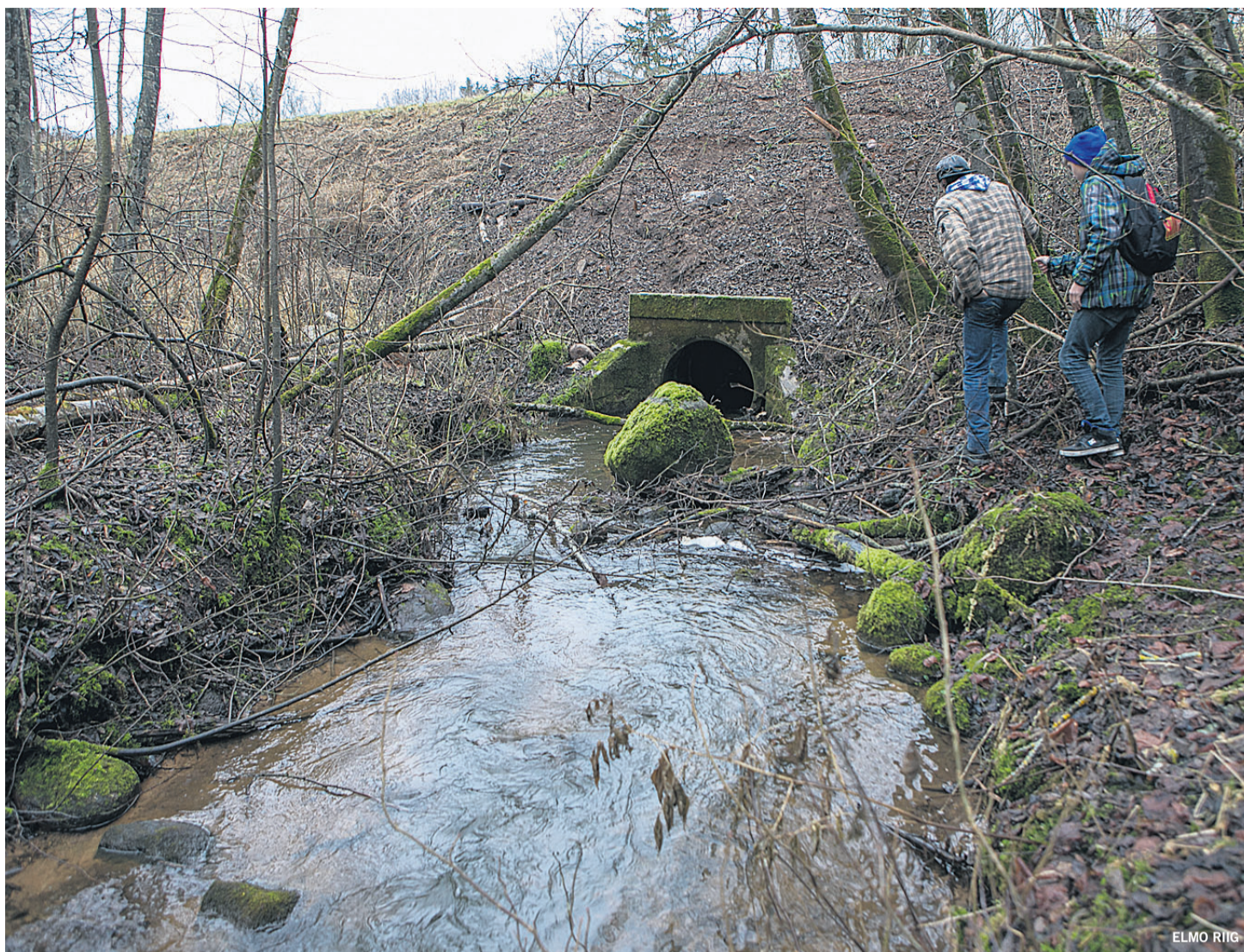
Tarvastu valla keskusest umbes kilomeetri kaugusel lõunas lookleb võsarägastiku vahel Mustla peakraavi nime kandev veekogu, mille ääres Äm- muste kooli õpilased aeg-ajalt seiklema käivad. Ministeriumi kava näeb ette nimetada see Raaga ojak, sest nii tuntakse seda rahvasuus.