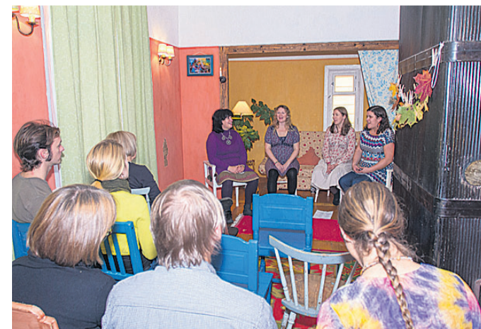
Laudaukse Kääksutajad pakkus sügisel kodukontserdil külalistele peale muusika kodusooje kapsa- ja porgandipirukaid. MARKO SAARM

«Maarja juures on hea ja sobiv ruum,» kinnitas Vabarna. «Pärimusmuusika keskuse idee ongi oma tegevust laiendada aidast välja. Kindlasti teeme ka kodukontserte edasi.»