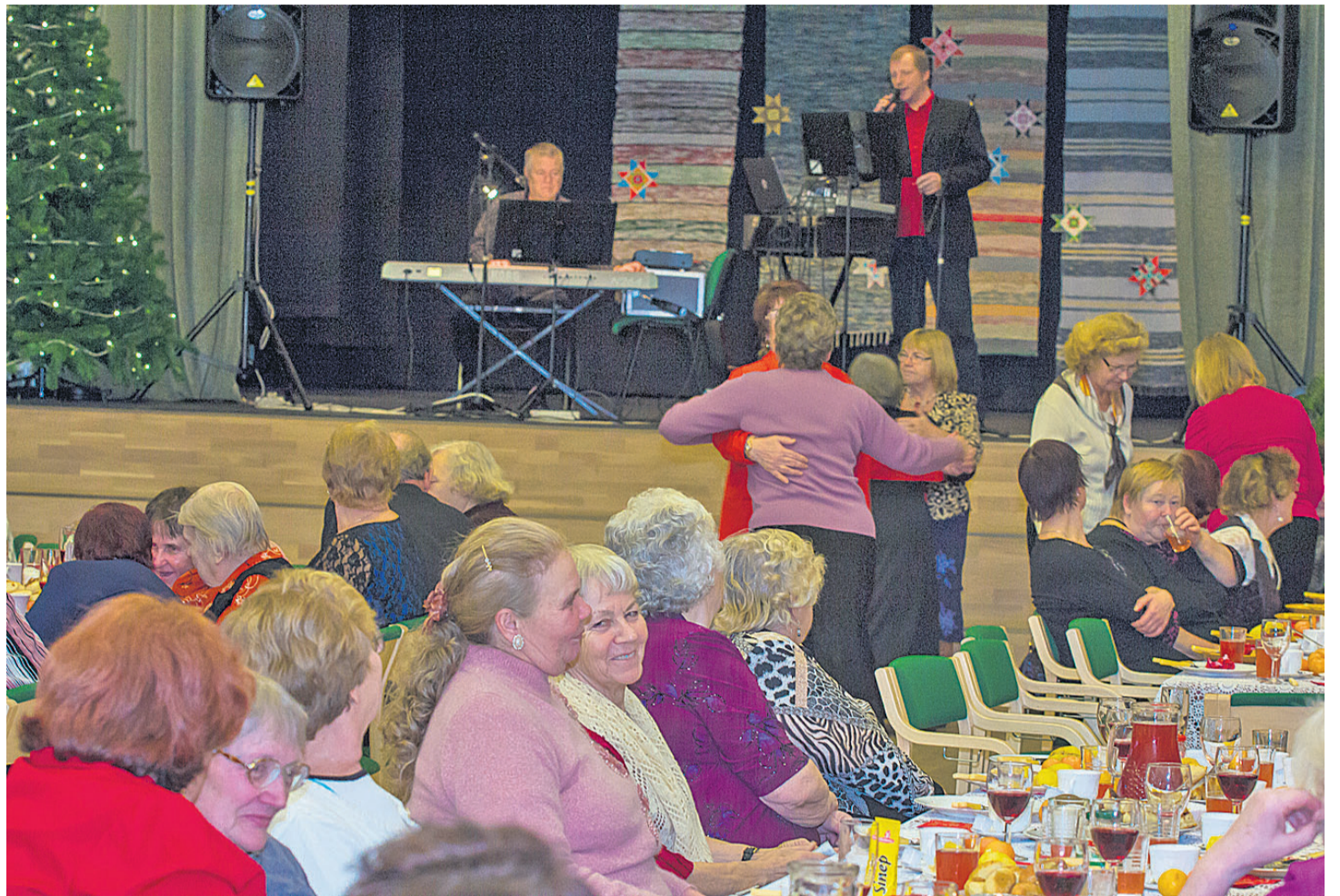
Mustla rahvamaja kogunenud pidulistel oli köhutäitmise ja jutlemise kõrvalt mahti end ka tantsupõrandal liigutada.

Eakate jõulupeoks on sotsiaalnõuniku andmeil juba mitmendat aastat ette nähtud umbes 2500 eurot. Peale toidu-