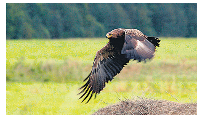
Maalasti looduskaitseala on suur-konnakotka püsielupaik. ELMO RIIG

Eestis on viis rahvusparki, 138 looduskaitseala, 151 maastikukaitseala, 116 vana kaitsekorruga ala ja 537 parki. Kokku hõlmavad need 18,1 protsenti riigi maismaa pindalast.