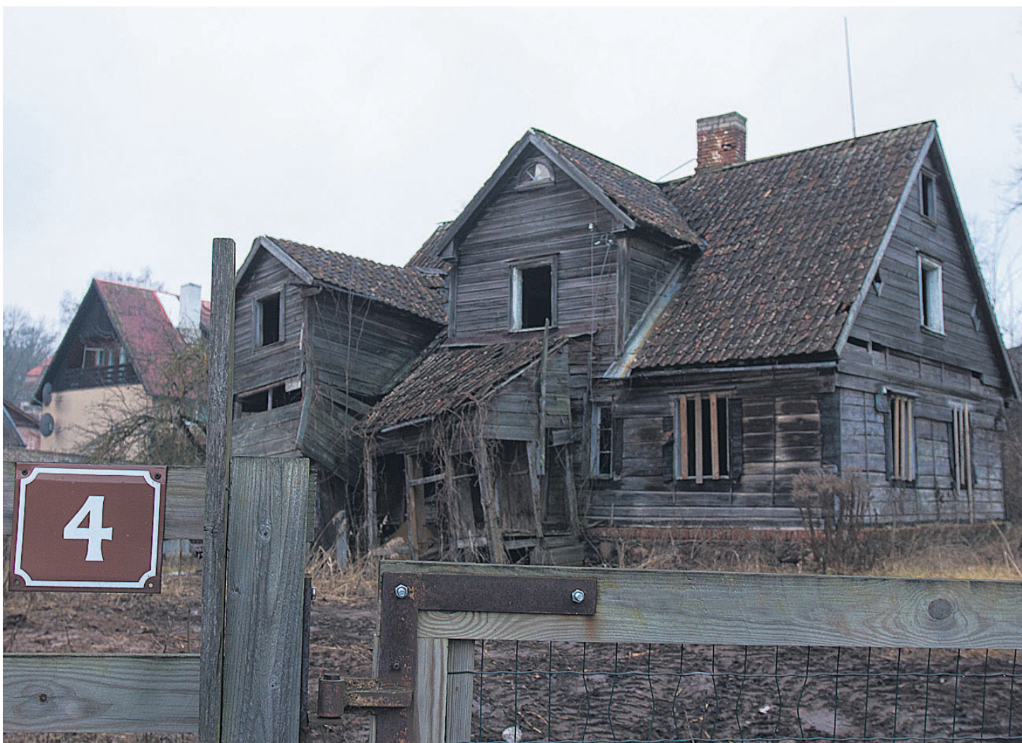
Praegu asub Järve tänav 4 kinnistul ühekorruseline viilkatuse ja uukidega laudvoodrita palkhoone, milles pole aastaid elatud ning mille seisukord on väga kehv. MARKO SAARM

12 uuest ilmakodanikust tervelt 10 on poisid. Sealjuures sündisid mõlemad tüdrukud 21. detsembril, mil poisse ei sündinud. Nii 24. kui 25. detsembril sündis kaks poissi. 26. detsembril polnud lõunaks ühtegi last sündinud. (Sakala)