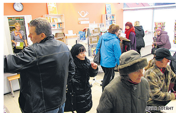
23. detsembril kella 11.15 paiku oli Viljandi postkontoris korraga kümnekond inimest, aga mõni hetk hiljem juba poole vähem.

«Erinevaid teenuseid kokku võttes võib öelda, et kui siseriikliku postituse maht on detsembris eelmise aastaga võrreldes kasvanud 5 protsenti, siis rahvusvahelise postituse maht koguni 30 protsenti,» lisas Tonka.