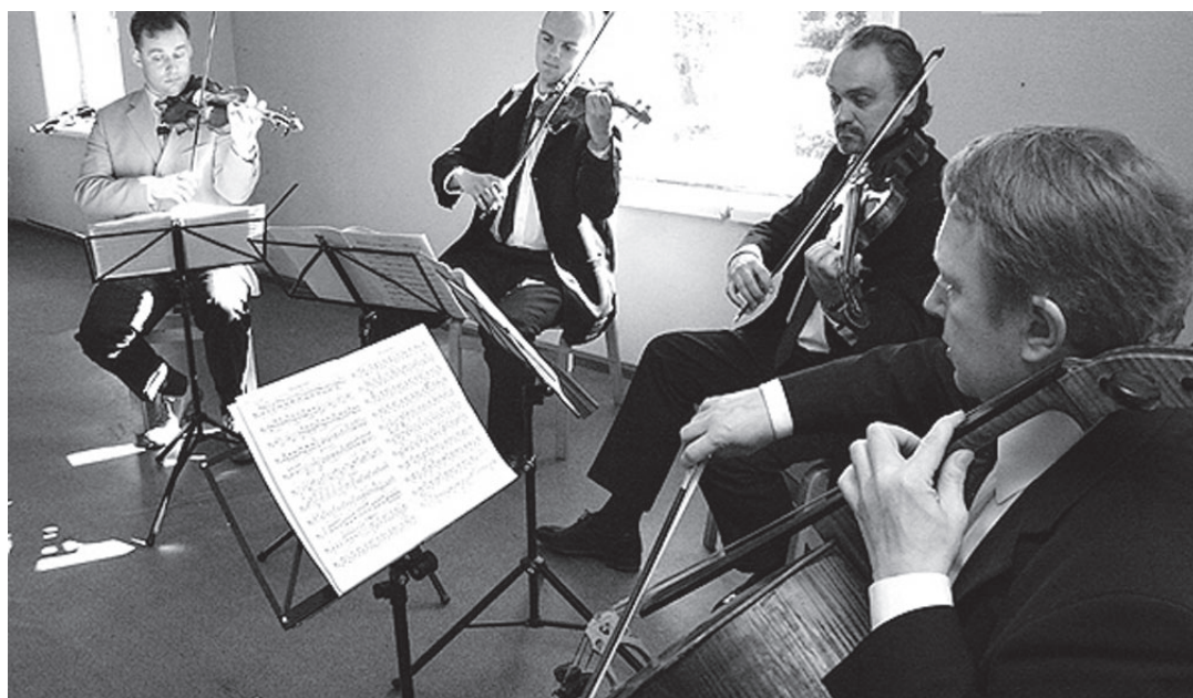
Pärimusmuusika aidas algab täna kell 18 Tobiase keelpillikvarteti aastalõpukontsert.

Paistu rahvamajas 31. detsembril kell 21 aastavahetuse pidu. Tantsuks mängib Mait ja Mar-