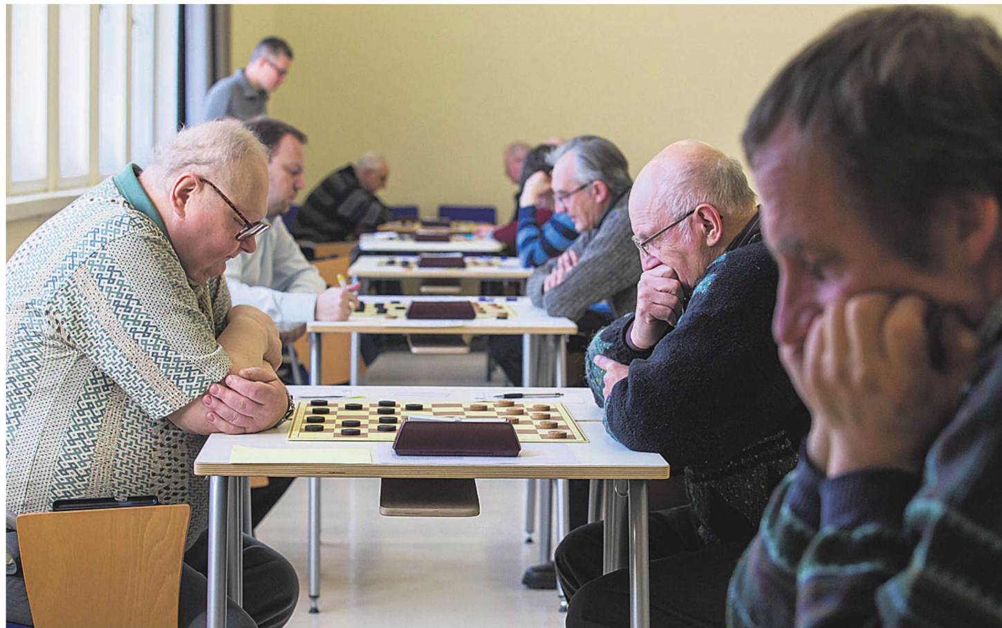
12 meest ja viis naist hakkasid eile Viljandi gümnaasiumi aulas Eesti 64-ruudulise kabe meistrit selgitama.

BOWLING. Viljandi bowling'uklubi ootab kolmekümmet viieliikmelist võistkonda registreeruma veebruaris algavale maakonna firmaliiga kevadetalpile. Oma osavõtusviisi saab teada anda e-aadressil viljandi.bowling@gmail.com.