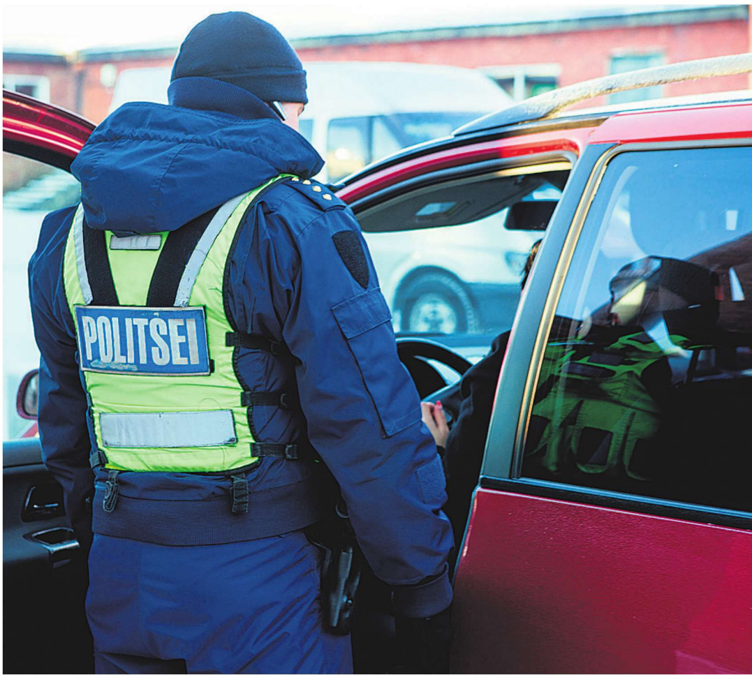
Politseinikud kontrollisid eile Viljandis turvavöö kasutamist.