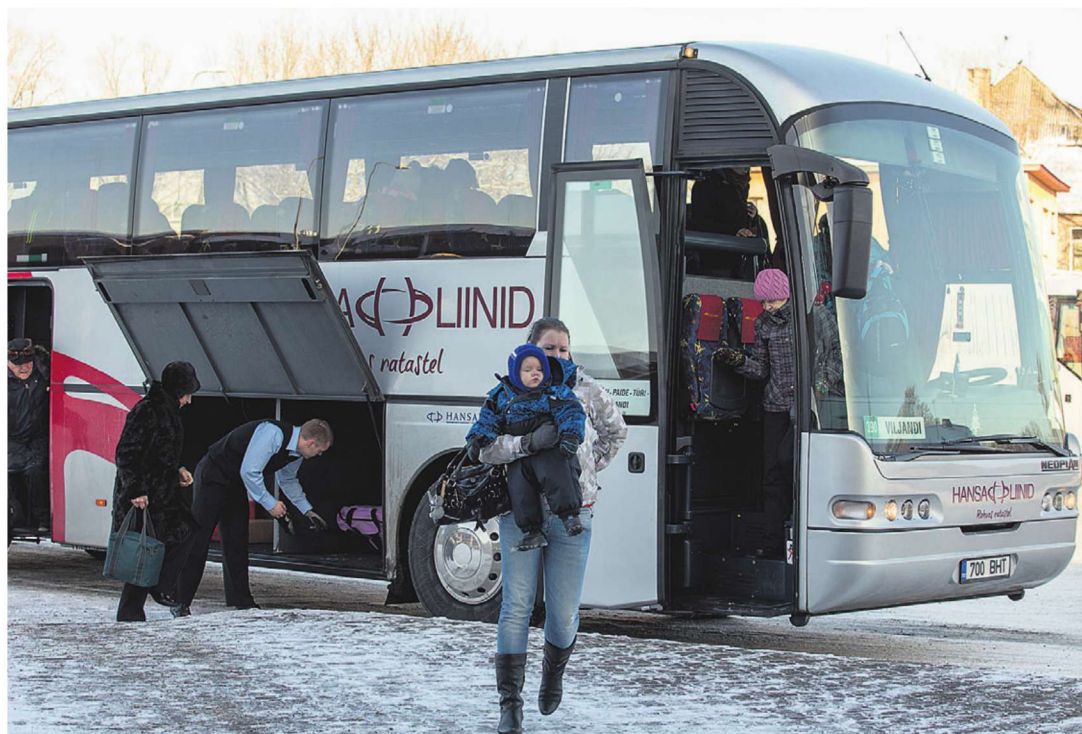
Et konkurents rongide ja busside vahel on äge, langetas Hansa Liinid Viljandist Tallinna ja tagasi sõitvates bussides piletihindu. Mõnel puhul võib vahe varasema hinnaga olla paar eurot.